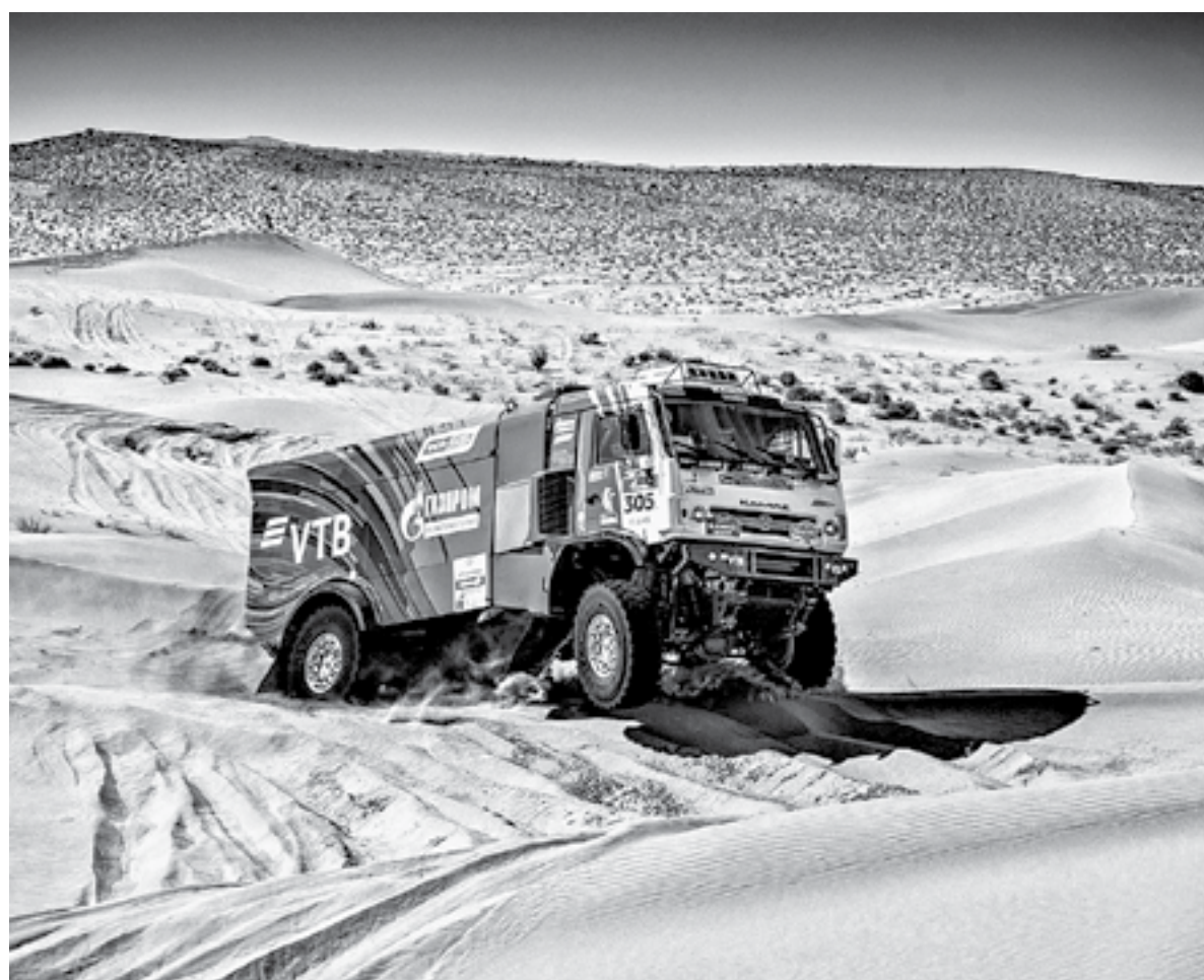
Участниками международных соревнований станут около 100 экипажей, которые будут стартовать в нескольких классах: грузовики, джипы и мото- и квадроциклы.