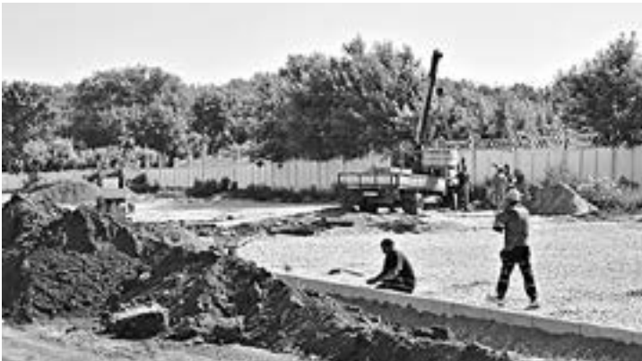
Строительство футбольных полей в самом разгаре.

Большой футбол – мечта многих ребят. На соседнем со строящимся полем с искусственным покрытием тренируются мальчишки, отрабатывая удар по воротам. На спортшколе «Рубцовск» занимается свыше 200 детей под руководством шести тренеров. С открытием двух новых площадок появится возможность привлечь к футболу еще больше юных рубцовчан.