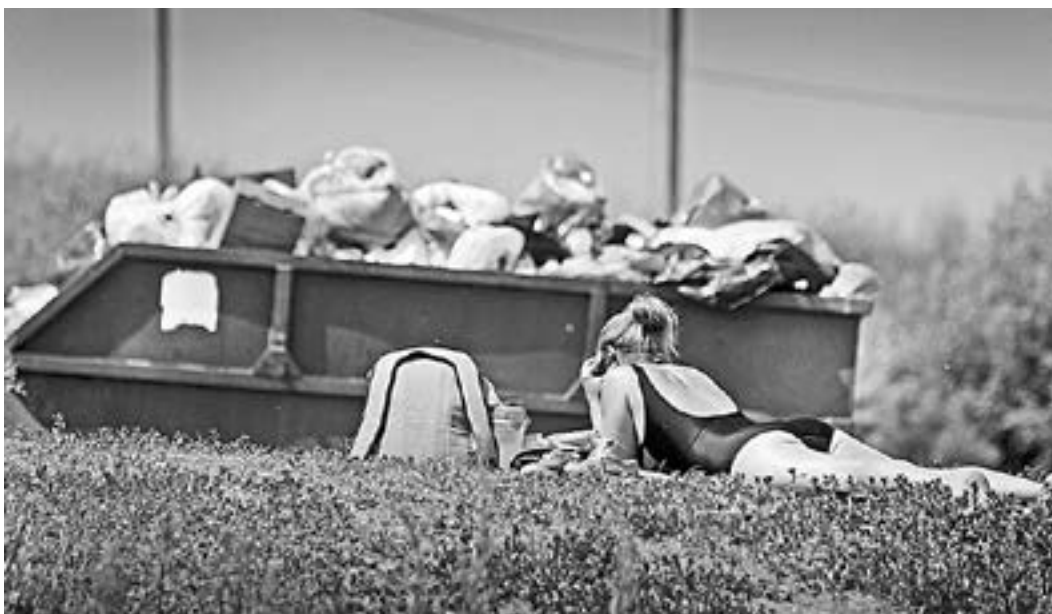
Берег у «Леруа Мерлен» не особо чистый. Но это не смущает любителей позагорать.

– Значит, ждите, пока протесты, а затем отправляйтесь на базу, – повторяет инспектор. – Пока лодку вытаскивайте на берег: нельзя ее эксплуатировать с такой комплектацией.