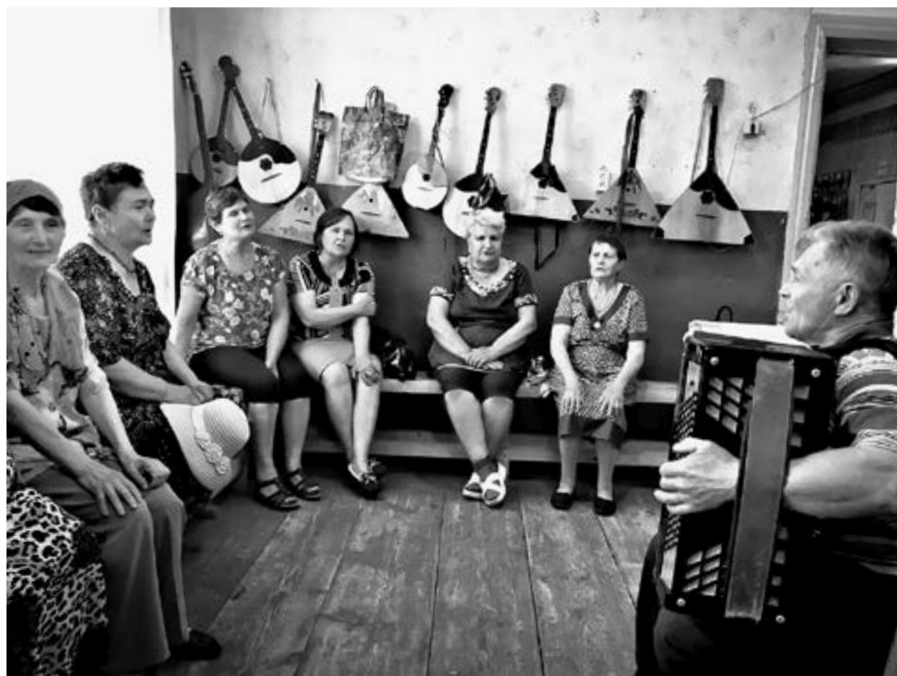
«Алтаечка» репетирует в тесном кабинете.

В Доме культуры занимаются 13 коллективов. Их посещают около 200 человек самого разного возраста: от малышей до бабушек. Для репетиций и мероприятий остались фойе и пара кабинетов. Для участников составили график. В день нашего визита репетировал ансамбль народной песни «Алтаечка». Иногда пользуются помещением библиоте-