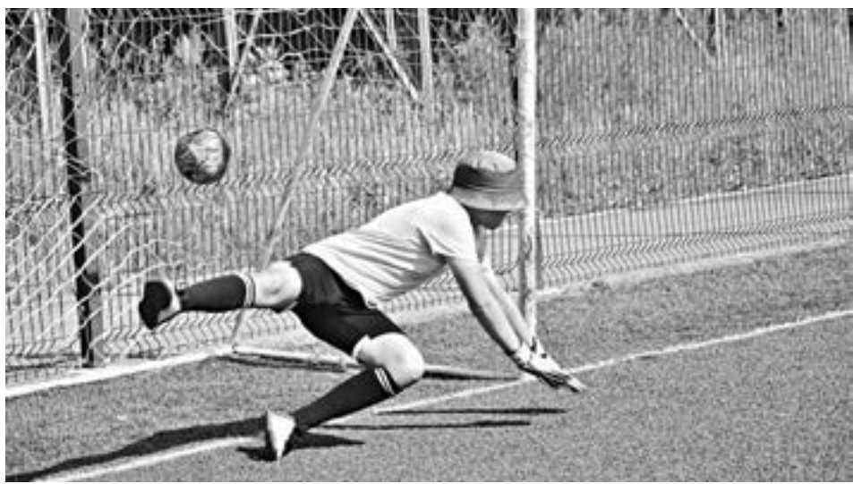
Тренируются юные футболисты.