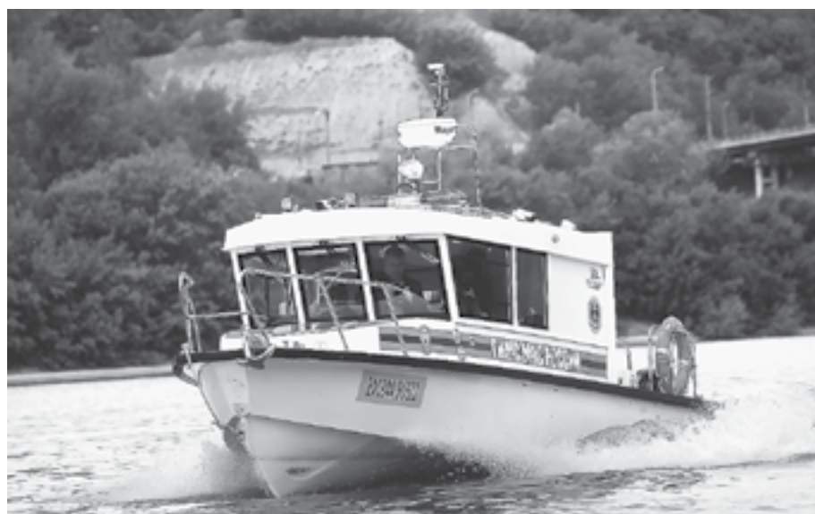
Сотрудники ГИМС идут в рейд.