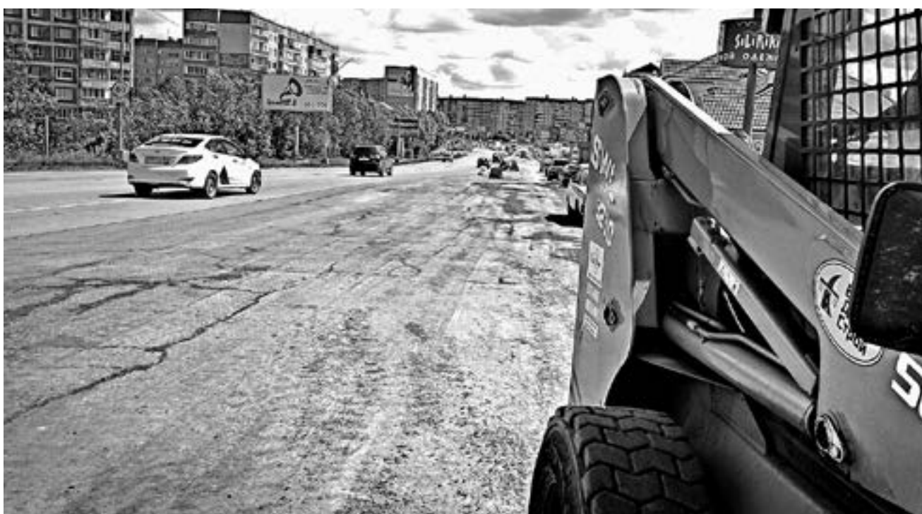
Движение по ул. Советской не останавливали.

На улицах Бийска несколько лет идут крупномасштабные ремонтные работы, в рамках которых отремонтировано уже более 30 важных участков. И все это благодаря национальному проекту «Безопасные и качественные дороги». Корреспондент «АП» прокатился по уже обновленным улицам и увидел, как идут работы на остальных.