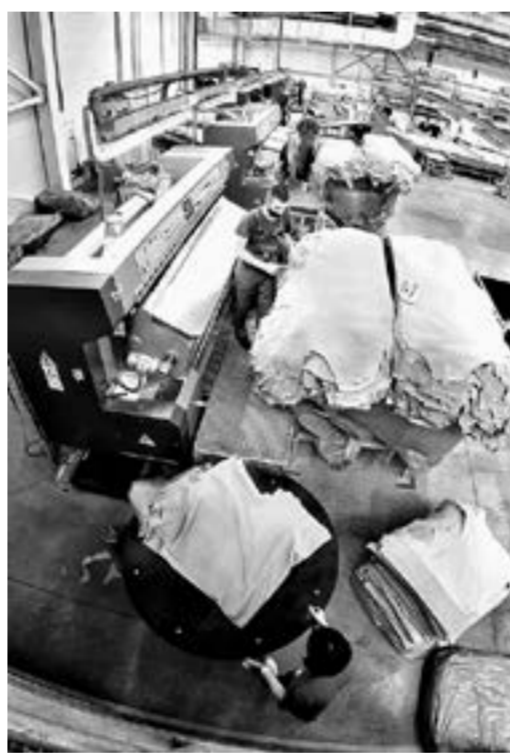
Кожевенный завод в Заринске получил налоговые льготы.

— В ходе седьмого созыва депутаты АКЗС приняли более восьмидесяти важных законопроектов, касающихся бюджета