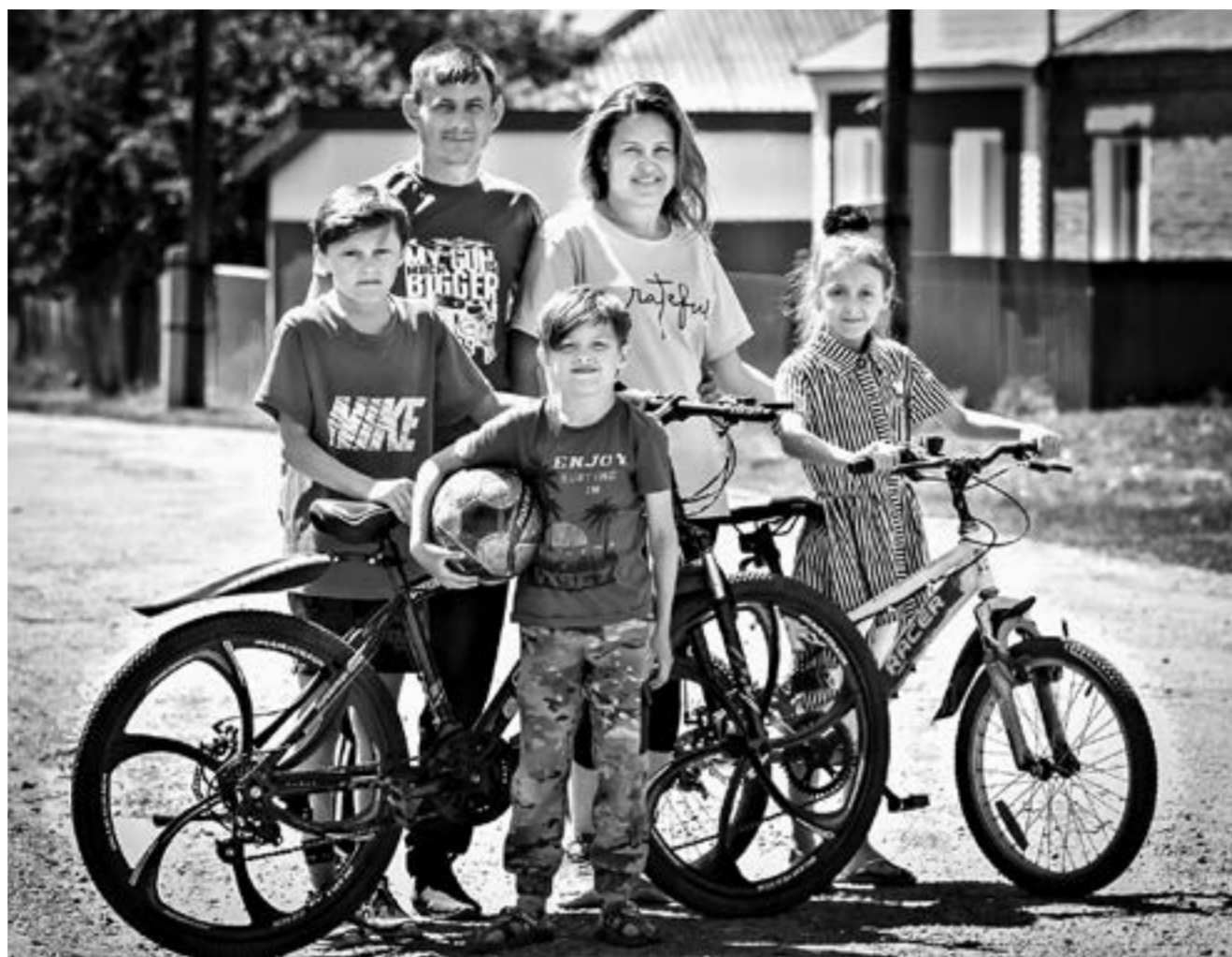
Семья в полном составе.

Люди с ограниченными возможностями здоровья много раз опровергали этот навешенный обществу ярлык, поднимаясь над собой, создавая семьи и рожая детей, совершенствуясь в любимом деле, делая мир лучше и ярче. Из этой породы — многодетная молодая семья Бракк из Ребрихинского района.