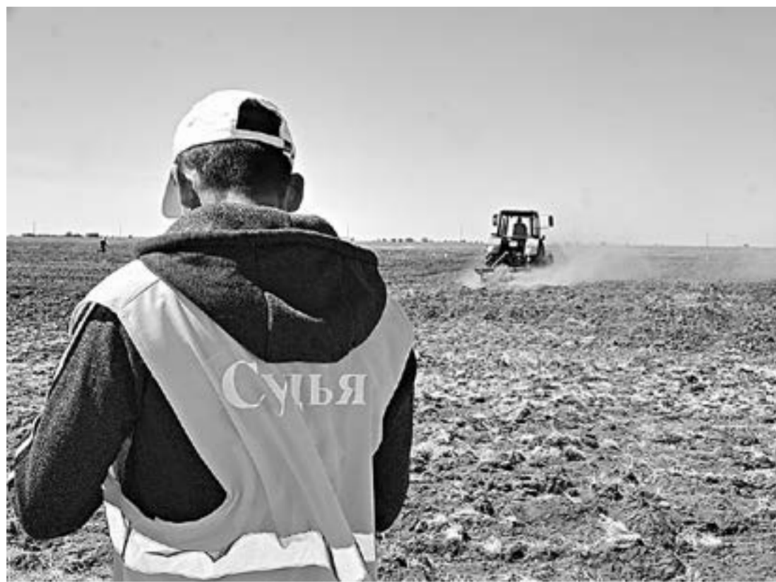
На краевой олимпиаде трактористов-машинистов в Благовещенке.

Ключевские аграрии ведут борьбу с сорняками на полях и... луговым мотыльком. Как пишет газета «Степной маяк», ссылаясь на оперативные данные райсельхозуправления, на 16 июня гербицидами против сорной растительности обработано 21 200 гектаров полей. Проклудировано 23 120 гектаров подсолнечника, боронование по всходам произведено на площади 35 600 гектаров. Кроме того, если в прошлом году сельхозпроизводители района начали борьбу с луговым мотыльком с июля, то в этот раз экономический порог безопасности этого вредителя полей в некоторых хозяйствах фиксируют прямо с начала лета. Гусеницы лугового мотылька особенно опасны для посевов кукуру-