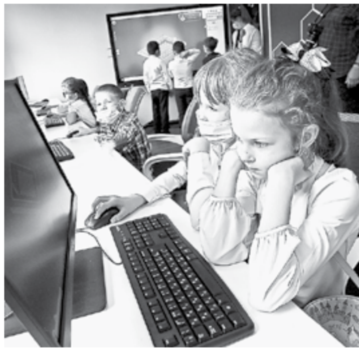
Встреча прошла на базе ИТ-куба неслучайно: здесь занимаются талантливые ребята.