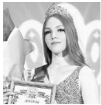
«Мисс АлтГУ – 2021».

Ирина КОТЕНКО