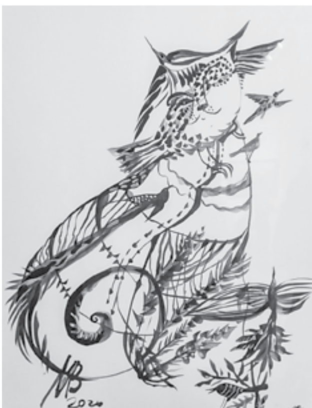
«Кот и птицы» (2020).

– Знаете, мне тут сказали, что я сложная, что стала нетерпимой. Но когда я стала экспозицию, поняла: я точно не злой человек! Работы хорошие, и я себе это доказала.