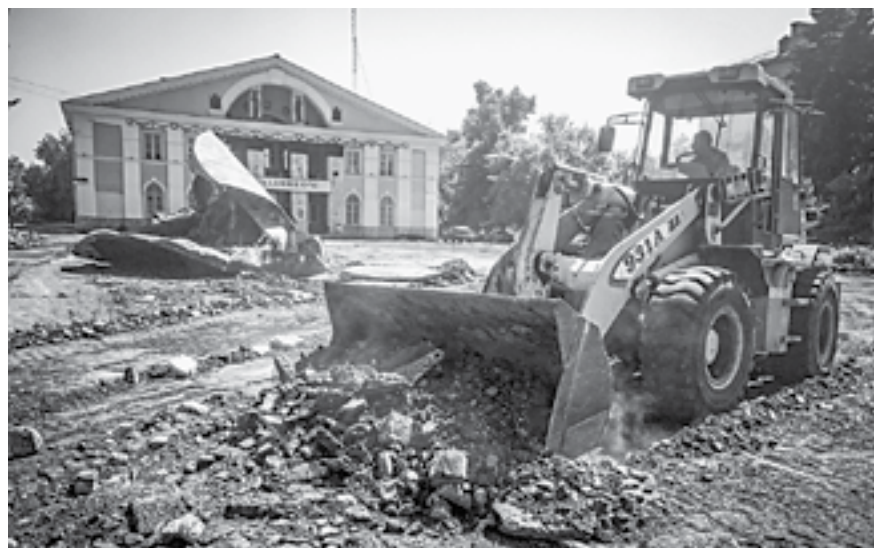
Старый асфальт заменяют на брусчатку.

– Мы хотим реконструировать не отдельный участок, а площадь целиком. На ней появится современный цветомузыкальный фонтан. Подрядчик сделает велосипедную дорожку, площадку для детей, будут установлены качели, карусели, новые скамейки. Старый асфальт заменим на брусчатку. После заверше-