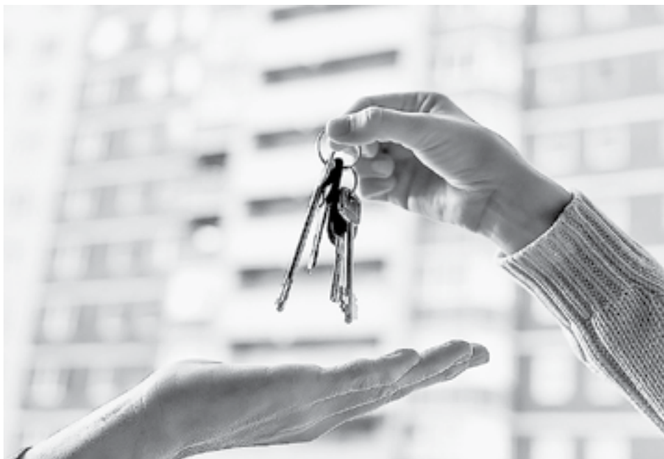
В Алтайском крае в очереди за жильем стоят более пяти тысяч сирот.

сертификаты по-прежнему можно будет на всей территории Алтайского края. Основные условия – приобретаемое жилье не аварийное и не меньше 33 квадратных метров. Сертификат будет действовать в течение одного года с момента его получения. Если сироты не успеют приобрести жилье в срок, то в следующем году могут снова подать заявление.