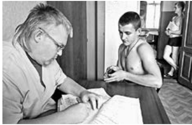
Солдат должен быть здоровым.

лаемого, то, естественно, идет туда, где требования проще.