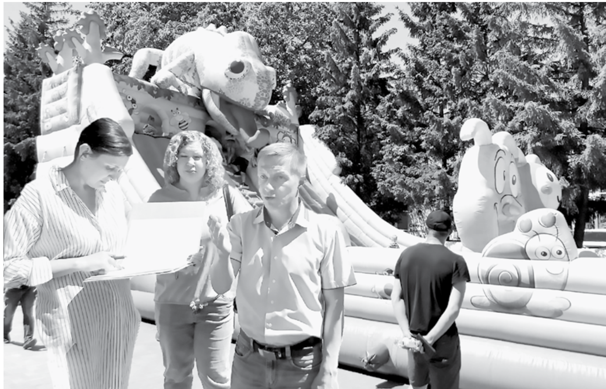
Коллаж Д. СТАРЦЕВА.