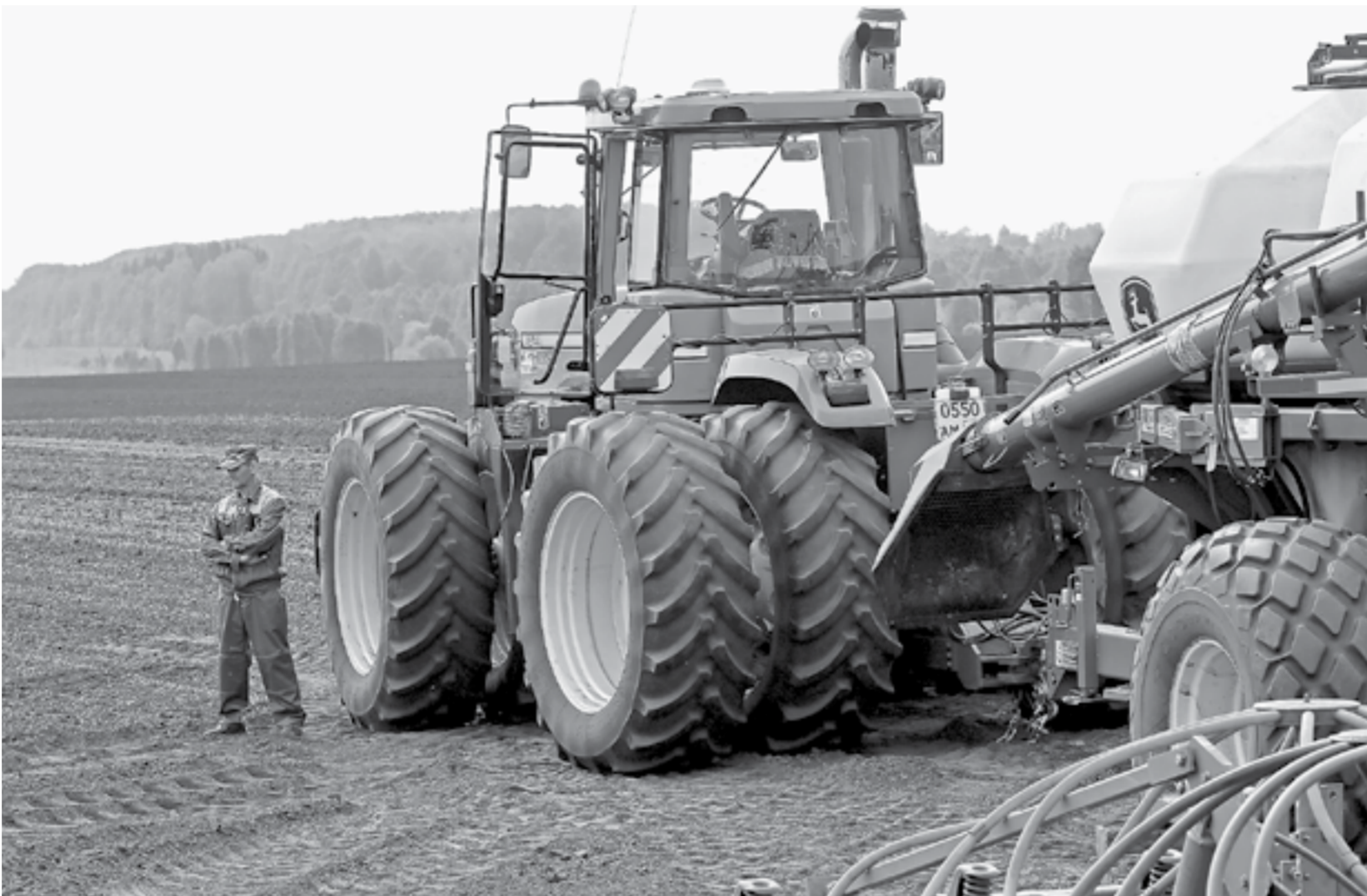
Мощная сельхозтехника позволила выполнить работы на высоком технологическом уровне.

Добавим, что в крае еще прошлой осенью посеяли на 39 тыс. га больше озимых. Теперь их клин составляет 255 тыс. га.