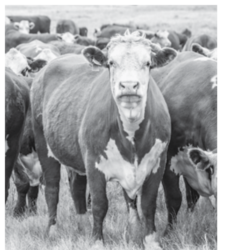
Подготовил Евгений ШУМИЛОВ

Дополнительно скажу, что с 1 сентября этого года вступают в силу новые ветеринарные правила, направленные на предотвращение распространения и ликвидацию очагов лейкоза крупного рогатого скота. Согласно этим правилам, если в хозяйстве суммарное количество больных и инфицированных восприимчивых животных составляет до 5% от общего количества восприимчивых животных, то инфицированные животные направляются на убой. Если более 5%, то инфицированных животных вывозят в резервацию или на убой. В резервации крупнорогатый скот содержится до окончания их хозяйственного использования, гематологические исследования таких животных проводятся каждые шесть месяцев».