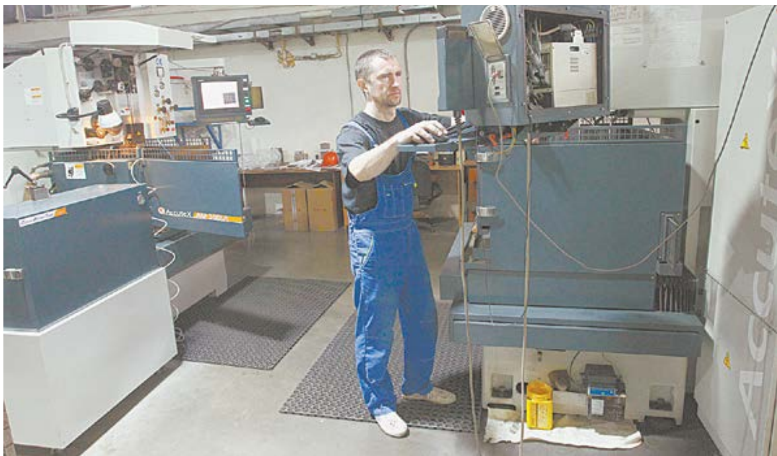
Создать высокотехнологичное рабочее место стоит дорого.

– Мы уверены: чем больше у алтайских предпринимателей