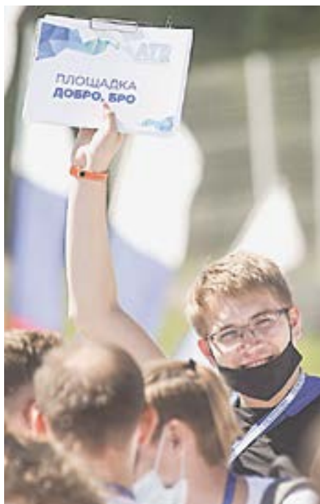
«Все на площадки!»