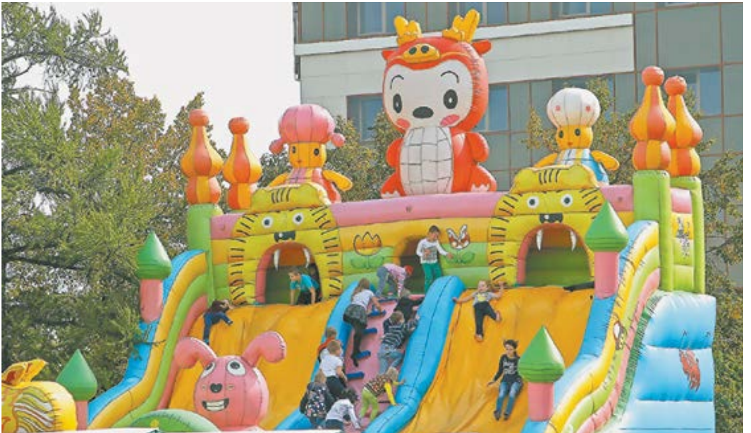
Прокуратура отменила внеплановые проверки батутов.