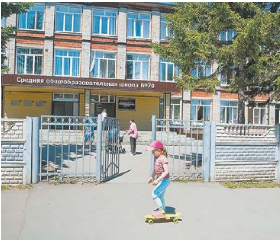
Обычная школа. Обычная жизнь.

ВРЗ – микрорайон с непростой судьбой. Хотя возможностей развития для детей здесь не меньше, чем в любом другом районе города. Рядом – ДК с детскими студиями, а сама школа № 70 – опорная площадка российского движения школьников, здесь работает один из лучших в крае поисковой отряд и еще множество подростковых объединений, в том числе волонтерское, с крепкими традициями.