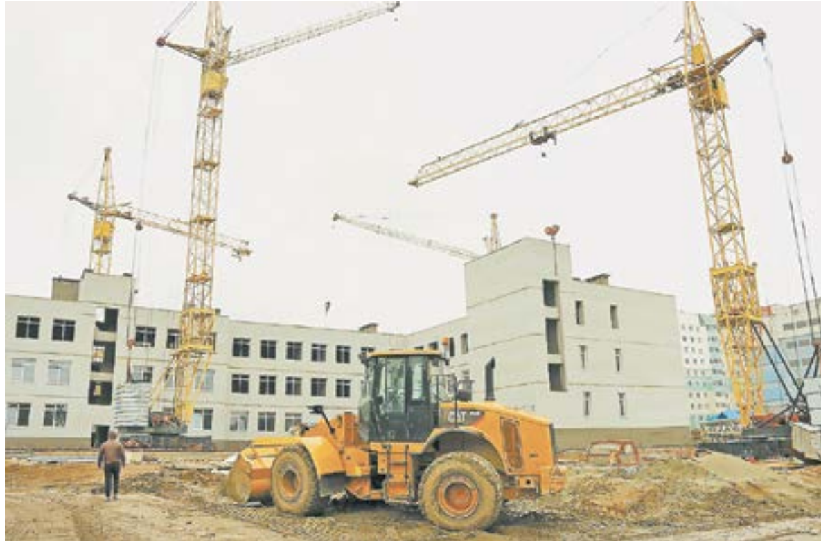
Убытки от строительства школы застройщик покрывает увеличением цен на жилье в соседних домах.