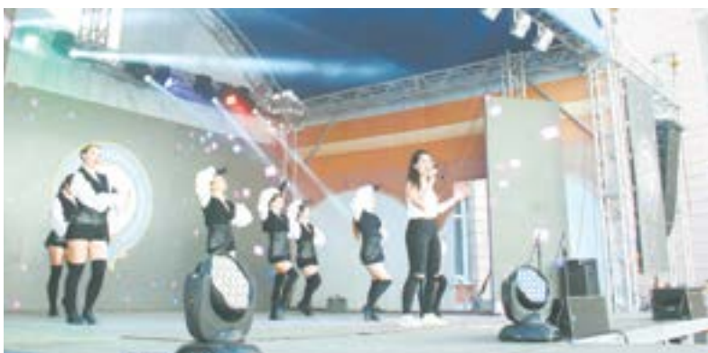
Красочный концерт «Планета Университет» для всех горожан по традиции завершил праздничную неделю.