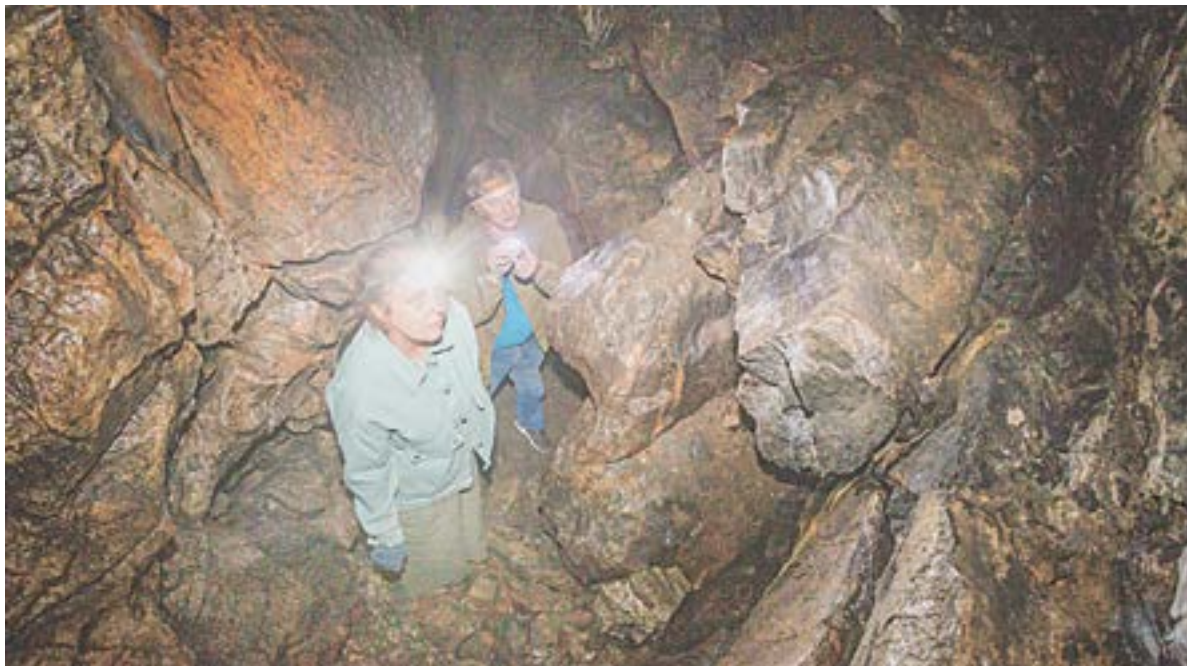
В пещере горы Большой Монастырь.

С наступлением лета в Краснощёковский район устремляются туристы со всей России. Гиды знакомят их с красотой и таинственностью здешних мест, хранящих следы пребывания древнего народа чуди и кочевников-скифов, Джунгарского ханства и казачьих форпостов, свободных рудознатцев и каторжников-рудокопов.