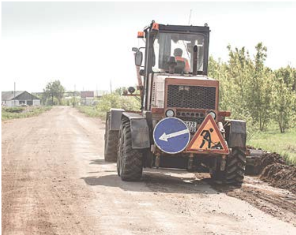
Подъезд к животноводческому комплексу посёлка Кировского.

Дорога к Кировскому животноводческому комплексу – грунтовая, грейдированная, вполне проезжая, но пока мы доехали до места, успели на этом коротком участке и пыли наглотаться, и протрястись.