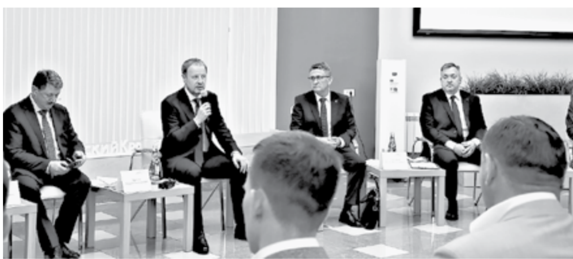
Виктор Томенко пообещал учесть пожелания предпринимателей при выработке властных решений.

На пленарное заседание VII Конгресса предпринимательских объединений региона губернатор Виктор Томенко выделил в своем плотном графике два часа. За отведенное время его участники успели почти скороговоркой озвучить свои предложения по совершенствованию делового климата в Алтайском крае. До этого они почти неделю подробно обсуждали в разных форматах все проблемы малого и среднего бизнеса (МСБ).