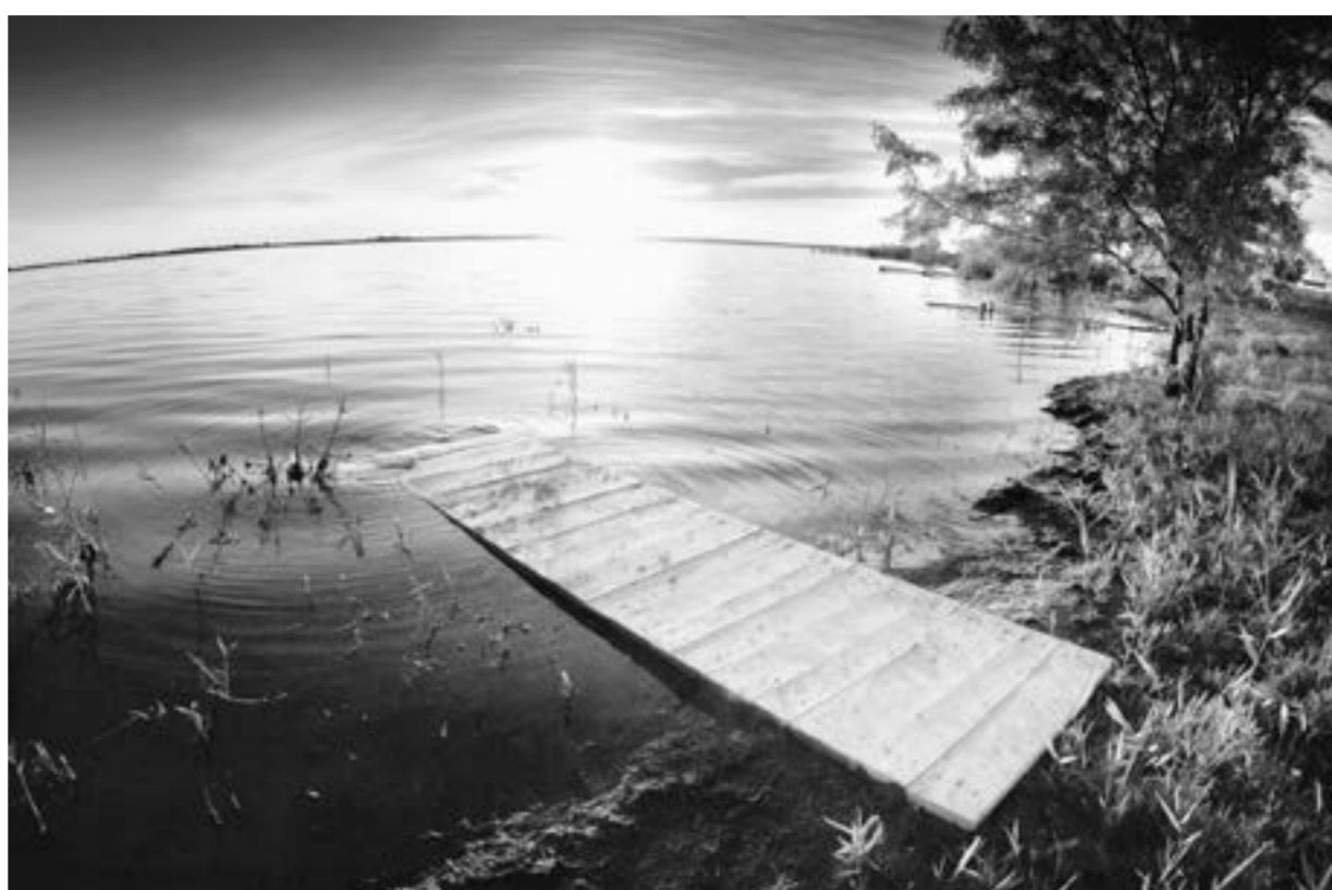
Озеро на закате.

Перед наплывом отдыхающих в домиках ведутся последние приготовления, но туристы уже понемногу