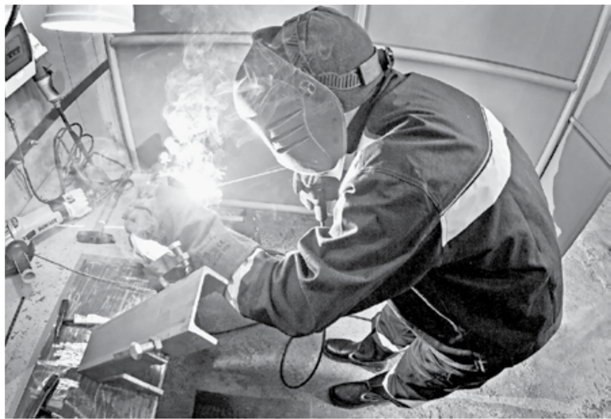
Пожелай мне удачи!