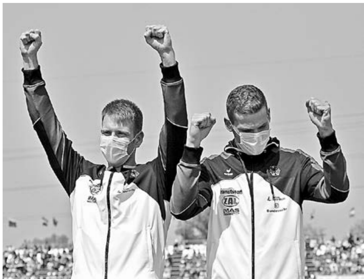
Победу празднует немецкий экипаж.