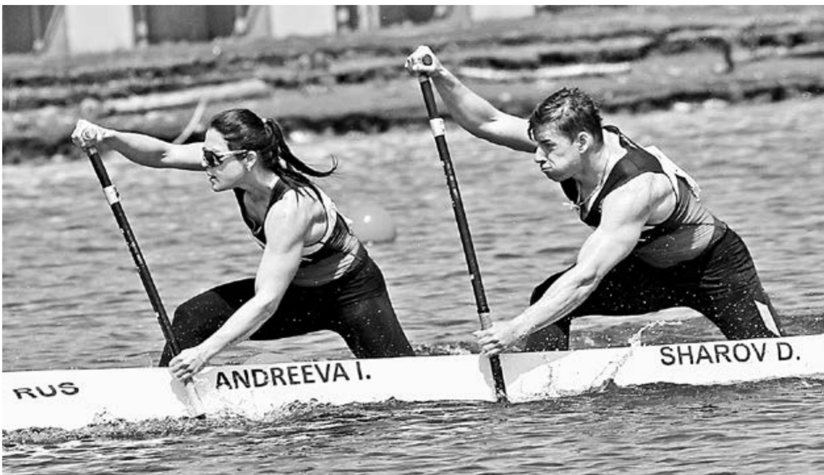
Когда женщина «рулит».

В Барнауле завершились самые статусные международные соревнования за всю историю края. Местные жители, побывавшие с 20 по 23 мая на гребном канале, наверняка испытали гордость за свой регион. Да и как тут не гордиться – спортсмены из почти шести десятков стран, среди которых были олимпийские чемпионы, разыграли у нас медали второго этапа Кубка мира по гребле на байдарках и каноэ.