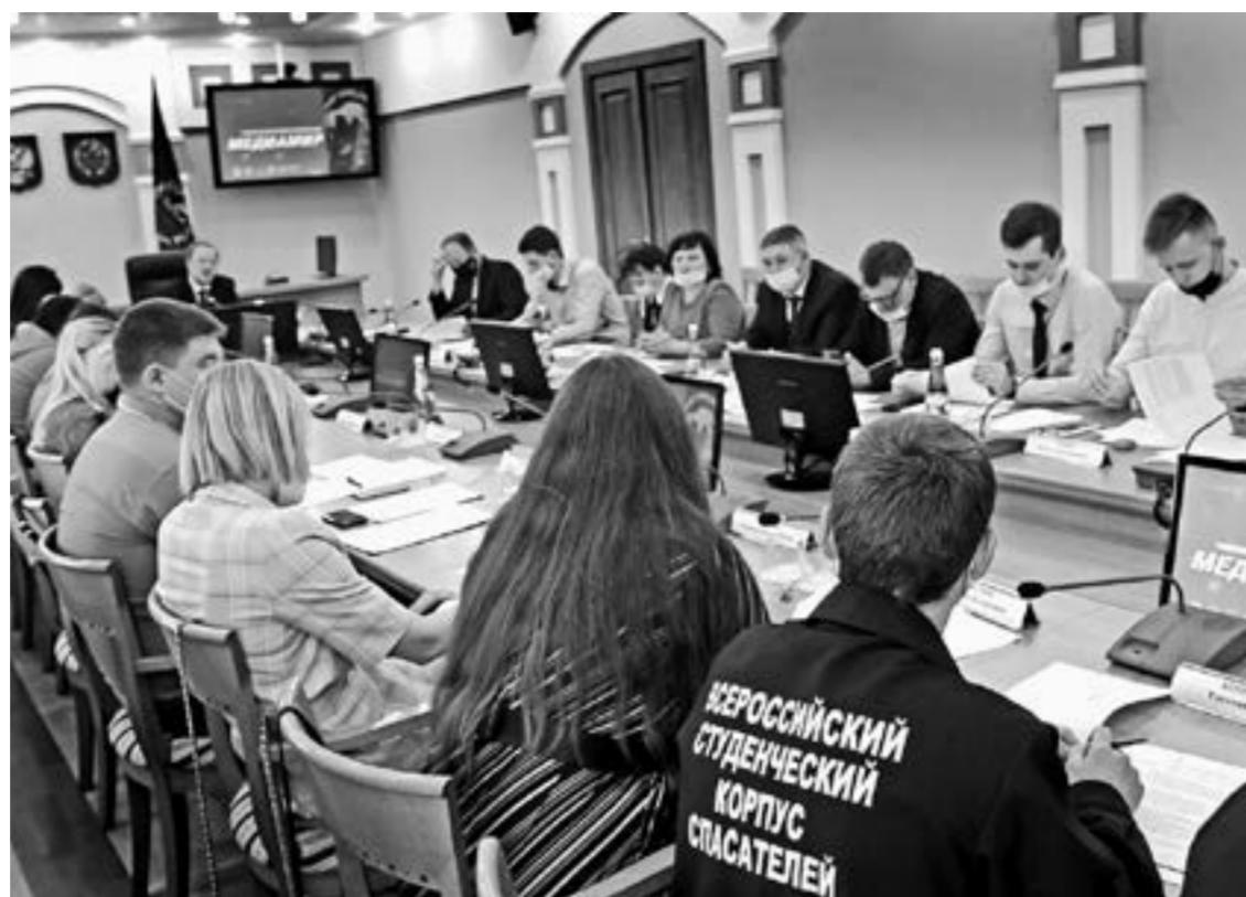
Во время заседания.

— Региональный штаб акции был открыт в марте прошлого года на базе Алтайского центра развития добровольчества. Волонтеры доставили пожилым людям свыше 30 тысяч бесплатных продуктовых наборов. Осенью в период роста заболеваемо-