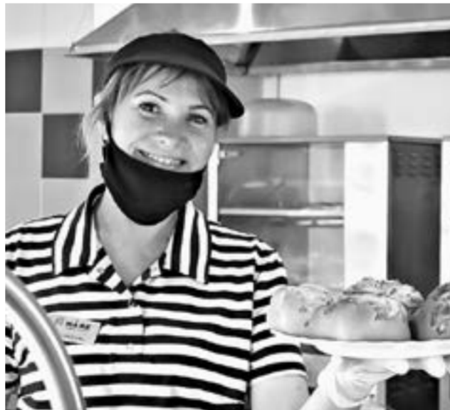
В кафе придорожного сервиса «Маяк» всегда рады гостям.