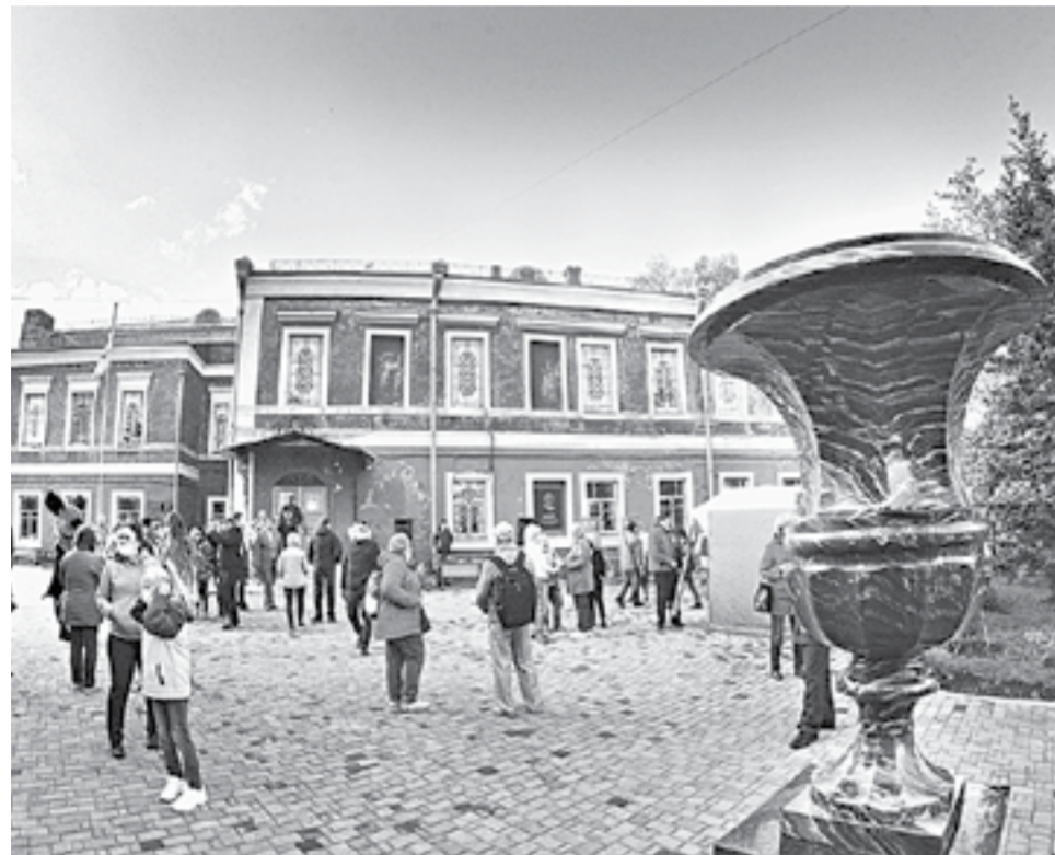
Во дворе ГМИЛИКА.