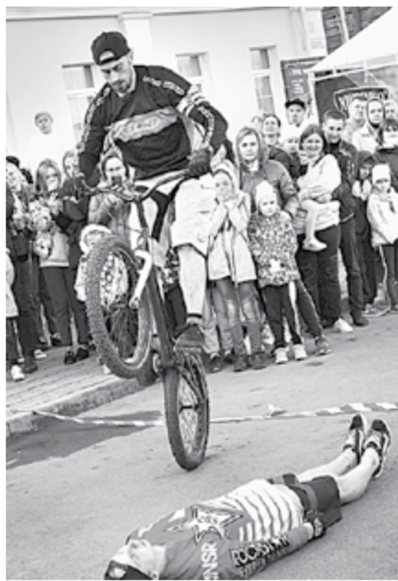
Завхватывающие аттракционы у «Горной аптеки».