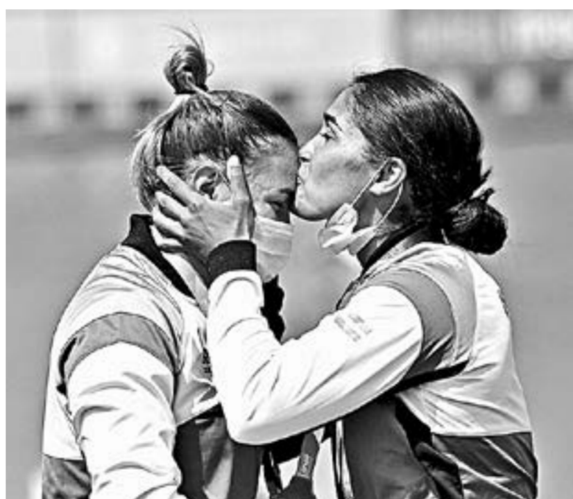
Благодарность за награду.

ло большой мотивацией для дальнейших занятий спортом.