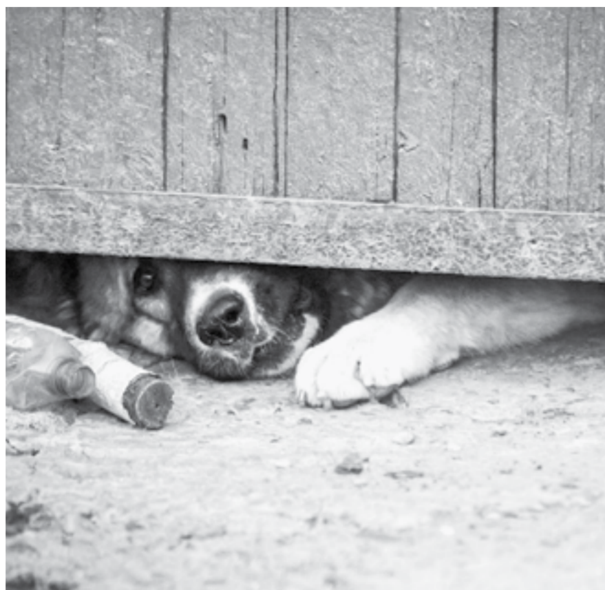
Счастье за забором.

За отлов животных отвечают органы местного самоуправления, им выделены для этого средства из краевого бюджета. Администрация города Барнаула заключила договор с городской общественной организацией «Ласка». Если жители считают, что животные безнадзорны и угрожают их спокойствию, они должны обратиться с заявлением об отлове бродячих собак в администрацию города или напрямую в «Ласку». Специалисты «Ласки» выезжают, отлавливают,