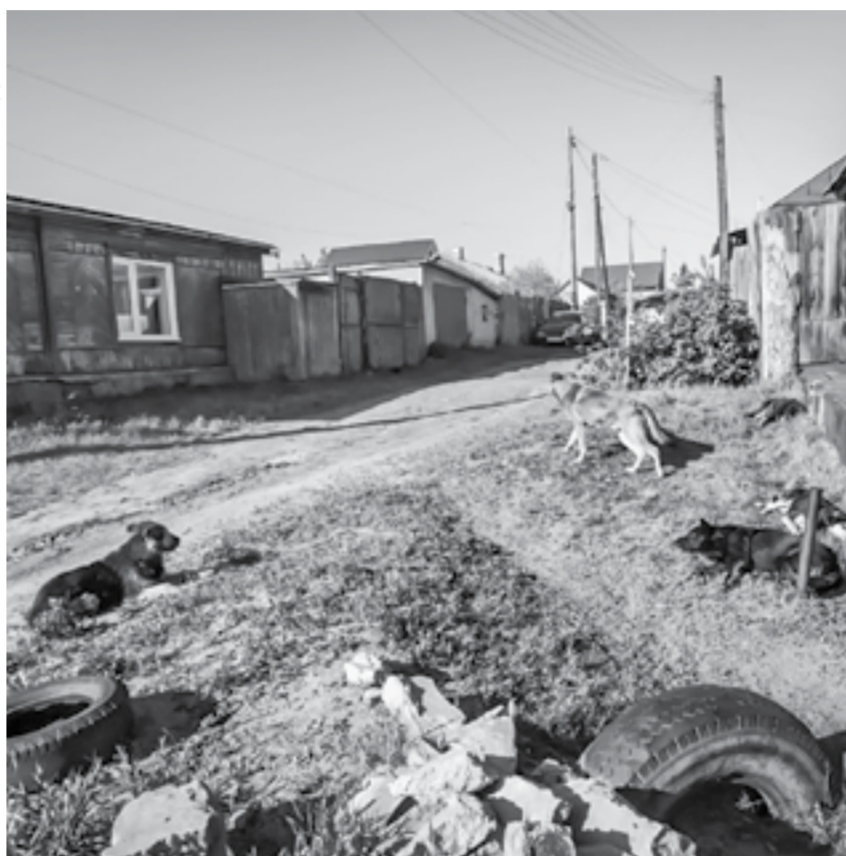
Стая всегда начеку.