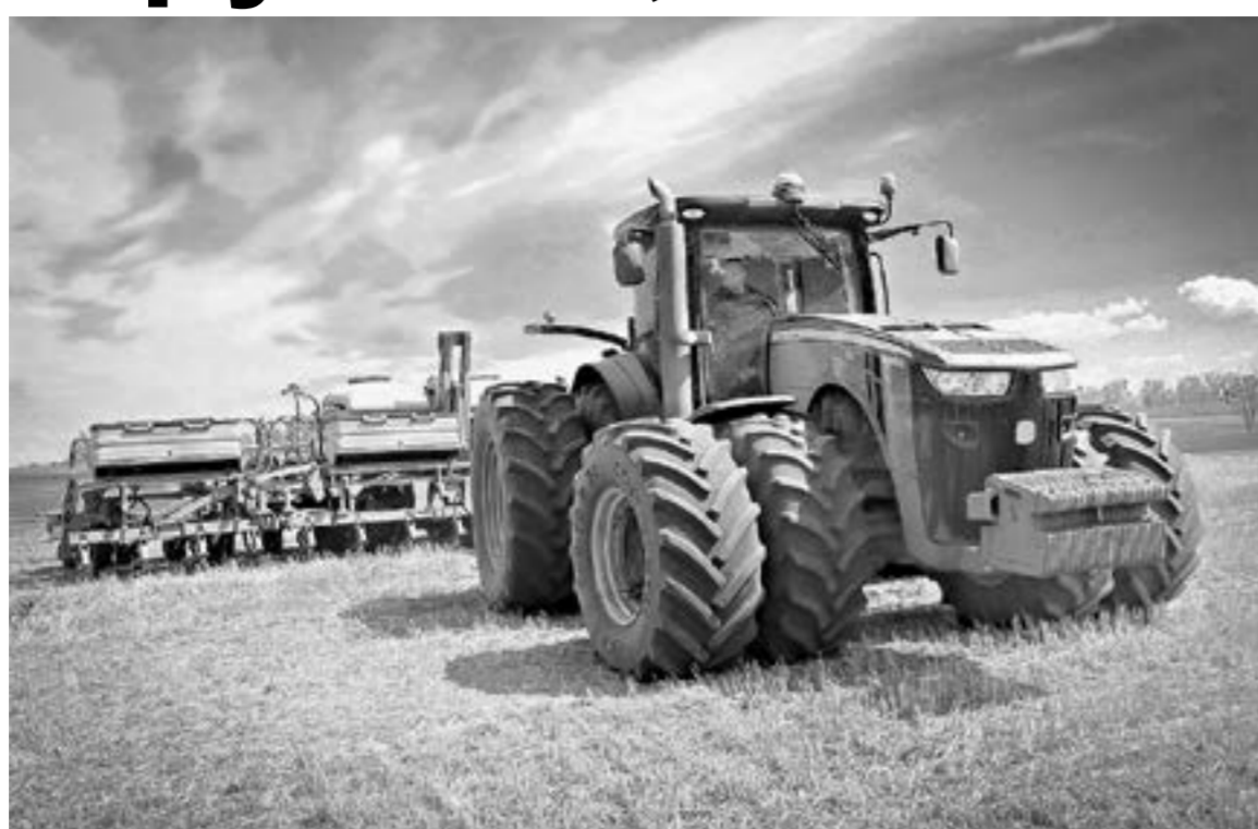
На посевах подсолнечника задействованы трактор и сеялка «Джон Дир».