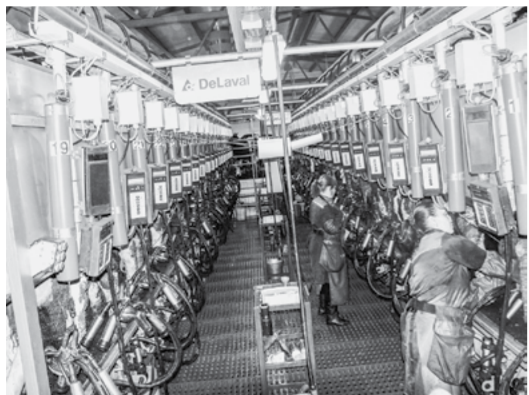
Дойна по-современному: в новом зале «Европараллель 2х18».