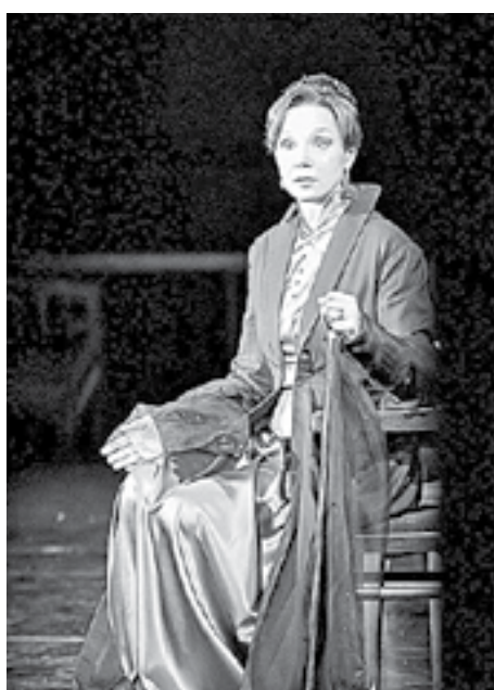
Ирина Купченко в «Евгении Онегине».