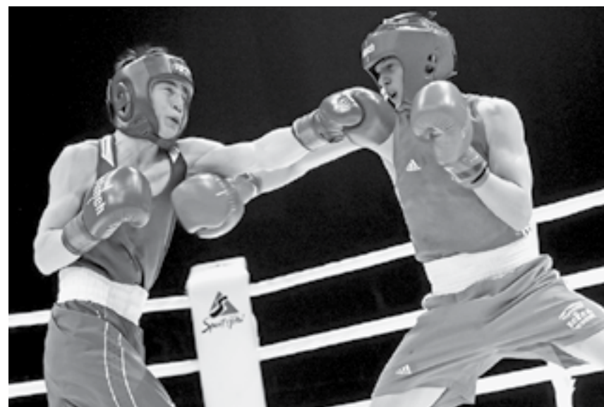
Барнаульские зрители увидели высококлассные поединки.

Как и ожидалось, первое общекомандное место заняла юниорская сборная Москвы. Столичные боксеры завоевали две золотые, две сере-