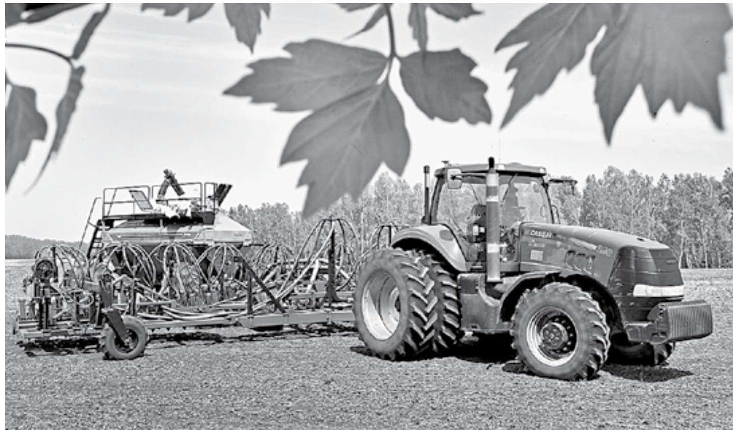
Оборудованный навигатором «Нейс» сеет точнее.