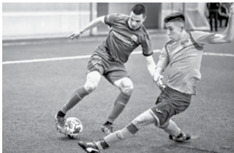
«Темп» в матче против «Строителя».