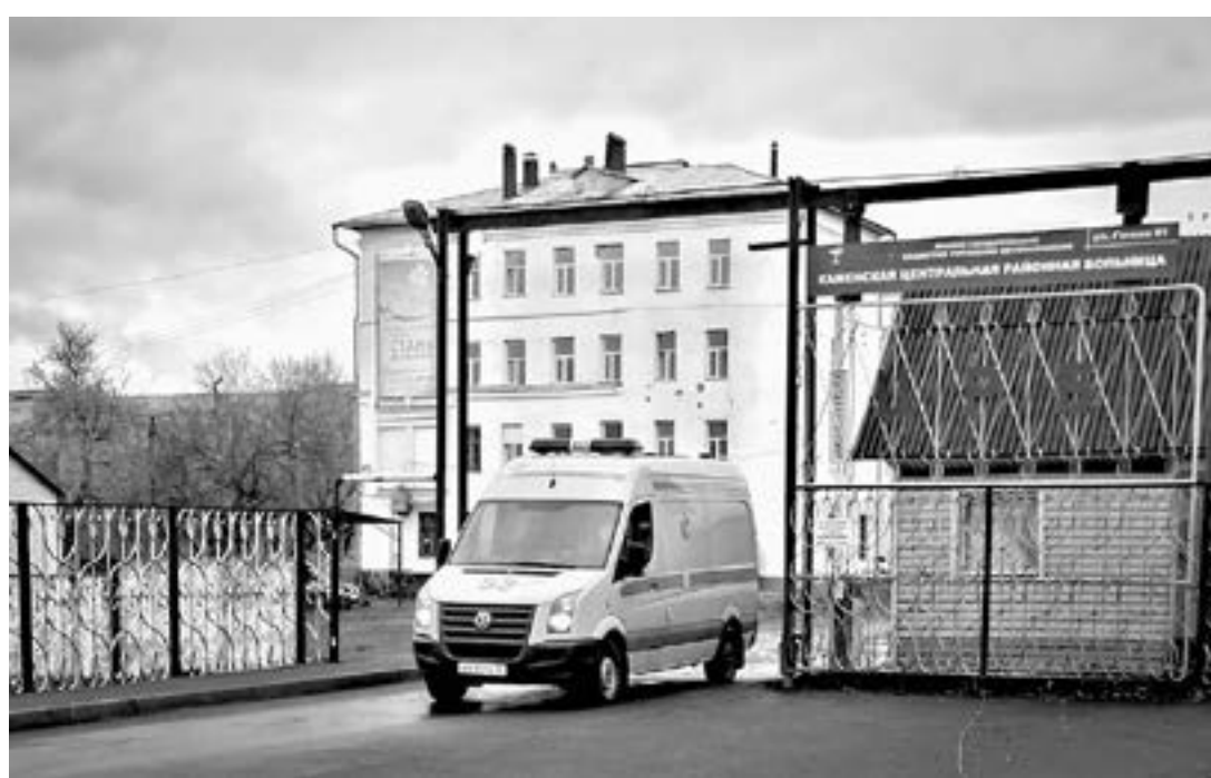
В Каменской ЦРБ большие перемены.

– К сожалению, полностью ковид победить пока не удалось, да и вряд ли теперь удастся: этот вирус пришел в нашу жизнь и надо учиться ему противостоять, в первую очередь путем вакцинации. Я сам прошлым летом очень тяжело перенес это заболевание, с серьезным поражением легких, в какой-то момент, честно, попрощался с жизнью. Тогда толком еще не знали, как и чем лечить. Сегодня уже есть отработанная схема, а главное, препараты. Но и они не всегда и не всем помогают, многое зависит от индивидуального состояния больного. Были случаи гибели шедших на поправку пациентов. Молодой мужчина готовился к выписке, встал и умер от тромбоза. Вирус очень коварен. Я ни за что не хочу еще раз пережить то, что пережил, и другим надеяться на авось не советую. Как только титры антител к коронавирусу, выработанные во