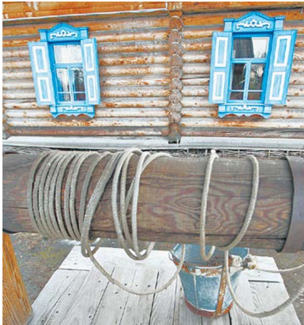
Местный бюджет – это колодец, а не бездонная бочка.

«У нас масса текущих вопросов, для решения которых не требуется вложения грандиозных средств», – объясняет муниципальный чиновник. – Это затраты на текущее содержание школ, детских садов и других социальных объектов, ремонт теплового комплекса, муниципальных дорог, водоснабжения, благоустройство тер-