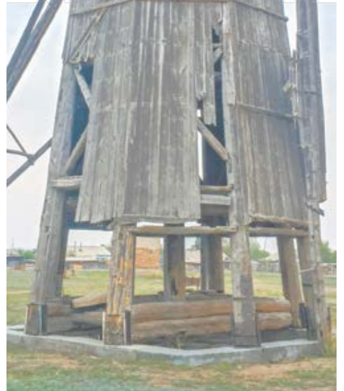
Мельница не работала с 70-х годов.

залито бетоном, поэтому нельзя точно сказать, насколько оно было высоким изначально. Сейчас высота мельницы составляет около 15 метров. Муку не мелют уже почти полвека, но она благодаря равнодушным людям всё еще твердо стоит на земле, а внутри даже сохранились деревянные механизмы и каменные жернова.