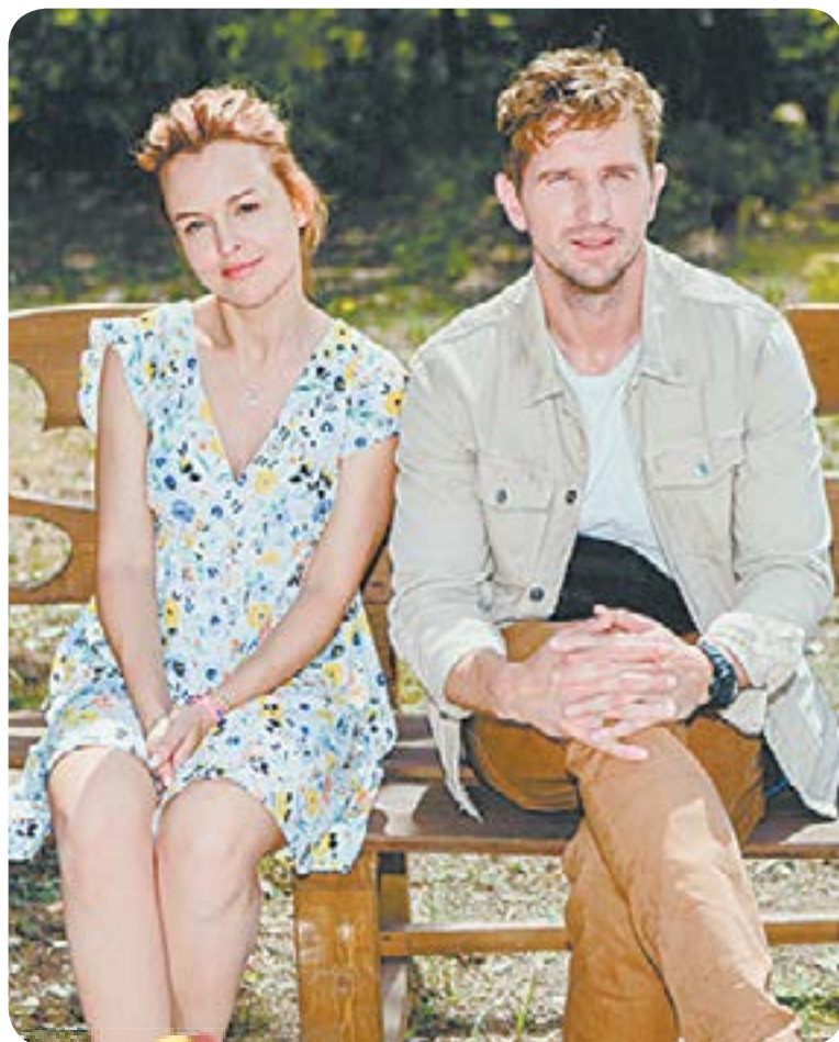
19.00 Х.ф. «Полюби меня такой» (16+)

04.50 Т/с «Лесник» (16+) 06.30 Утро. Самое лучшее (16+) 08.00 Сегодня 08.25 Т/с «Морские дьяволы. Смерч» (16+) 10.00 Сегодня 10.25 Т/с «Морские дьяволы. Смерч» (16+) 13.00 Сегодня 13.25 Чрезвычайное происшествие 14.00 Место встречи (16+) 16.00 Сегодня 16.25 ДНК (16+) 18.35 Т/с «Ментовские войны» (16+) 19.00 Сегодня