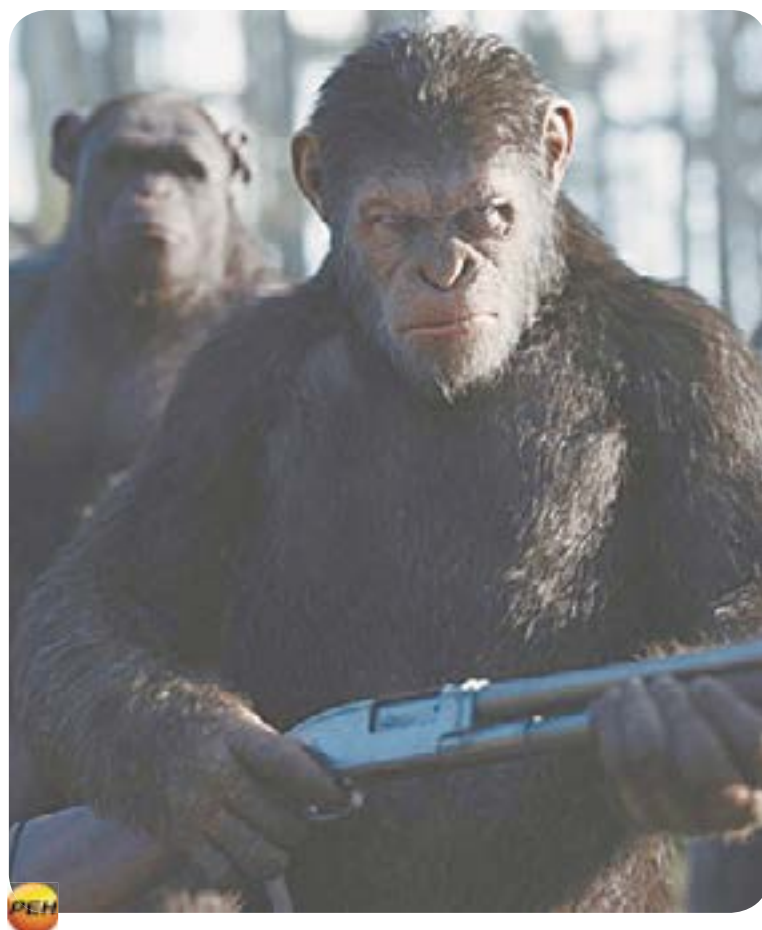
РОССИЯ 1 18.15 Х.ф. «Восстание планеты обезьян» (16+)

06.05 М/с «Фиксики» (0+) 06.15 М/с «Том и Джерри» (0+) 07.00 М/с «Три кота» (0+) 07.30 М/с «Царевны» (0+) 07.55 Шоу «Уральских пельменей» (16+) 09.00 Премьера. Рогов в деле (16+) 10.00 М.ф. «Шрек» (6+) 11.45 М.ф. «Шрек-2» (6+) 13.25 М.ф. «Шрек Третий» (6+) 15.10 М.ф. «Шрек навсегда» (12+) 16.55 М.ф. «Семейка Крудс» (6+) 18.45 Х.ф. «Отряд самоубийц» (16+) 21.05 Х.ф. Премьера. «Джокер» (16+) 23.40 Премьера. Стендап Андеграунд (18+) 00.40 Х.ф. «Оно» (18+) 03.00 Х.ф. «Дневник памяти» (16+) 04.55 «6 кадров» (16+) 05.50 Ералаш (0+)