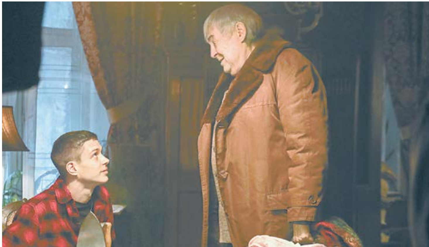
Вампирам разных поколений тоже непросто найти общий язык.