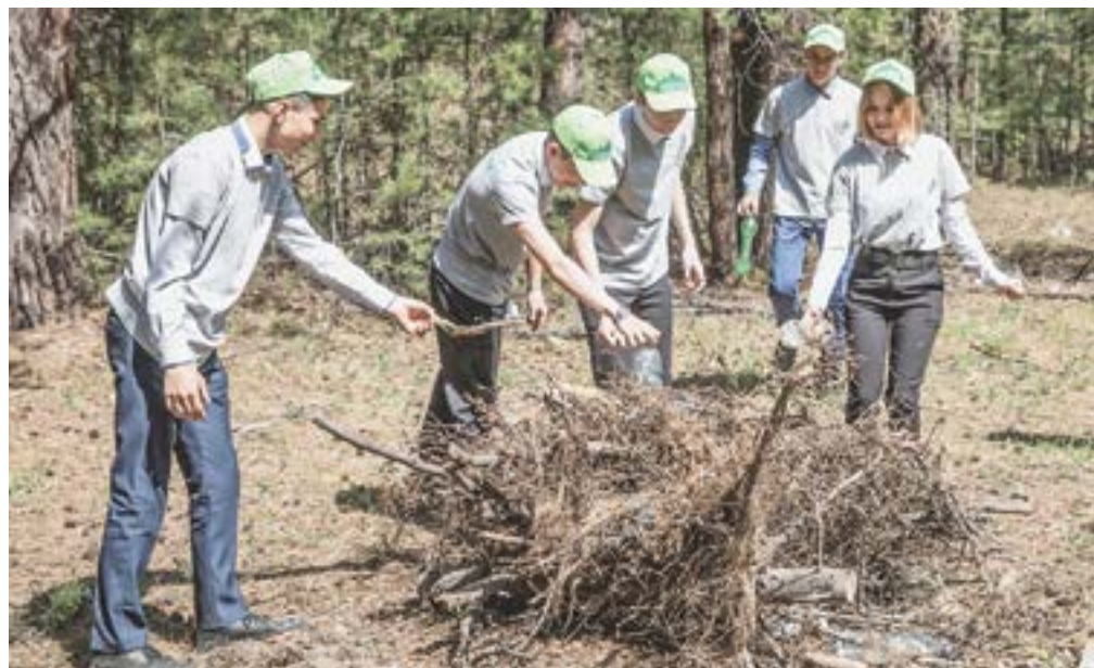
Еще одна поляна очищена.