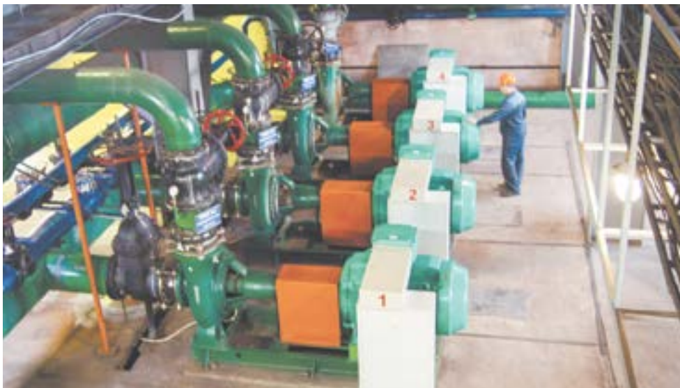
«Теплоцентрально Белокуриха» выдает 56 Гкал/час.

гически важно удачное расположение котельных АО «Теплоцентрально Белокуриха» вдали от основного городского населения, санаториев и лечебниц Белокурихи, в соответствии с розой ветров, что немаловажно для сохранения окружаю-