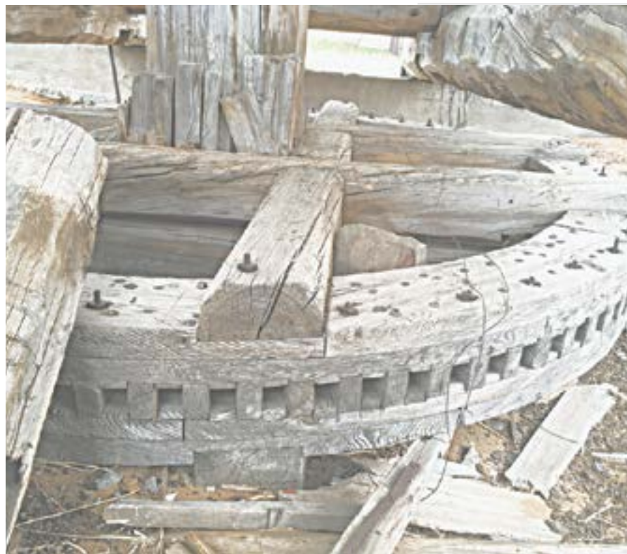
Некоторые механизмы еще внутри.

Сегодня нижняя часть строения полуразрушена, а основание