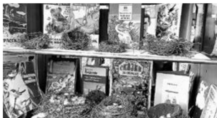
Более 200 тематических книг хранится в запасниках музея.