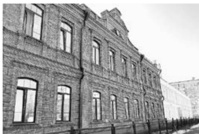
Школе № 4 — 112 лет, 10 лет из которых носит имя писателя.