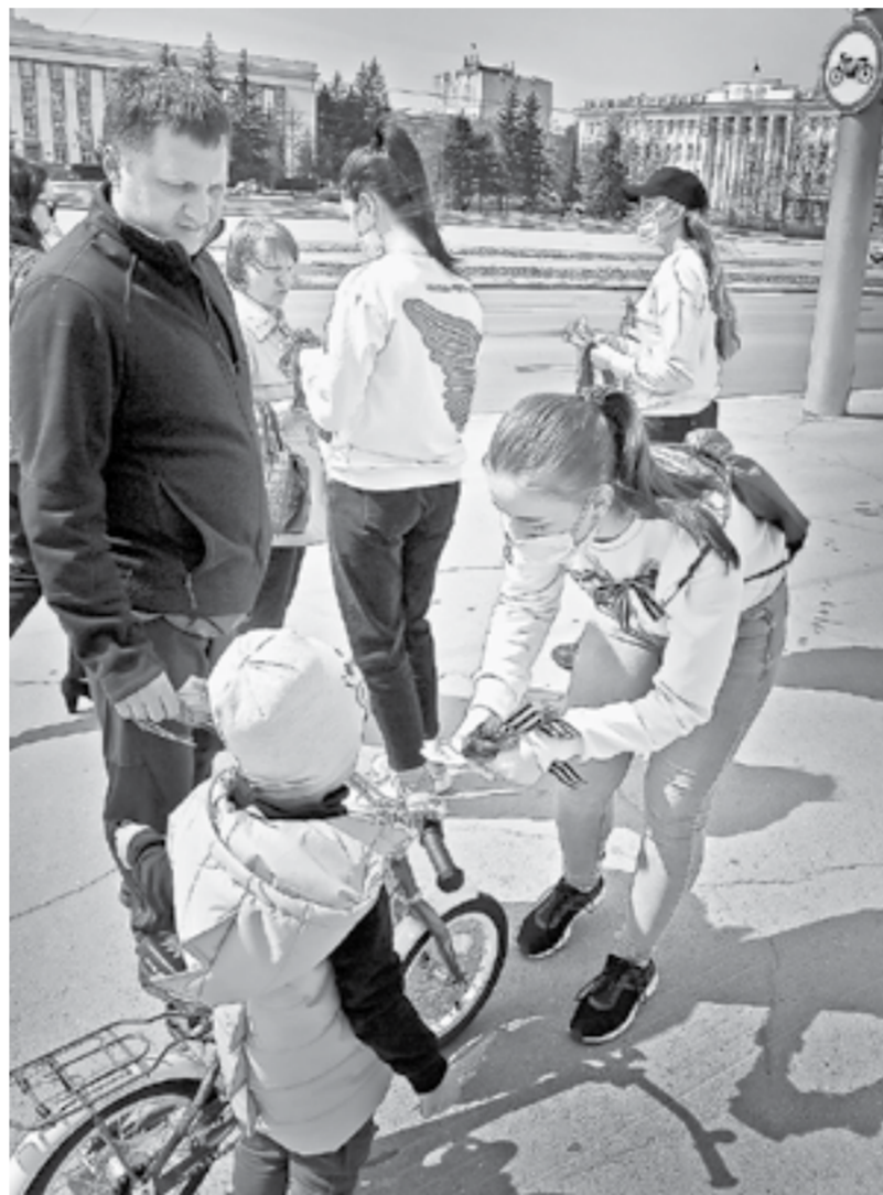
Люди рады такой традиции.

Накануне 9 Мая жителям края вручают георгиевские ленточки. Только в Барнауле их получат более пяти тысяч человек.