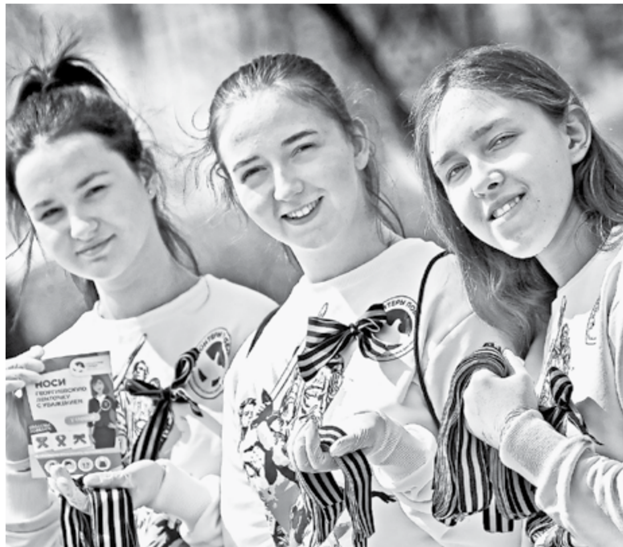
В эти дни волонтеры раздают ленты на улицах города.