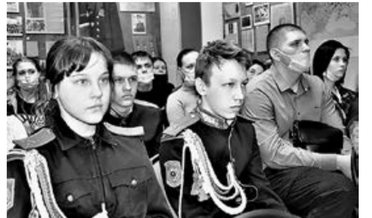
На торжественной церемонии присутствовало много молодежи.