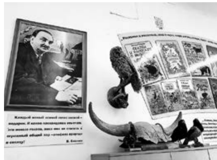
Творчество Виталия Бианки здесь любят.

Старейшей школе Бийска № 4 уже 112 лет. А на днях исполнилось 10 лет, как она носит имя Виталия Бианки. Корреспондент «АП» побывал в гостях у педагогов и учеников школы и узнал, как там берегут и приумножают наследие знаменитого детского писателя-натуралиста.