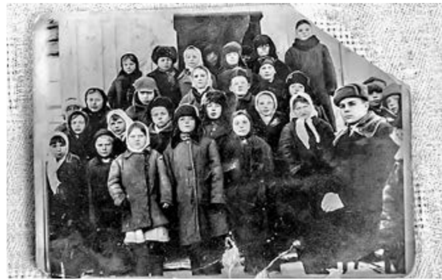
С любимыми учениками.