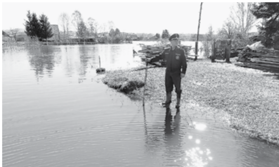
По данным на 5 мая, паводковую обстановку в крае оценивают как некритичную.

В барнаульском микрорайоне Затон из-за подъема уровня воды ограничили движение по дороге в сторону острова Шубинского. На момент подготовки номера здесь было 482 см, за сутки прибавилось 39 см. Критическая отметка – 540 см.