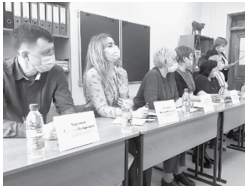
Жюри конкурса педантично оценивало участников.