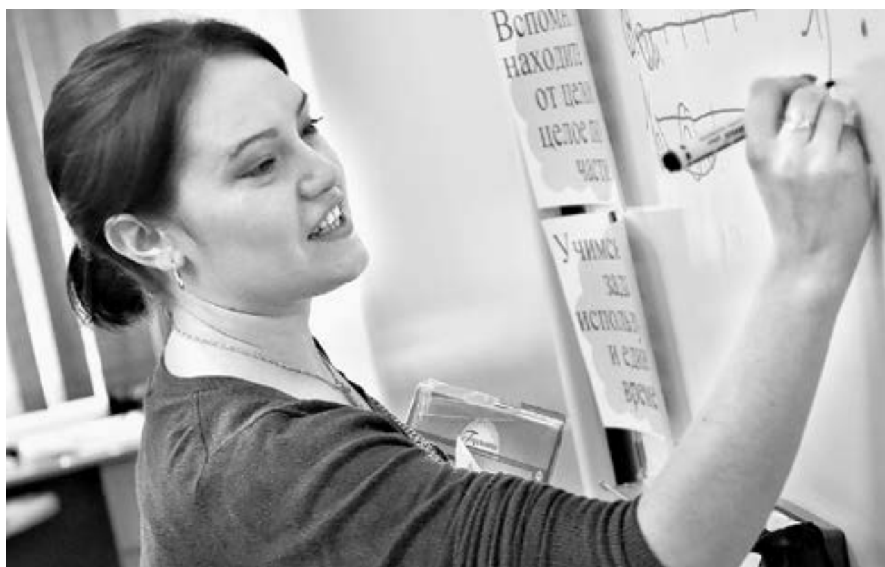
Алтайские педагоги получат доступ к бесплатной юридической помощи.

Как сказано в пояснительной записке к законопроекту, основной и содержательный объем этой работы в Алтайском крае закреплен за адвокатами и Многофункциональным центром предоставления государственных и муниципальных услуг Алтайского края. В прошлом году специалисты МФЦ оказали бесплатную юридическую помощь по 264 обращениям. Более 700 жителей края обратились за помощью к адвокатам, а в 116 случаях бесплатные защитники представляли их интересы в судах и других инстанциях.