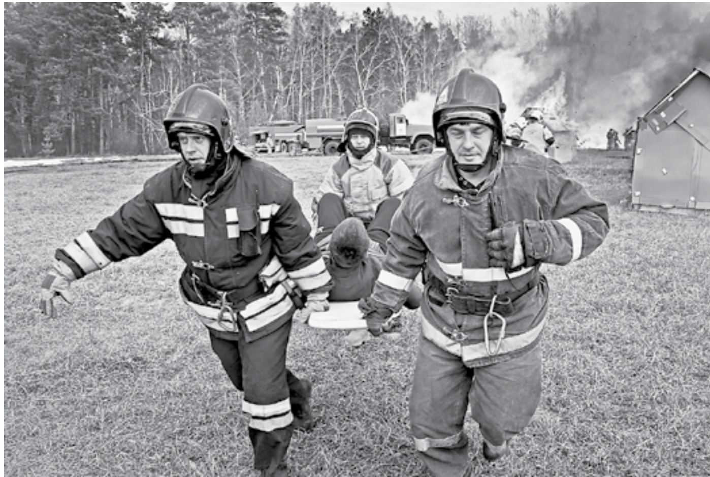
Экстренная эвакуация из горящего дома.