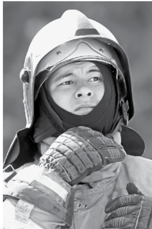
В полной боевой экипировке.