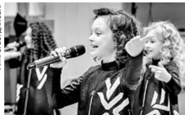
Титовцев поздравили юные певцы из студии «Шоколад».