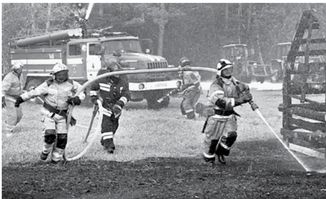
Вот подали рукав.