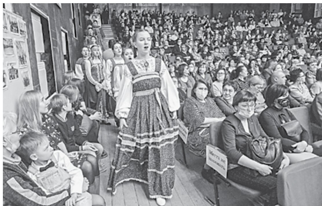
Этот огромный зал не реконструировался с момента постройки в 1986 году.

Алтайский государственный музыкальный колледж отметил 65-летие большим концертом с участием студентов всех направлений подготовки.