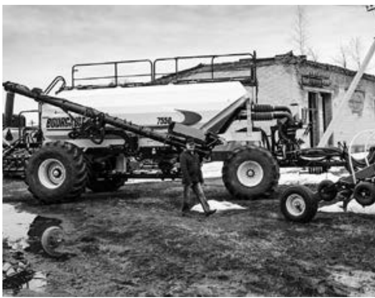
Техника готова на 75%.

Прошлый год для «Житницы Алтая» сложился неплохо, предприятие сработало в плюс. «Все посейное собрали, заложили урожай в элеватор. Сейчас продолжают отгружать льна в Китай, весь его мы реализуем именно в Поднебесной», – отмечает Пробст. Засуха, которая прошлым летом доставила некоторым аграриям немало проблем, на предприятие из Панкрушихинского района почти не повлияла. Все посевы, что в прошлом году посев производился