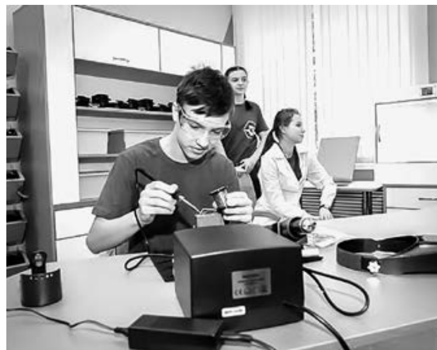
Инженерно-технологический центр в школе № 53.

Работы прошли на 44 объектах местного значения. Общая их протяженность – 43 км. Из бюджетов всех уровней потрачено 1,2 млрд рублей. Также реализовывалась индивидуальная программа социально-экономического развития края на 2020–2024 годы. Сюда