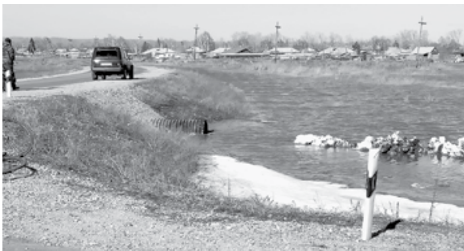
Разлившаяся вода добавила хлопот жителям села Советский Путь.

— В 2019 году по разработанному проекту построили новый объект. Он включил в себя вместо двух мостов с пропускной площадью 15 кв. м одну трубу 8 кв. м, которая при этом оказалась выше нижнего уровня старых мостов, — рассказал Константин Московкин. — Было поднято дорожное полотно, создана искусственная дамба, которая в этом году направила поток воды на село. Резервная труба, установленная за объездной дорогой, оказалась выше, чем