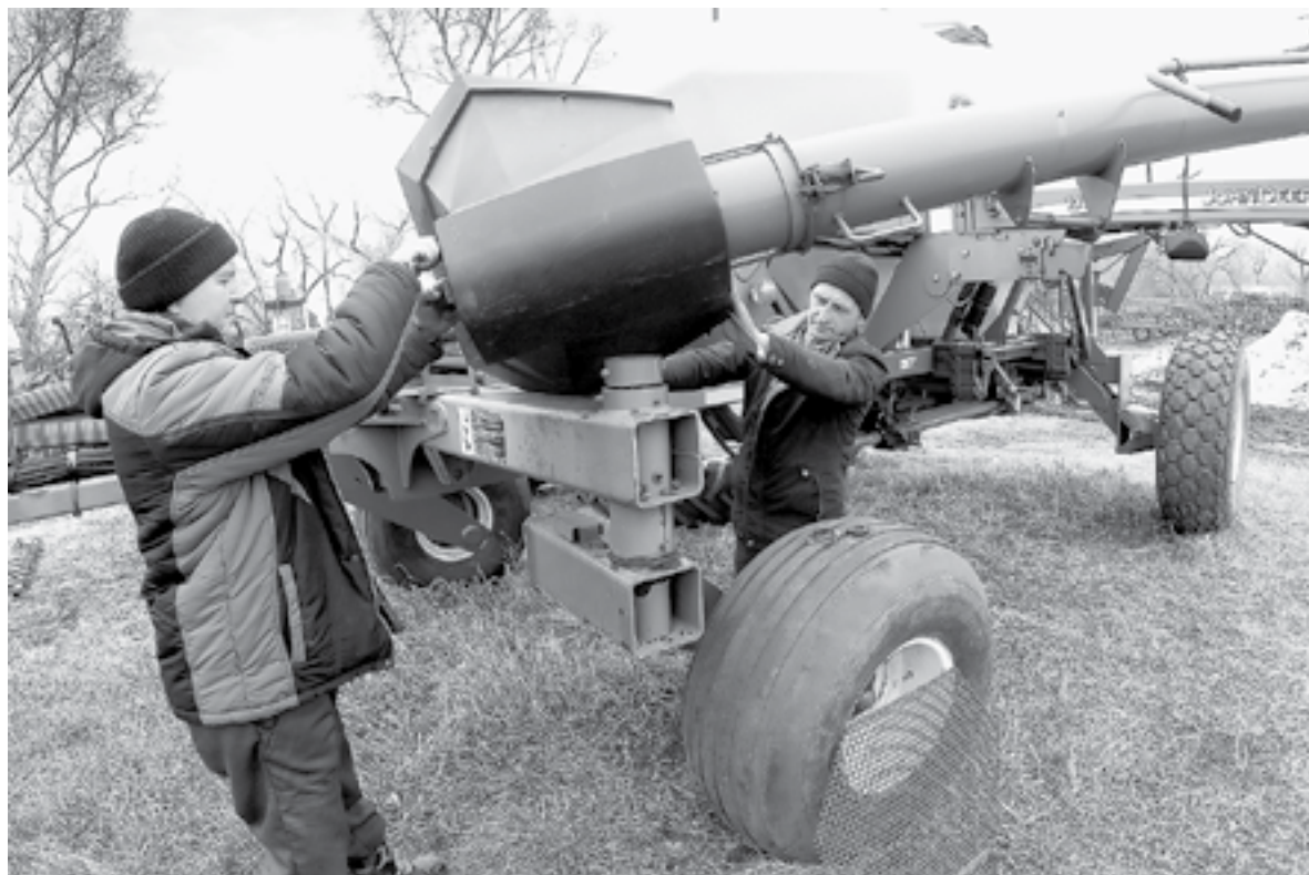
Хозяйство выходит в поле одним из последних в крае.

Аграрии Алтайского края уже приступили к весеннему боронованию, а вот на севере региона техника выйдет в поля только к началу мая. Такой разброс вызывает у фермеров некоторые трудности, но не мешает добиться высоких результатов.