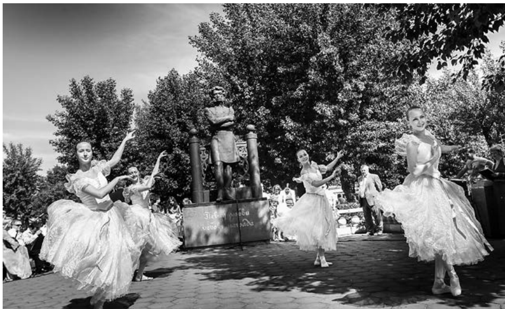
Сквер Пушкина, где проходит много культурных мероприятий – один из возможных объектов благоустройства.

С 2018 года у самих горожан появилась возможность выступить экспертами, настоящими знатоками городской среды. Все просто: общественные объединения, ТОСы, инициативные группы предлагают городской администрации объекты, которые необходимо привести