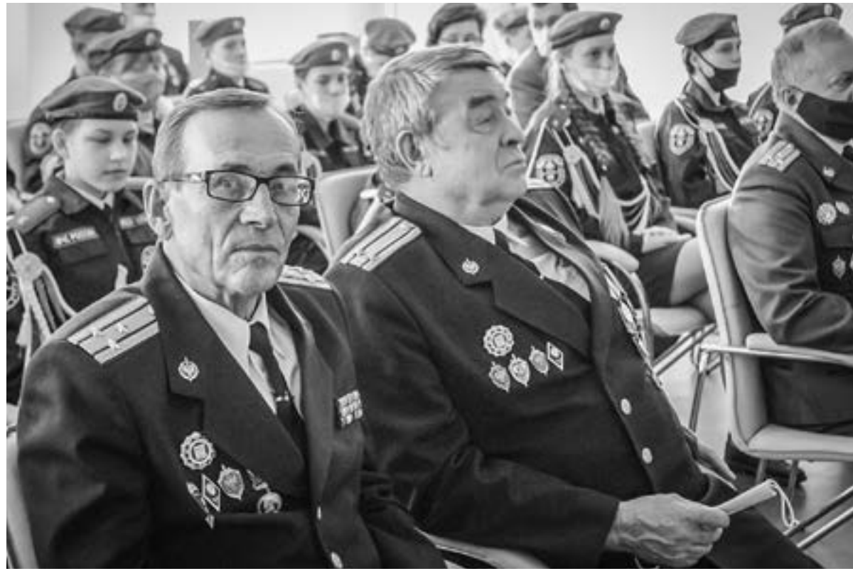
На презентации было интересно всем.