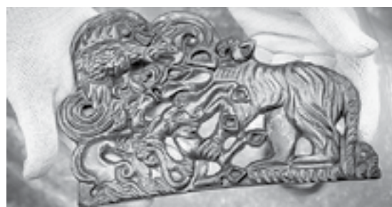
Бережно, в перчатках.