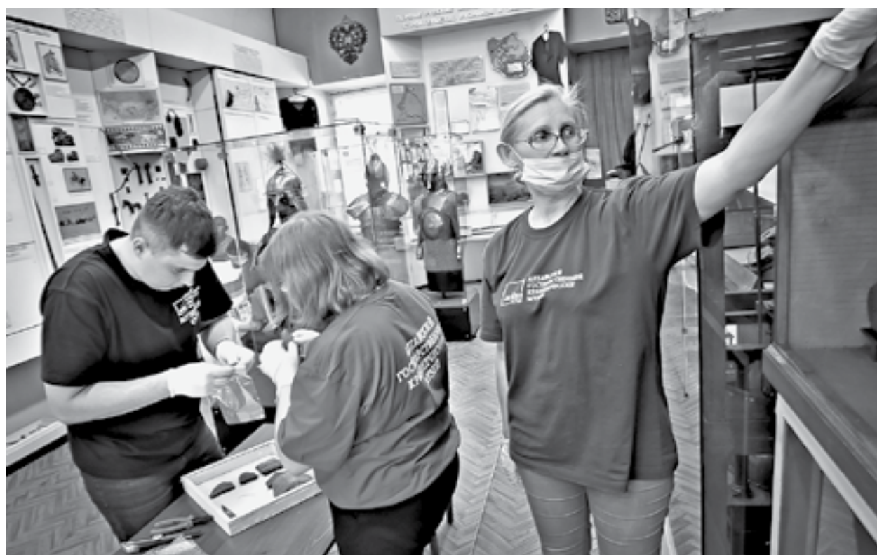
Все предметы, вплоть до мельчайших, сверили по описи и упаковали в отдельные пакеты.

Наибольшее опасения вызывала легендарная модель машины Ползунова, изготовленная в 1825 году по распоря-