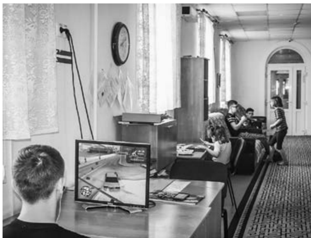
Сегодня в центре помощи №4 находятся дети от 4 до 18 лет.