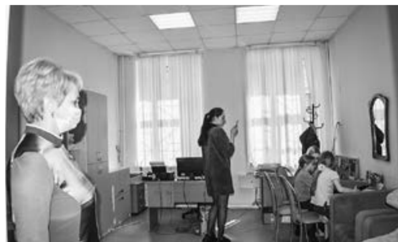
Центр проверяли не только правоохранительные органы, но и депутаты АКЗС.