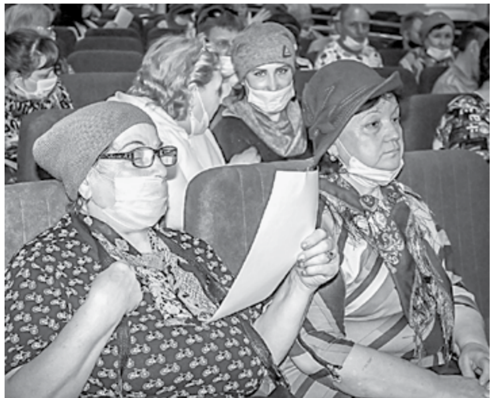
Рубцовчане изучают предлагаемую схему.