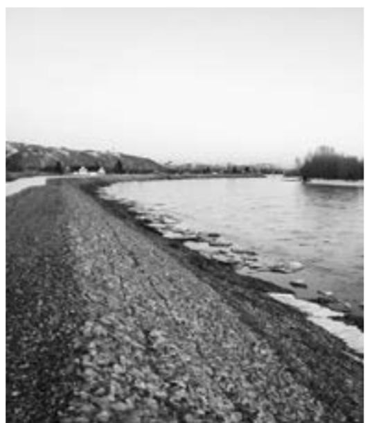
Берегоукрепление в Красногорском районе.