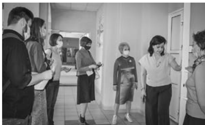
Представителям СМИ показали, в каких условиях живут дети.

Документы, составленные органами, свидетельствуют о том, что изложенные в статье обстоятельства не подтвердились, и мы, как учредители центра № 4, ими обладаем.