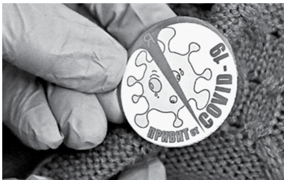
Такие значки выдают тем, кто сделал прививку от коронавируса.

Природа и механизм действия препаратов разные. В «Спутнике» иммунный ответ возникает благодаря обезвреженным частицам аденовируса, а в «ЭпиВакКороне» – искусственно синтезированным пептидам вируса. При этом во втором случае может быть сокращен срок между инъекциями до 14 дней. Допустима реакция на прививку в виде повышения температуры до 38,5 градуса.