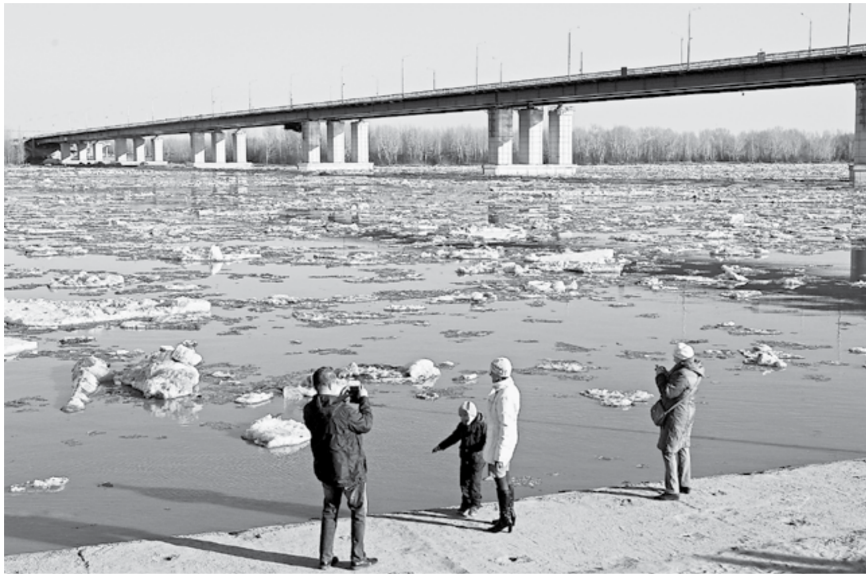
Уровень воды в Оби местами поднимается, но критических отметок не достигает.

На реке Бии ледоход пошел 9 апреля в Красногорском районе, а 13-го числа его наблюдали жители наукограда. К