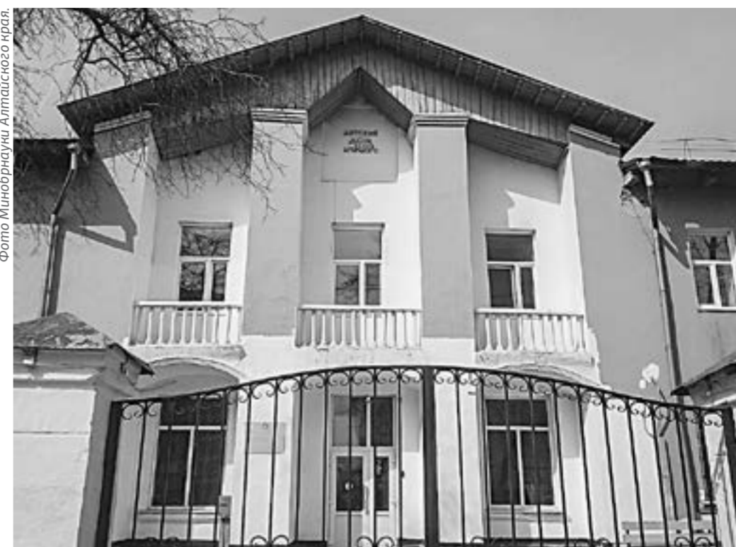
Руководство настаивает на открытости учреждения.