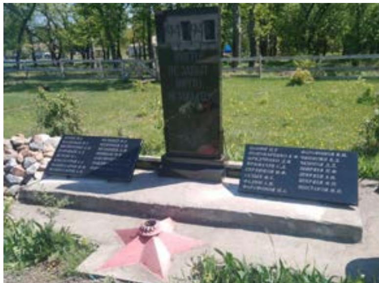
Памятник, сотворенный стараниями детей. Год назад, при поддержке краевого Совета ветеранов и поисковиков отряда «Патриот» был дополнен плитами с фамилиями озимовцев, не вернувшихся с фронта.