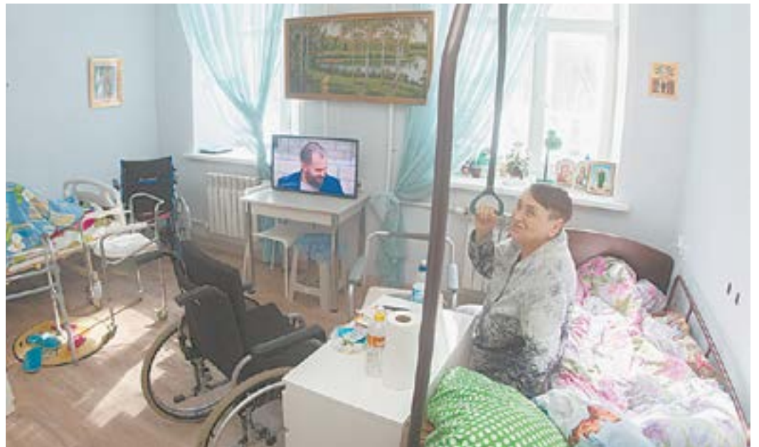
В пансионате «Новые зори» пациенты окружены заботой и вниманием.