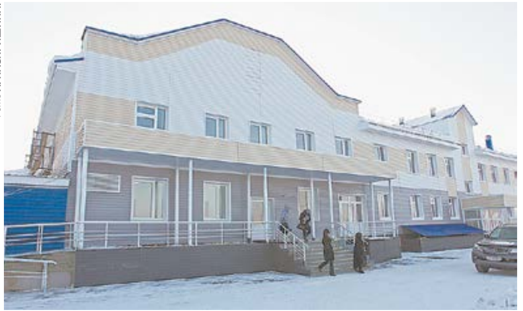
Шелаболихинская центральная районная больница не закроется. Кроме того, начнут принимать пациентов гинеколог, невролог и окулист.