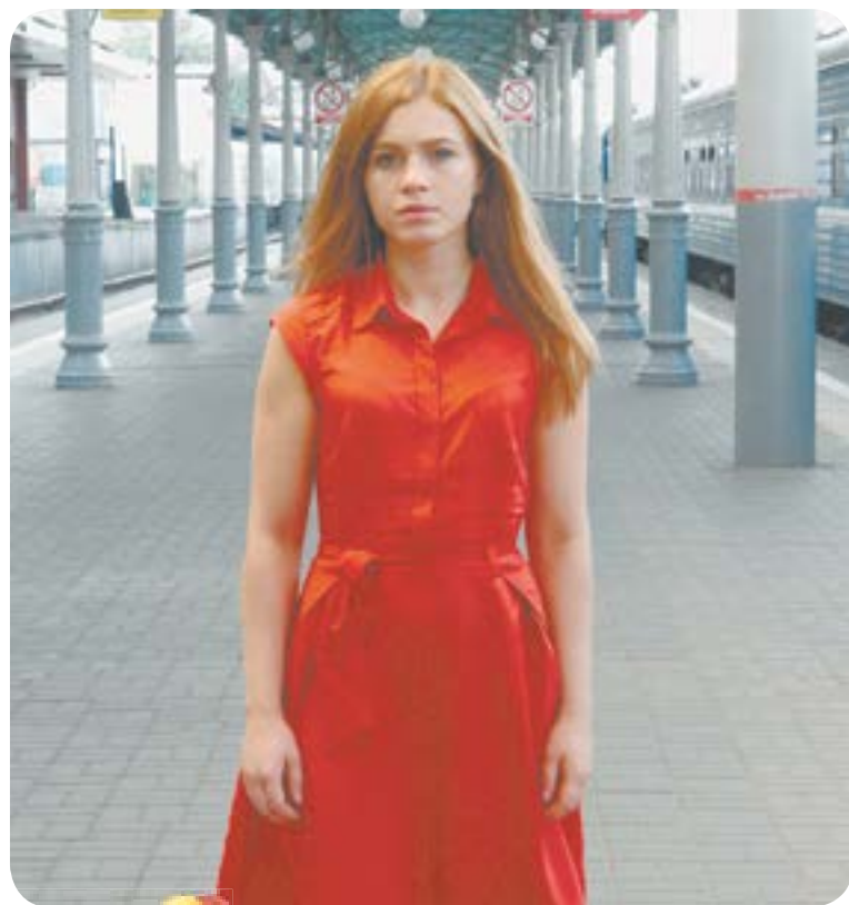
22.00 Х.ф. «Нити любви» (16+)