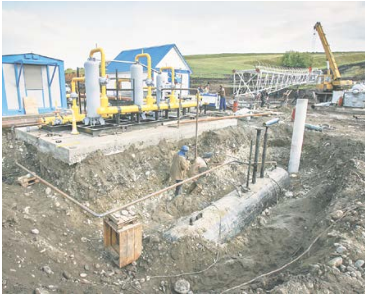
В ближайшие пять лет в крае газифицируют 22 населенных пункта.

Существует несколько вариантов подключения к сетям, и от этого зависит цена. Если желтая труба граничит с участком, то стоимость подключения варьируется от 3700 до 5000 рублей. Если газопровод находится на расстоянии не более 200 метров от домовладения, то она составит около 50 тысяч рублей.