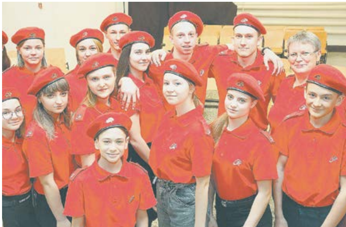
Юнармейцы Поспелихи работают над созданием онлайн-карты памятников Великой Отечественной войны.