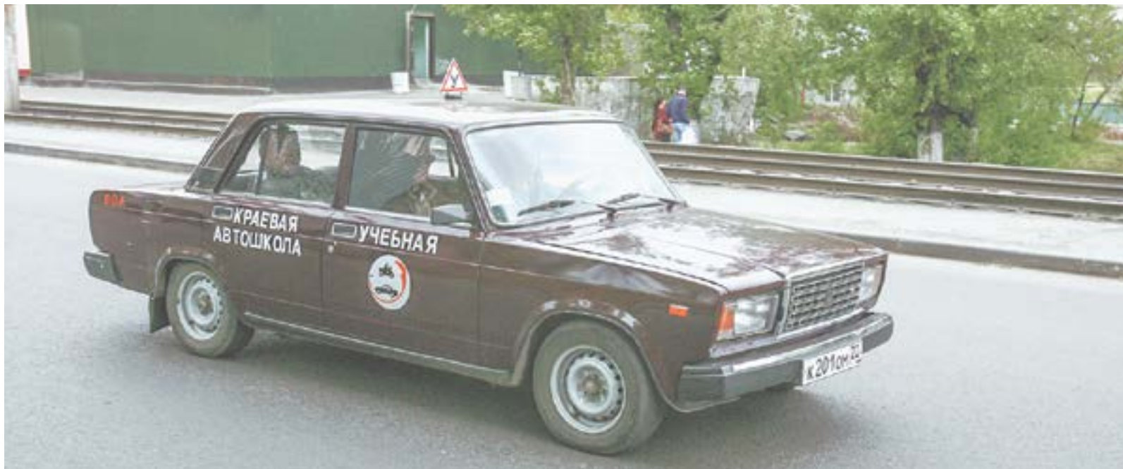
Обучение в автошколах должно подготовить водителей к любым ситуациям на дорогах.