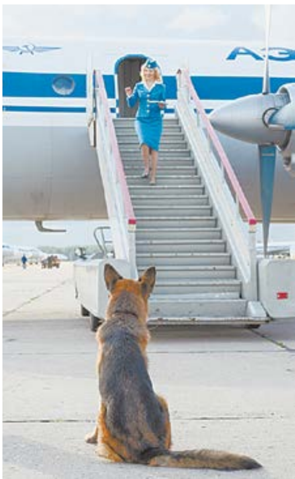
В ожидании возвращения друга.