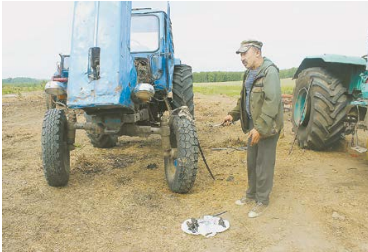
Не у всех алтайских фермеров еще новая высокопроизводительная техника. Но весна пришла, и надо сеять.

Между тем фермер сообщил, что с введением с 1 апреля таможенной пошлины 50 долларов с тонны пшеницы закупочная цена на нее в Алтайском крае опусти-