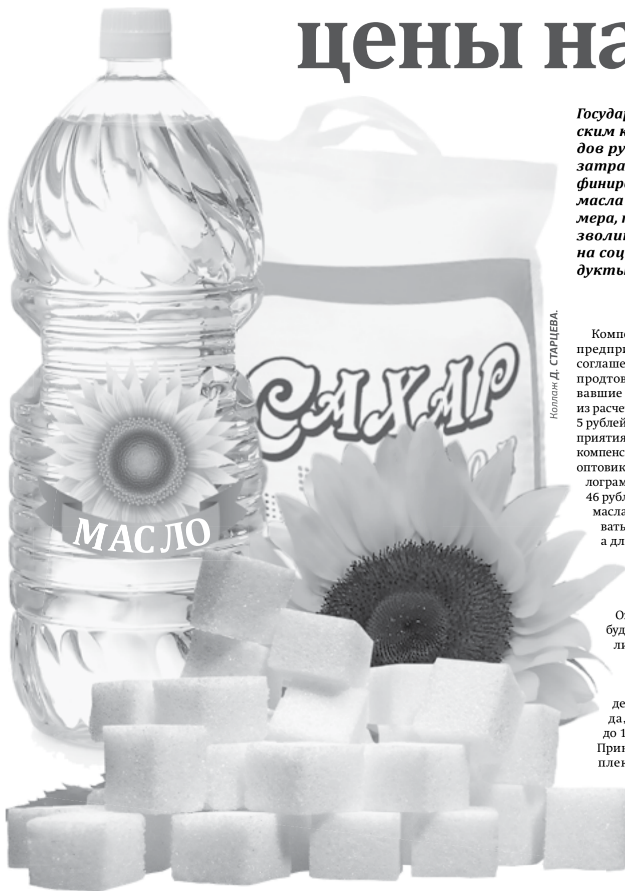
Наталья Д. СТАРЦЕВА