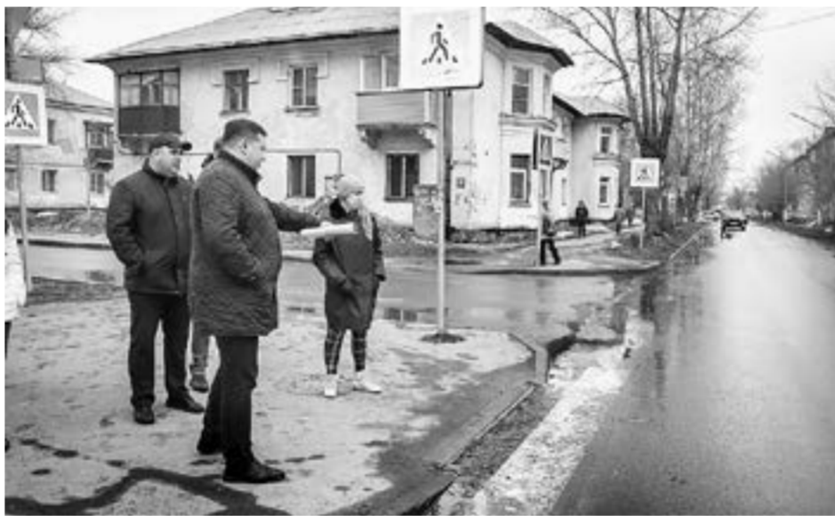
Большинство дорог в центре Новоалтайска уже отремонтированы.