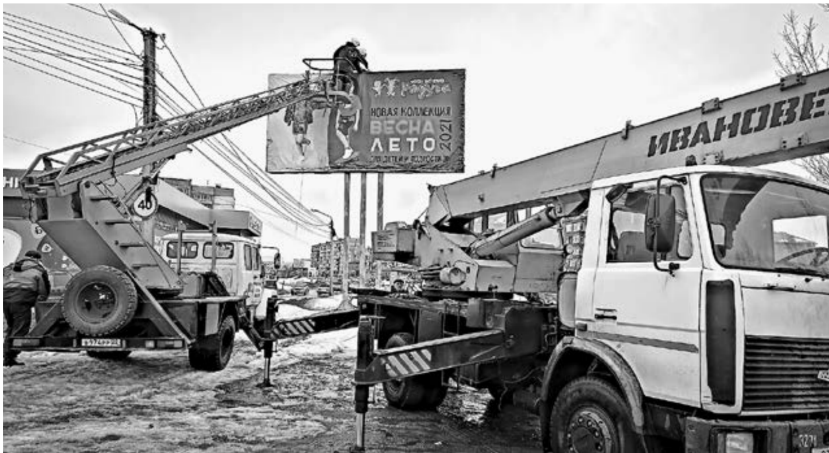
Демонтаж несанкционированной конструкции.

Кстати, это сродни воровству, ведь за каждую установленную рекламную стойку город получает дополнительные средства в бюджет, которые потом идут на различные нужды бийчан.