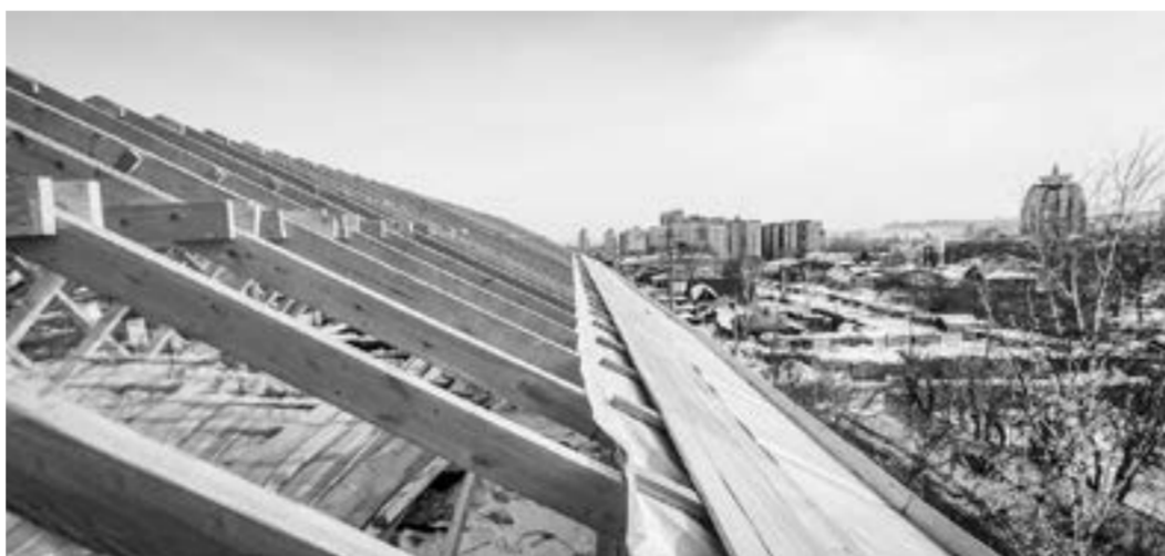
На ремонт МКД в крае потрачено более 5 миллиардов рублей.

В НЕПРОСТЫХ УСЛОВИЯХ Руководитель фонда подчеркнул, что в тяжелый для экономики 2020 год капремонт в Алтайском крае производится без задержек. На 254 многоквартирниках