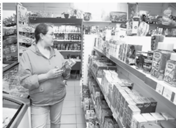
Ретейл оказался в выгодном положении в период ограничений.

На первом этапе введения ограничительных мер предприниматели консультировались по поводу новых условий работы организаций, оказания услуг, отсрочки уплаты налогов и страховых взносов, а также ожидаемых мер помощи. В последующем жаловались на проблемы, возникшие при оформлении документов на получение господдержки.