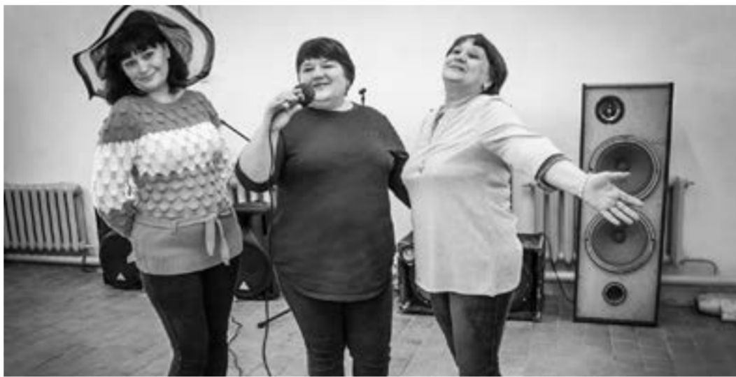
Творческие коллективы теперь репетируют на другой площадке.