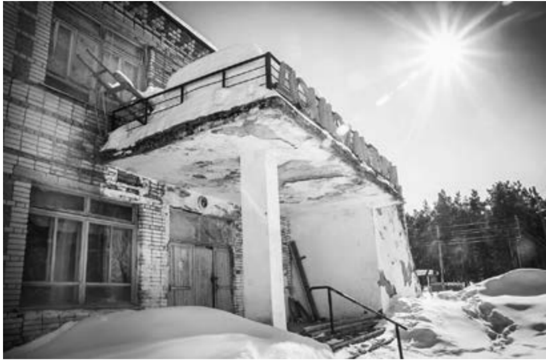
Дом культуры в Усть-Кане закрыли в прошлом году.