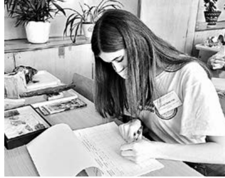
Олимпиада позволила учащимся показать и знания, и профессиональные навыки.

Кстати, в жюри этой олимпиады принимали участие работодатели, которые имели возможность присмотреть для своих предприятий молодых высококвалифицированных работников.