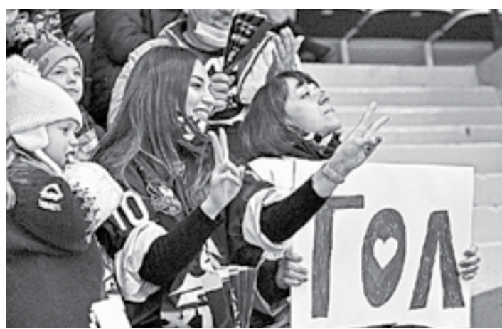
Болельщики стали для команды шестым игроком.