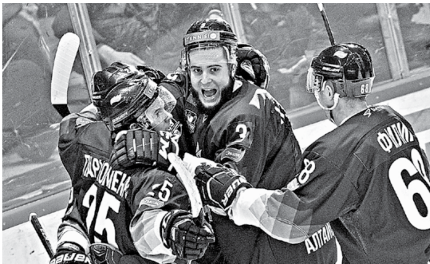
Игроки радуются заброшенной шайбе.