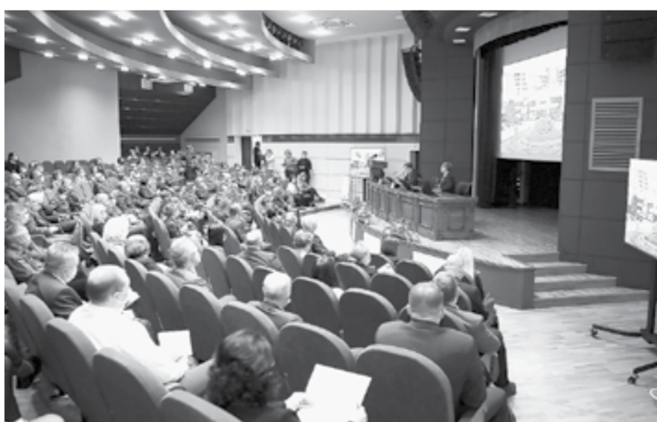
Коллегия Минздрава прошла в Краевой клинической больнице.