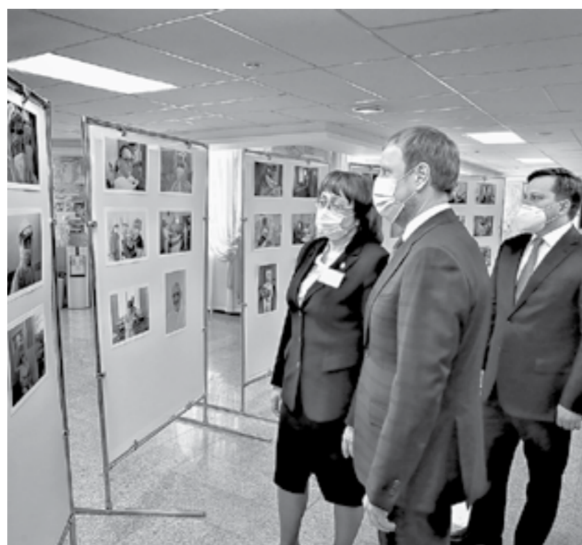
У стенда-летописи подвига врачей и медсестер.