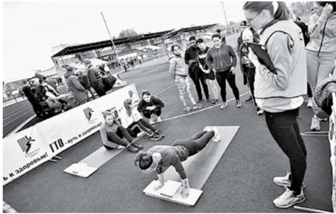
Школьники и студенты составляют львиную долю сдающих ГТО.

Львиную долю значкистов составляют школьники. Для