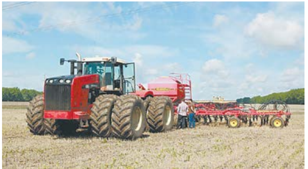
Технология прямого сева в хозяйстве.