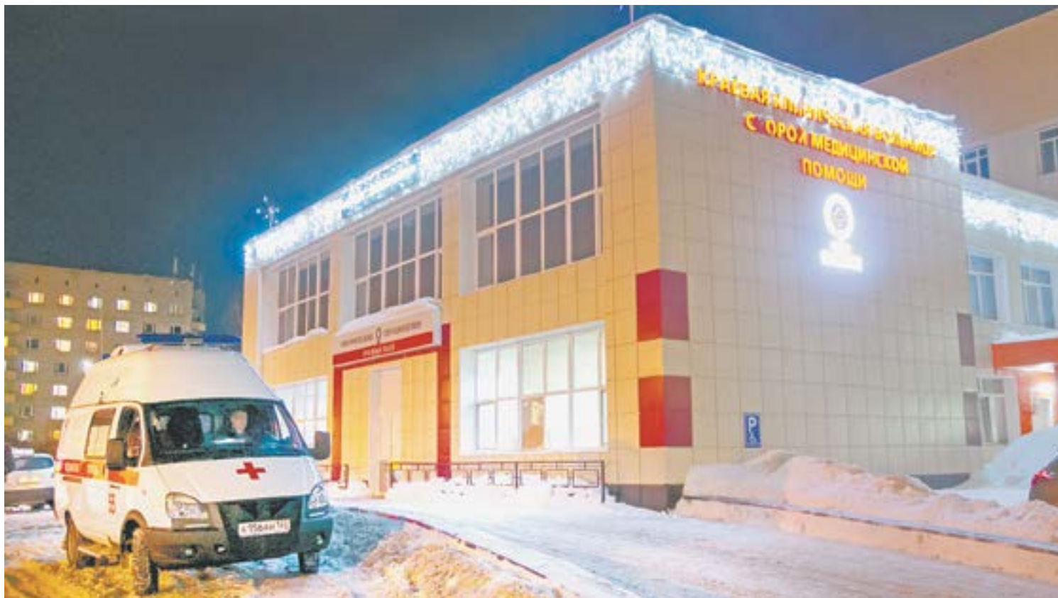
Единственная в крае БСМП работает в авральном режиме.

Пострадавших в техногенных катастрофах, как, впрочем, и во многих других «острых» и тяжелых случаях, – всех принимает сейчас единственная в крае больница скорой медицинской помощи. Количество ее пациентов растет вместе с дорожным трафиком и территорией Барнаульского округа, а потому перегруженной БСМП нужна «сестра».