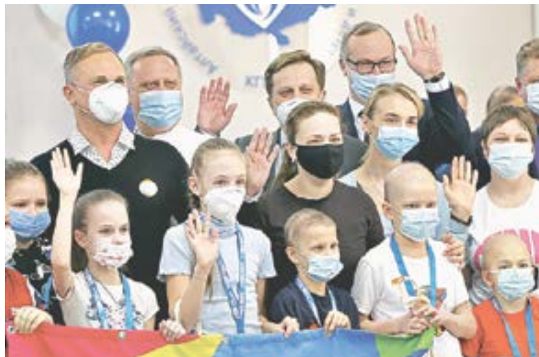
Госпитальная школа открыта.

Госпитальные школы уже работают в клиниках крупных городов России, но для столицы Алтайского края это впервые. Реализация проекта стала возможной, поскольку у нашего региона огромный опыт работы с детьми с ограниченными возможностями здоровья. Его нельзя срежиссировать «на показуху». У нас получилось, потому что есть в крае