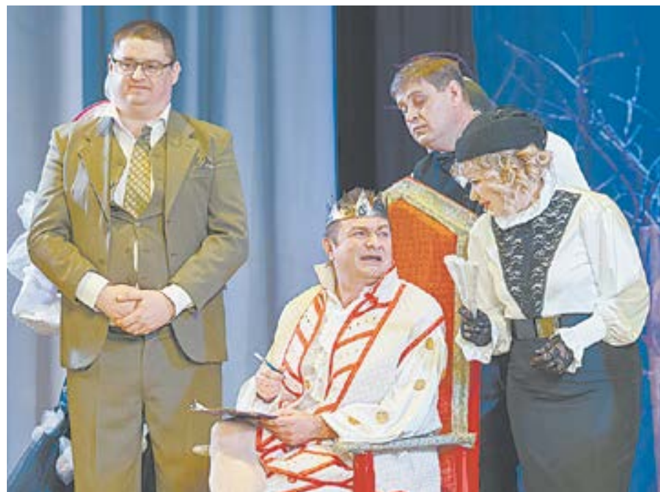
Известные рубцовчане предстали в новых амплу.