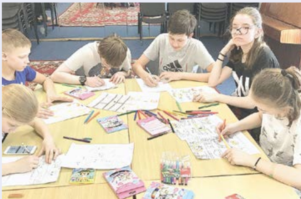
Занятия по проекту «Другие мы» помогают ребятам развиваться.

«Создание комиксов в работе творческой онлайн-студии способствует развитию мыслительной деятельности у totally глухих и слабослышащих детей. В силу особенностей психофизиологического развития им легче воспринимать не текст, а изображение, образы. Комиксы как раз сочетают в себе всё это: здесь