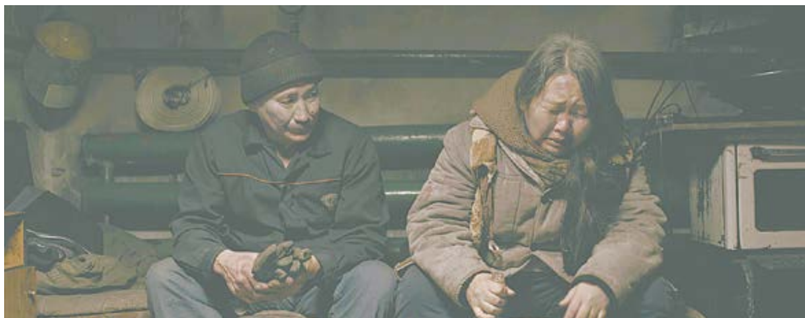
Главная героиня фильма «Пугало» становится проводником настоящих чудес в наш обыденный мир.

Взяв за отправную точку сюжета обычную криминальную бытовуху, которой полны любые новостные сводки, режиссер выстраивает невероятно странную сцену исцеления. Выгнав за дверь всех, включая врача, знахарка раз-