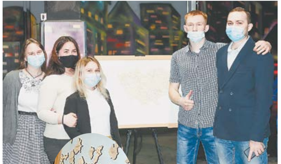
Участники конкурса – алтайские студенты.