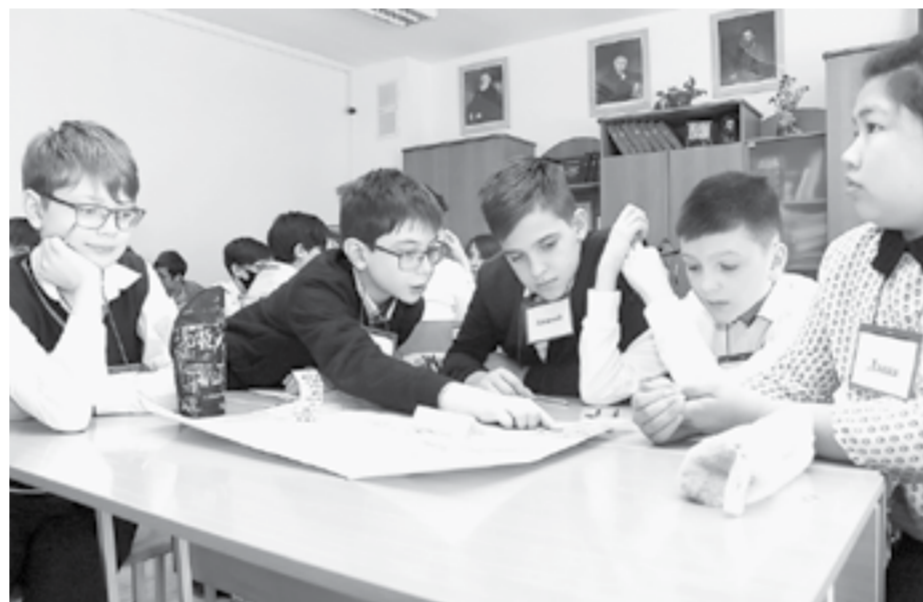
Главные помощники учителей — учащиеся гимназии № 42.