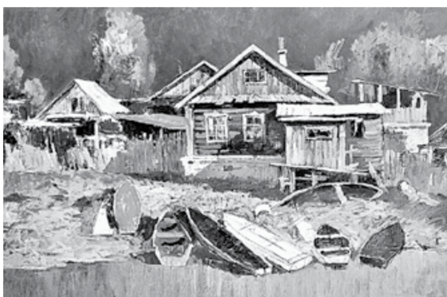
Одна из последних незаконченных работ художника.

педагогика — это живой контакт. И в одну из последних встреч сказал мне: «Ты бы знал, как меня это убивает!» Мне кажется, его это просто замучило.