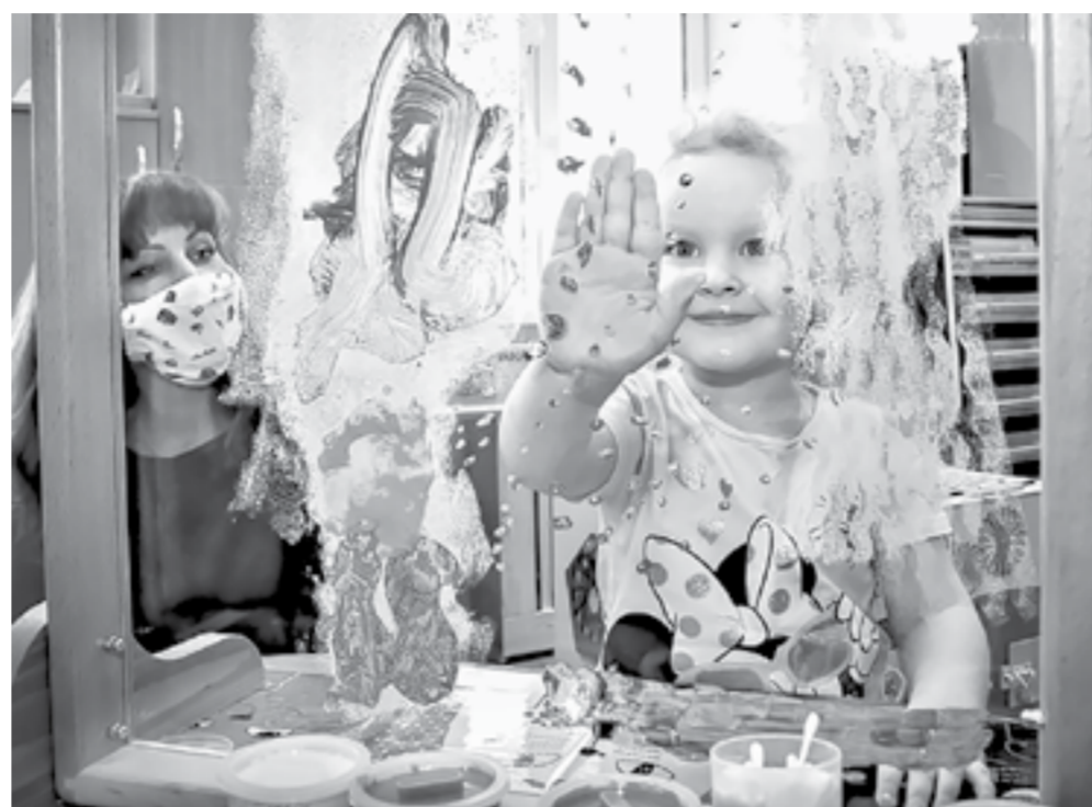
Прозрачное стекло для совместных занятий с родителями.

В Барнауле после капитального ремонта открылся Алтайский краевой центр психолого-педагогической и медико-социальной помощи.