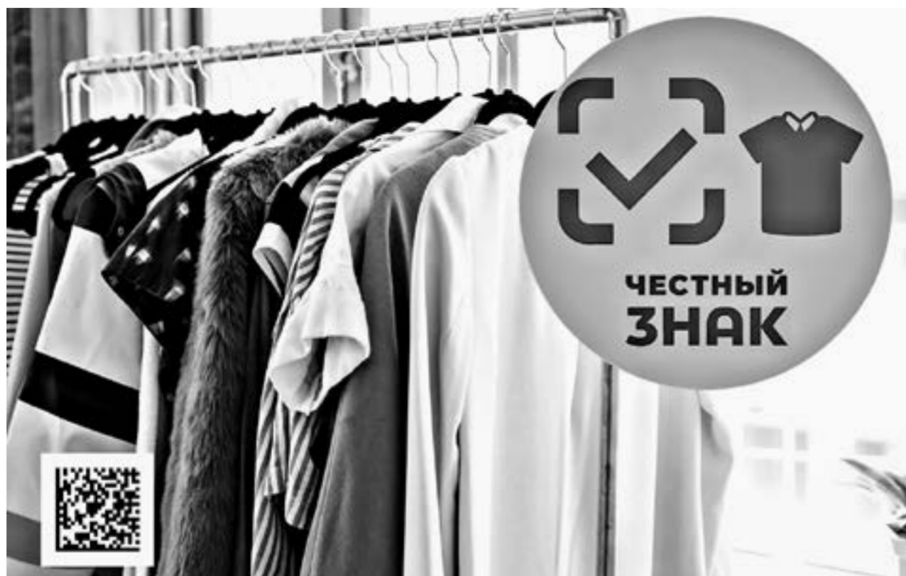
Маркировку остатков товаров легкой промышленности продлили до 1 мая.

За производство, покупку, продажу, перевозку, хранение немаркированной продукции, а также нарушение правил маркировки полагаются штрафы: от 5 тыс. до 10 тыс. руб. — для должностных лиц; от 50 тыс. до 300 тыс. руб. — для ИП и предприятий.