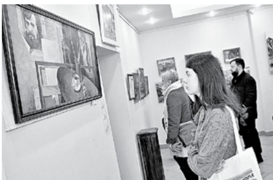
На открытие выставки пришли друзья, коллеги и ученики живописца.