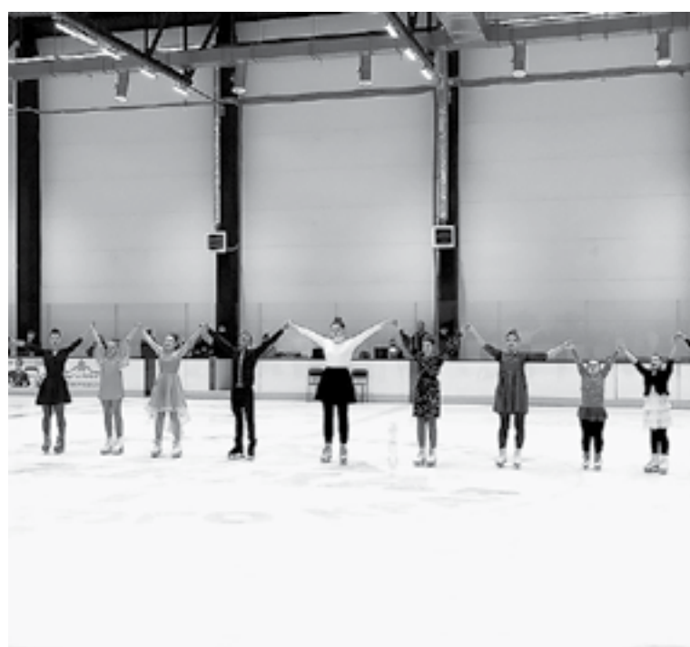
Финальная сцена прощания со зрителями.

В несложных, хорошо поставленных номерах дети чувствовали себя уверенно. Тем более и тренер был рядом, задавая тон на льду. Глядя на него и своих ро-