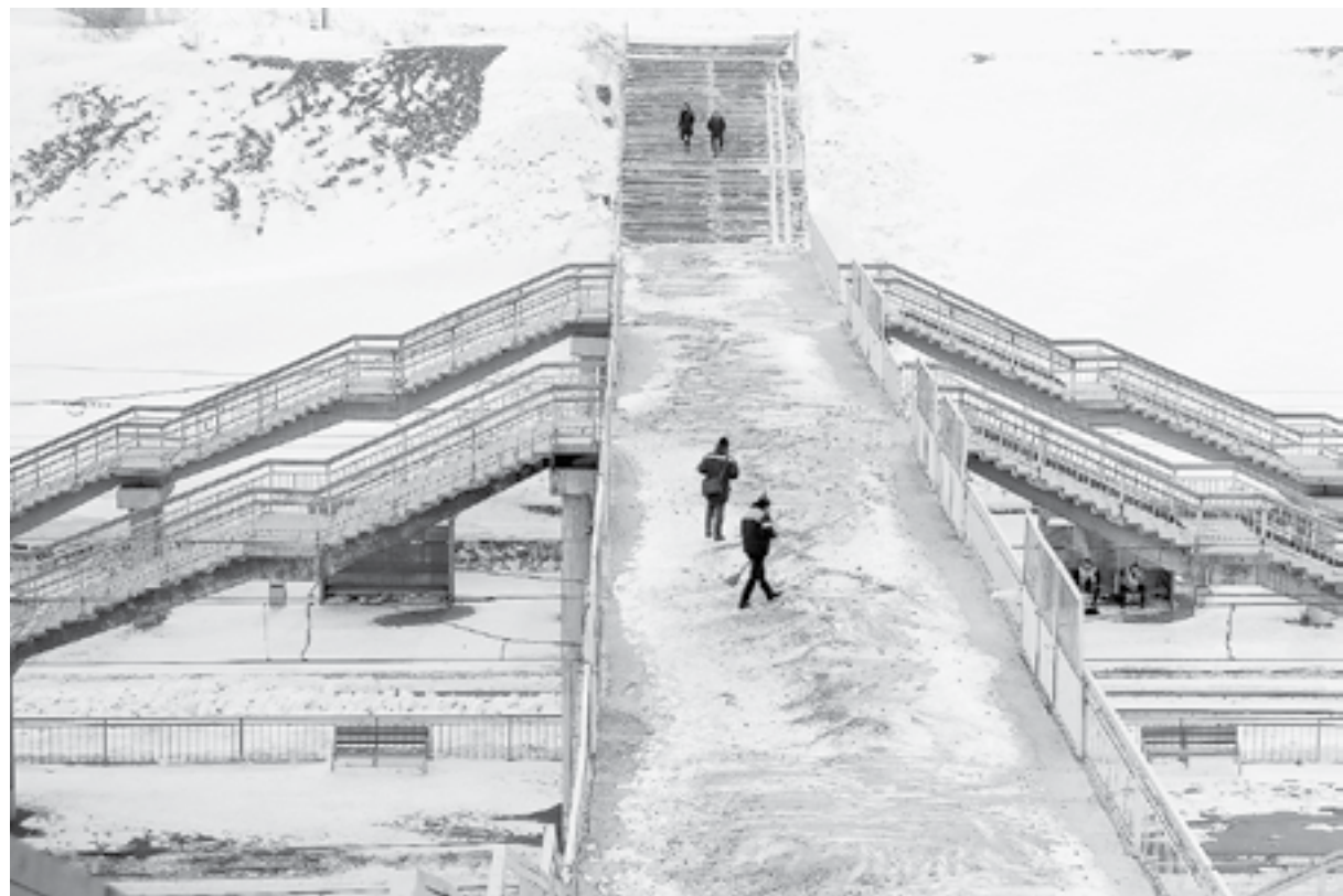
Для безопасности пассажиров пригородных поездов «Лестница» чистится и посыпается песком.