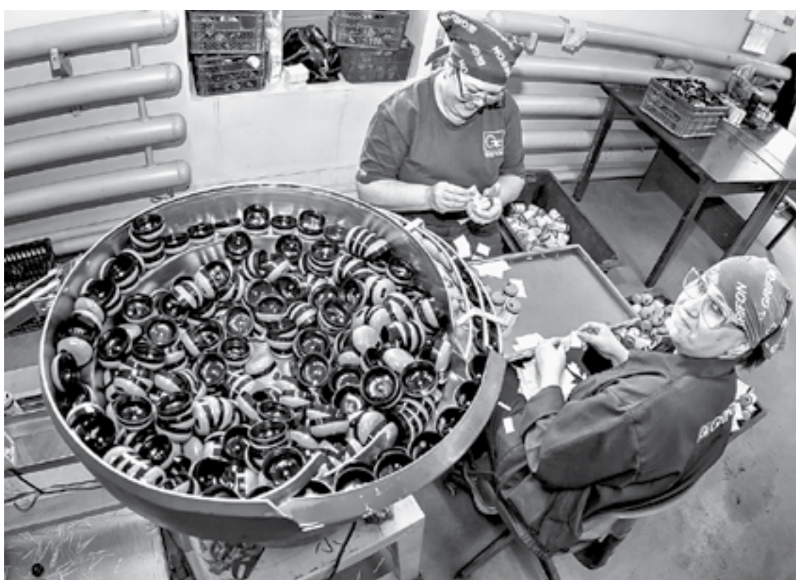
Мамонтовские зубочистки пока не в дефиците.

– Раньше на арендуемой территории другие предприниматели пытались создать комбикормовый завод, затем скотобойню. Но всё