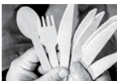
Дерево вытесняет пластик.

Деревоперерабатывающий завод «Грифон» (Мамонтовский район) с 2016 года, может «улететь» из Алтайского края. Между тем меньше чем за 5 лет предприятие стало градообразующим: на нем трудятся больше 350 человек, а выпускаемая продукция востребована как в России, так и за границей.