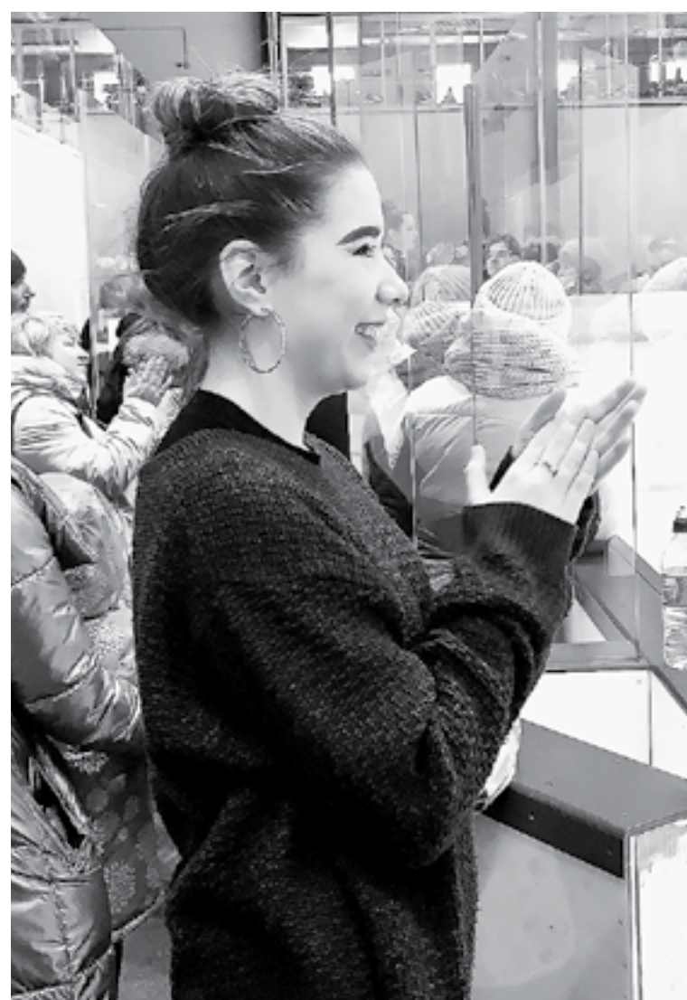
Лучшая поддержка выступающих – аплодисменты.