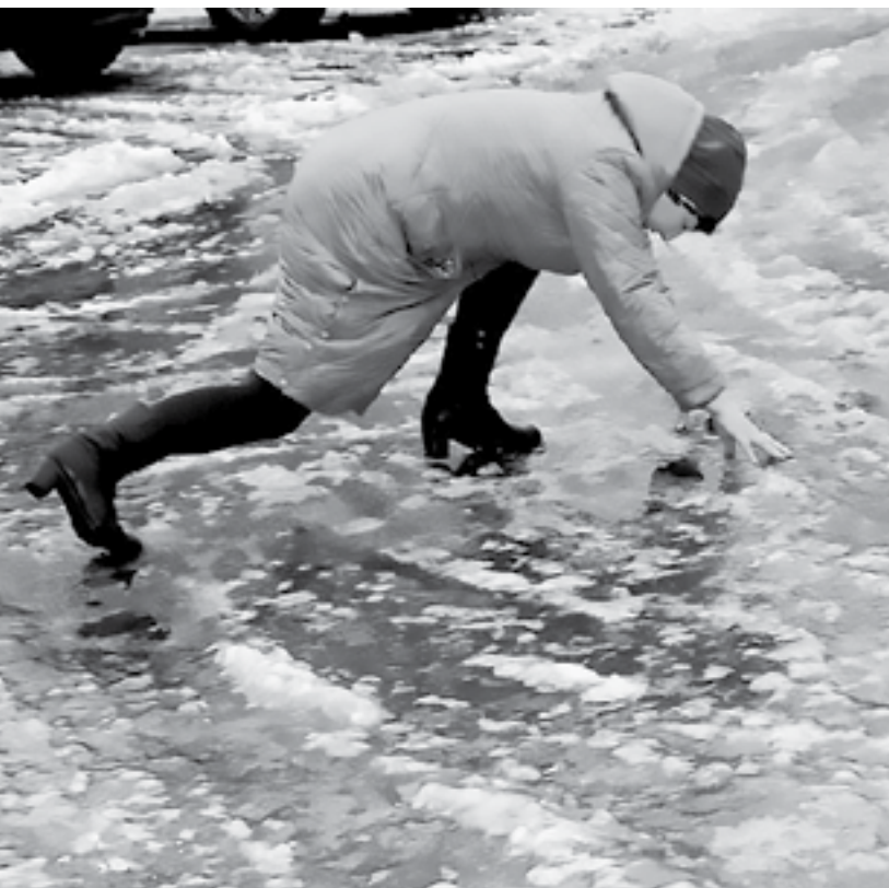
Вместо асфальта – ледяная корка.

«Поскользнулся, упал, потерял сознание, очнулся – гипс» – эту фразу травматологи края слышат сейчас от своих пациентов часто. Зима, традиционный рекордсмен по травмам, в этом году под занавес устроила запредельный аттракцион со «стеклянными» тротуарами и ледяными колдобинами.