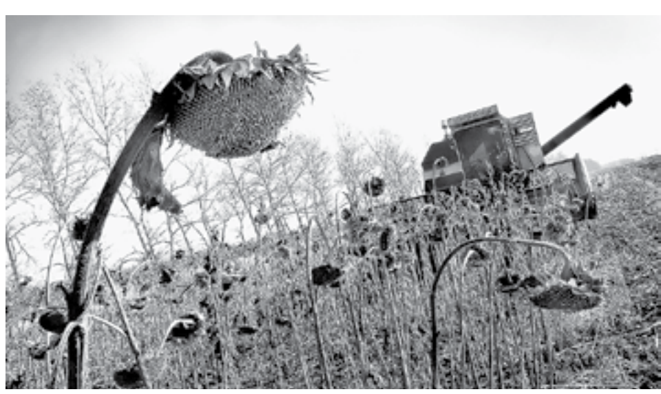
За последние 5 лет площади под подсолнечником в Алтайском крае выросли на треть, до 700 тыс. га.

Свое выступление он начал с критики давно устоявшегося в экспертном сообществе мнения, что алтайские цены на зерно зависят от тех, что сложились в Новороссийском порту. «Никогда в это не верил и верить не собираюсь», – признался министр, отметив, однако, что такая зависимость возможна, только когда падает рубль. Тогда наша пшеница может пойти на экспорт и ее цена будет привязана к мировой. По мнению Чеботаяева, цены на зерно в Алтайском крае зависят от баланса между запасами, производством и продажами. Оптимальные для нас остатки – 800–1100 тыс. тонн. Но когда они на начало сельскохозяйственного года (1 июля) переваливают за 1,5 млн тонн, то цена падает. «Некоторые говорили, что нам не хватит зерна, потому что прошлой осенью мы получили на 14% меньше среднего много-