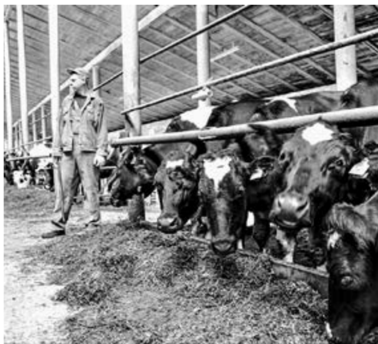
Получить господдержку стало сложнее.

«Процедура достаточно сложная, – признал Межин, – так как это федеральная электронная система и нужно понять, как она работает. В Минсельхозе начали заносить алтайских сельхозпро-