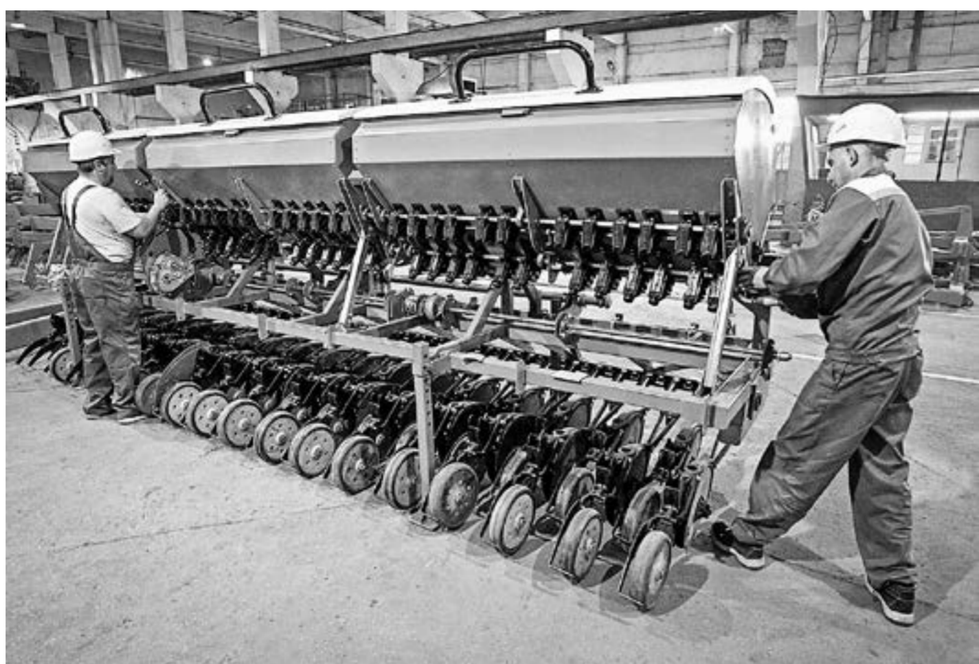
Сенаторы побывали на алтайском предприятии «Велес».

Губернатор рассказал сенаторам, как в минувшем году был освоен первый милли-