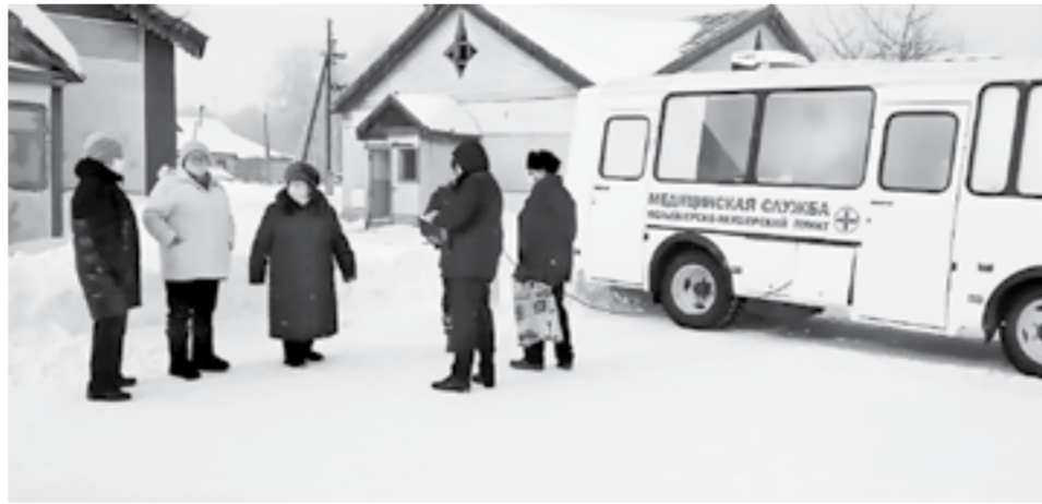
Передвижной ФАП должен доехать с вакциной до каждого села.

визировать до 60 человек в день. Прививку от коронавируса здесь может сделать любой житель старше 18 лет. Нужно только предъявить полис ОМС, паспорт и СНИЛС, сертификат прививок (при наличии). Также при себе необходимо иметь маску и перчатки.