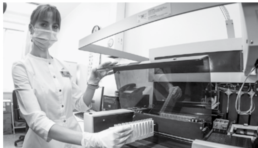
По каплям крови редкий генетический диагноз можно узнать в первые дни жизни ребенка.

Мясо, молоко, хлеб и даже гречка для них яд. Можно только овощи и фрукты. Но, несмотря на диагноз «фенилкетонурия» и статус «инвалид», они стараются жить полной жизнью: профессионально занимаются спортом, танцами, снимаются в кино.