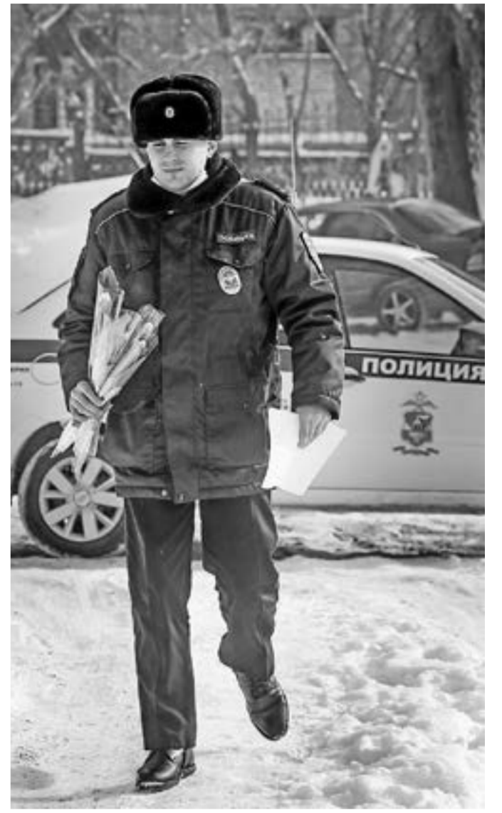
Сегодня участковый – с букетом.

Но участковому в этот раз душевно поговорить нет времени, надо спешить по другим адресам.