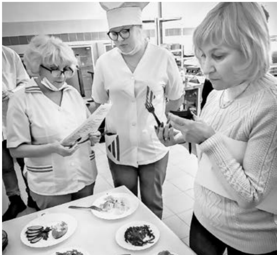
Строгое жюри оценивает качество блюд.