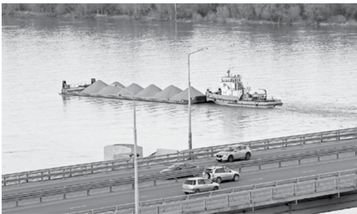
Углубление фарватеров рек позволило продлить сроки навигации.