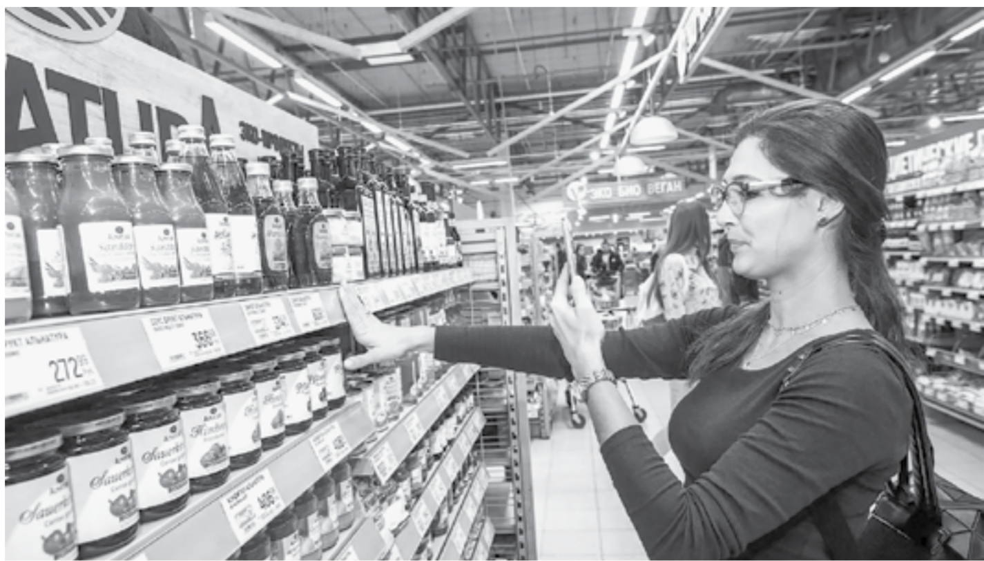
Большинство жителей края готовы покупать экологически чистые продукты по повышенным ценам.

Две трети жителей края готовы покупать экологически чистые продукты даже по повышенным ценам. Таковы результаты локального опроса ученых АГАУ, прозвучавшие в ходе научно-практической конференции «Аграрная наука – сельскому хозяйству».