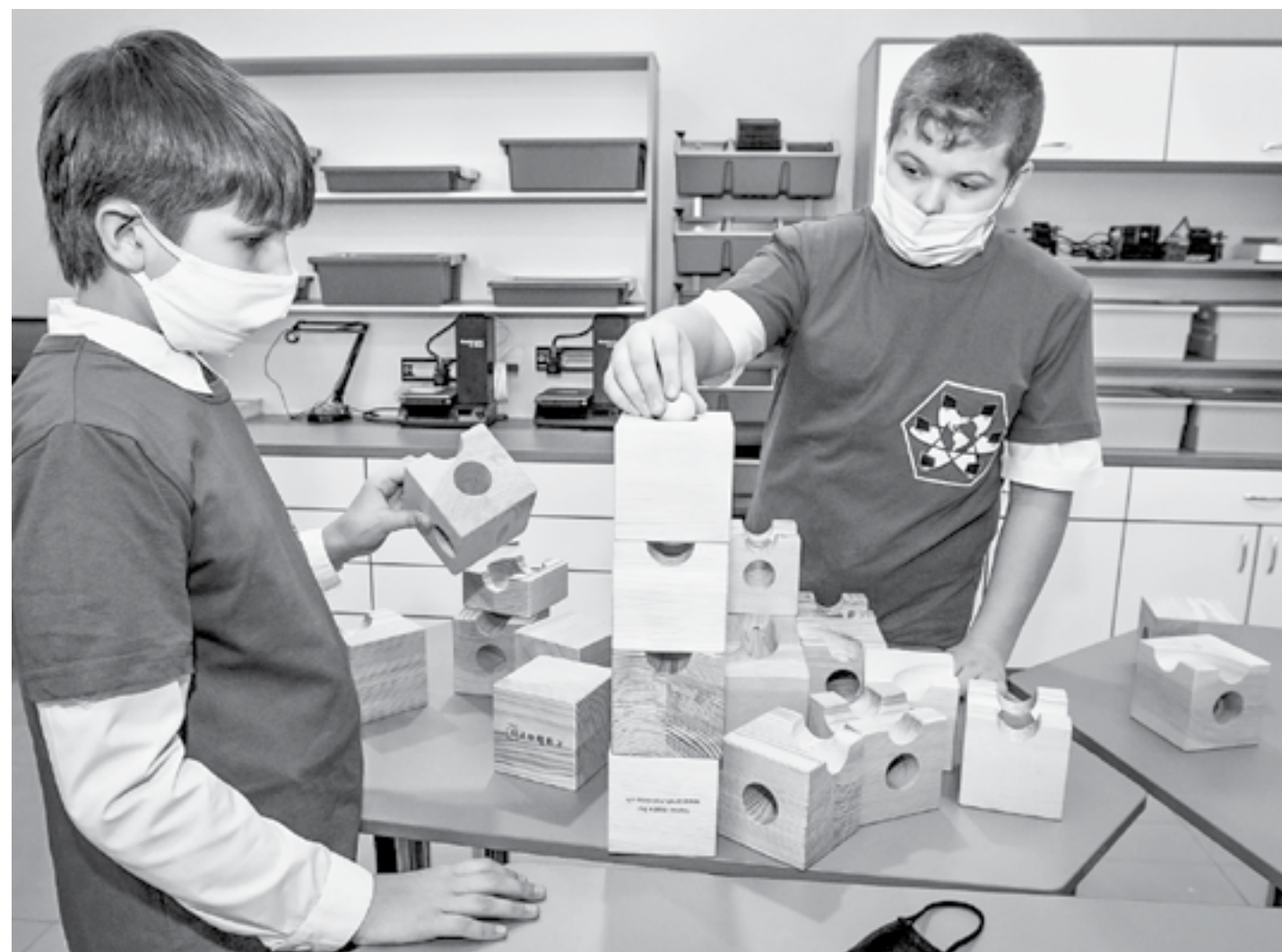
Ученики школы № 53 рассказали о своих достижениях.

Премьер отметил: правительство всегда поддерживает государственно-частное