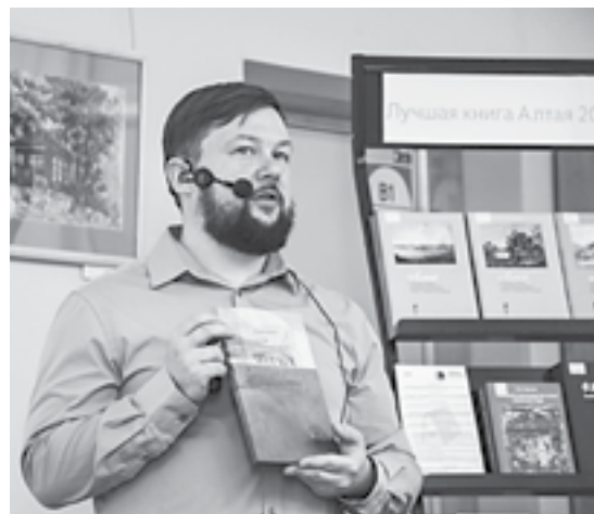
Автор книги – искусствовед Михаил Чурилов.