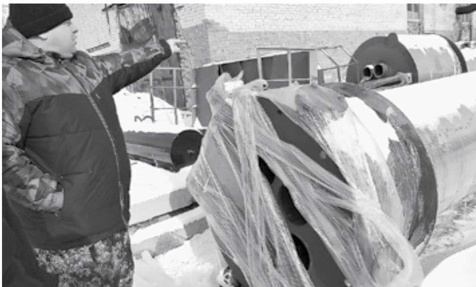
В Залесовском районе закупили современное котельное оборудование.