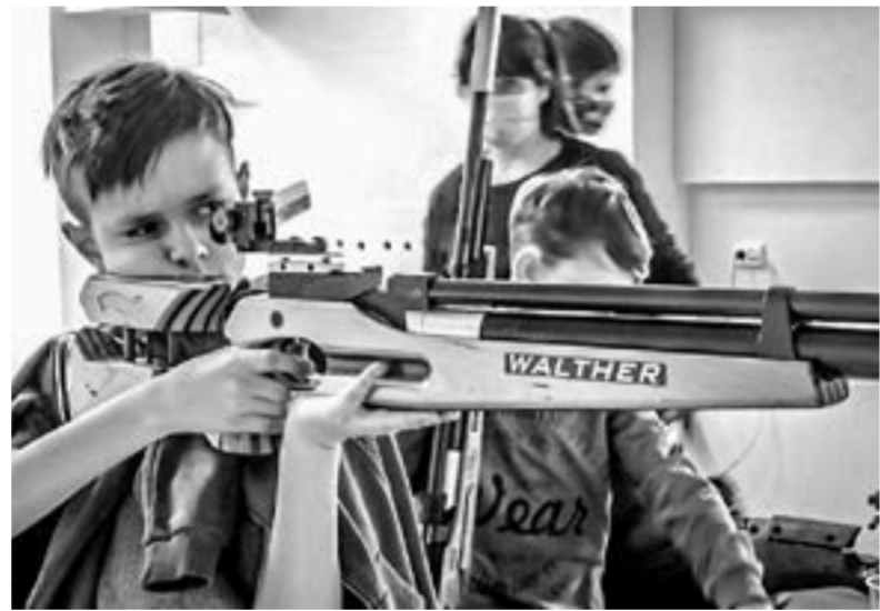
Освоение нового тренажера.

поиском места под тир и в конце концов остановились на подвале второй гимназии. Проверили помещение на соответствие, довольно быстро прошли стадию проектирования.