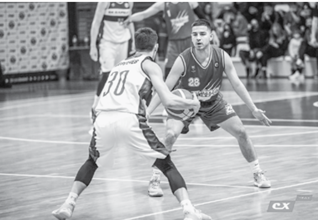
Ростовчане сумели сотворить сенсацию в Барнауле.