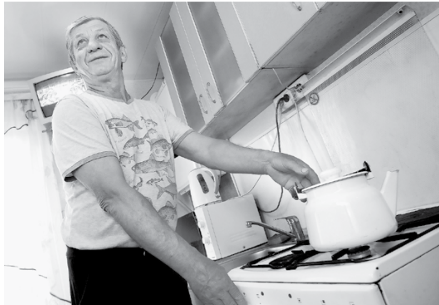
Сжиженным газом пользуется каждый третий житель края.

Без субсидий из краевого бюджета крупнейший поставщик сжиженного газа может оставить без голубого топлива 700 тысяч жителей региона.