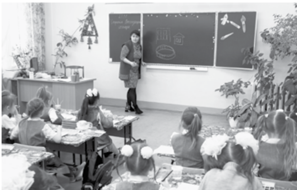
Педагоги Алтайского края теперь имеют право на бесплатную юридическую помощь.

В документе прописаны положения о мерах социальной поддержки педагогических работников, материального и морального стимулирования, гарантии