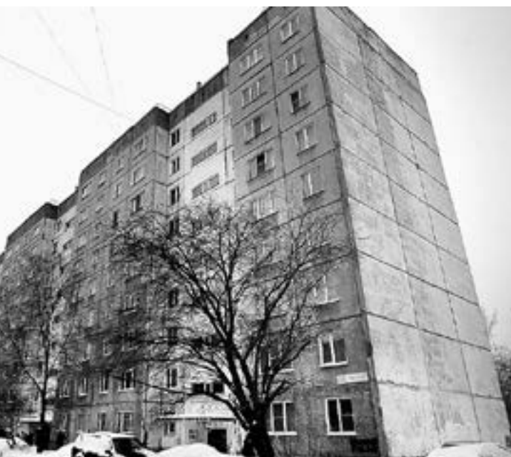
В девятиэтажке на ул. Попова, 108, меньше платят за ЖКХ.

— Январь был суровый, но в квитанции выставлена сумма значительно меньше, чем в прошлом году за тот же ме-