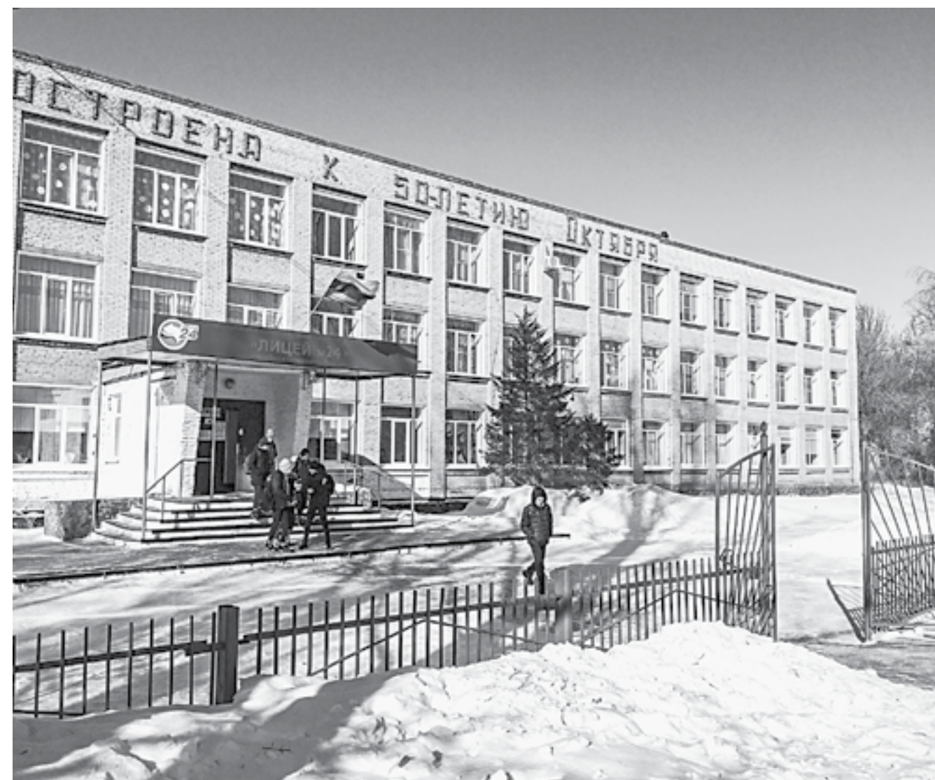
С новыми окнами в лицее № 24 стало намного комфортнее.