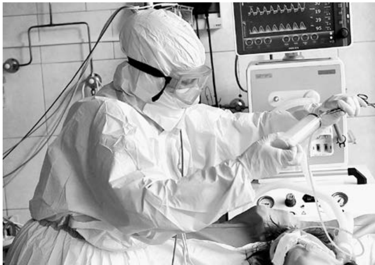
Дополнительные средства в первую очередь будут направлены на повышение зарплаты бюджетников.

Документ регулирует процесс формирования и принципы работы молодежной парламентской структу-