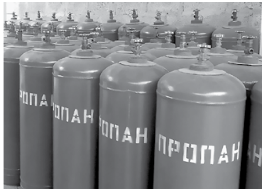
Биржевая цена пропана выросла на 40%.