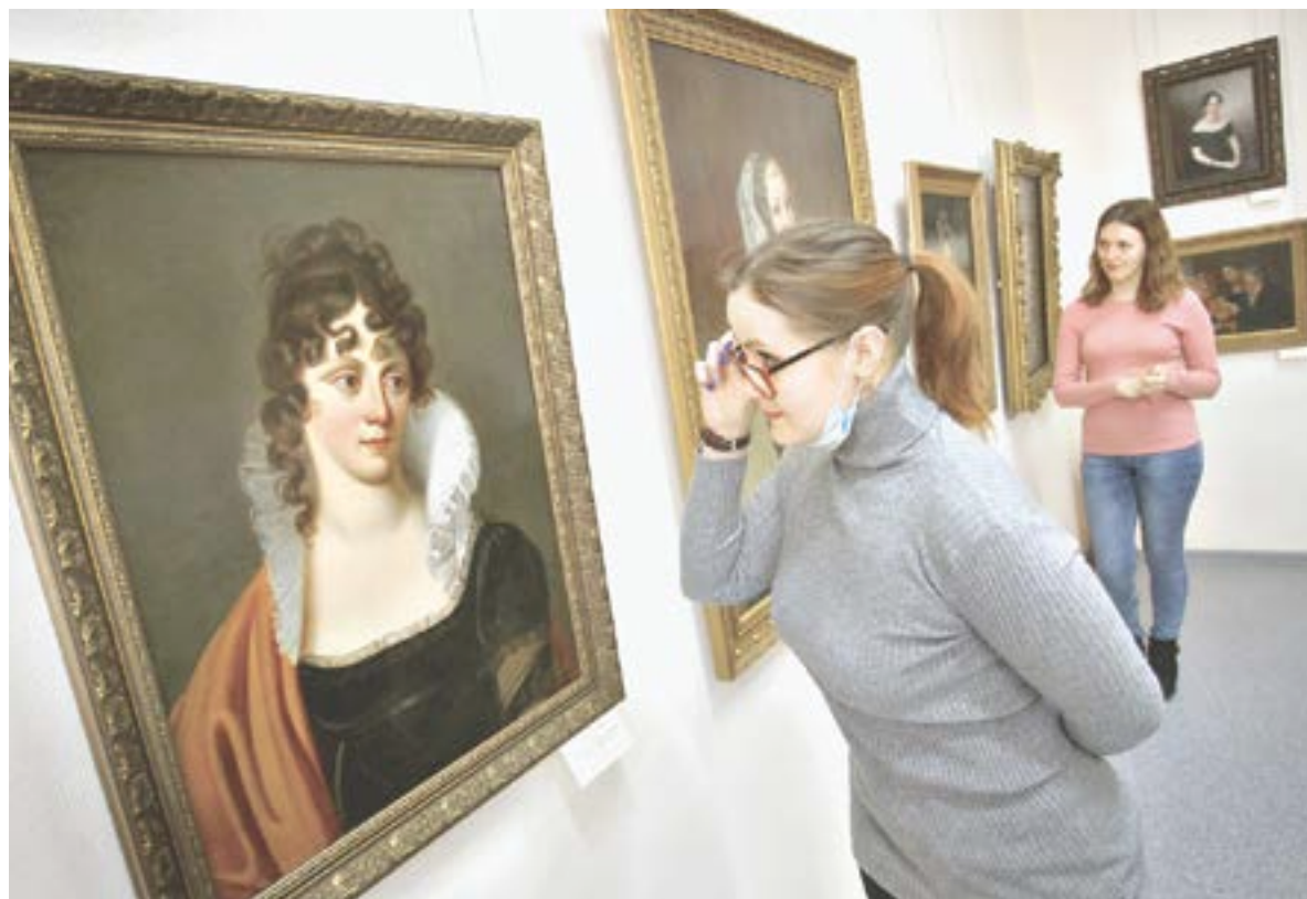
В экспозиции 20 произведений, позволяющих проследить «модную историю» в лицах.