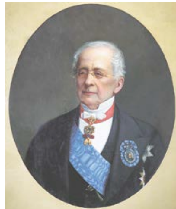
Николай Богацкий. Портрет А.М. Горчакова – последнего канцлера Российской империи.