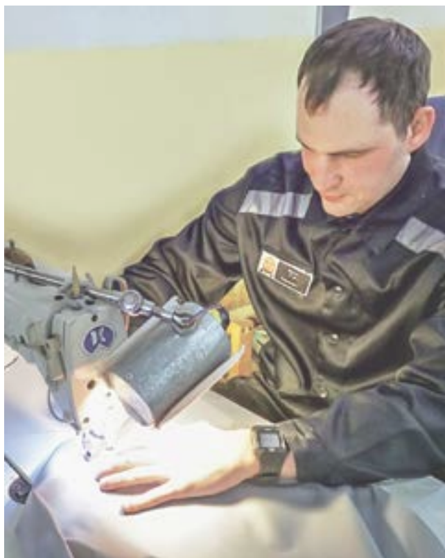
Роман у швейной машины.