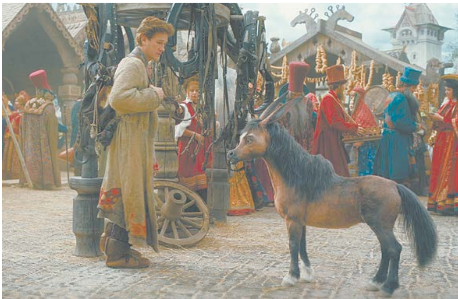
Создавая свой сказочный мир, художники ориентировались на Билибина, деревянное зодчество, русский модерн и народные промыслы.

Кстати, внешность Конька, помнится, вызвала в Интернете шквал негодования, когда вышел самый первый трейлер фильма: зрителям (да и мне тоже) показалось, что он чертовски похож на ослика из мультфильма «Шрек».