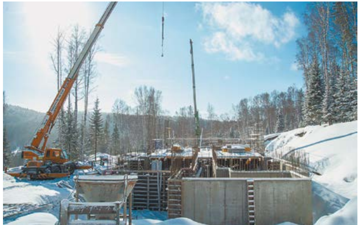
На площадке криокомплекса завершается возведение цокольного этажа.

«ЗАСТРОЙКА ТЕРРИТОРИИ ИДЕТ СТРОГО ПО РАЗРАБОТАННОМУ ГЕНПЛАНУ. НЕТ ТАК НАЗЫВАЕМОГО НАХАЛСТРОЯ. ДУМАЮ, СО ВРЕМЕНЕМ ЭТО БУДЕТ ОЧЕНЬ СЕРЬЕЗНЫЙ КУРОРТ».