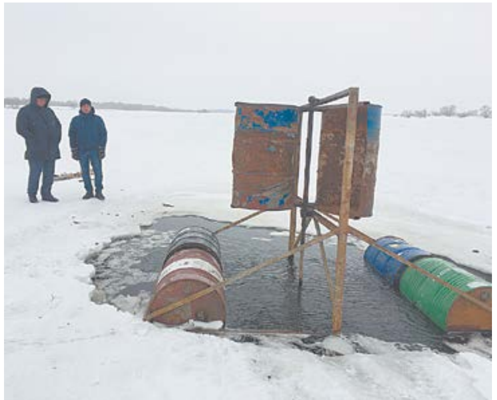
Недавно на озере установили аэратор.