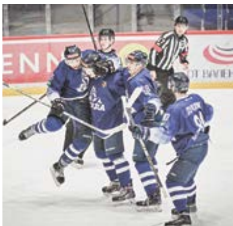
Алтайские хоккеисты празднуют свой триумф.

Перед заключительным туром хоккеисты «Динамо-Алтай» уступали «Чебоксарам» пять очков, что казалось гигантским отставанием. В этой ситуации можно было бы успокоиться и целенаправленно готовиться к плей-офф. Однако барнаульцы не смирились с этим положением, поставив перед собой максимальную задачу – кровь из носу обыграть «Кристалл», приехавший в Барнаул на серию из четырех матчей. В надежде на то, что «Чебоксары» в последнем туре дома наберут в играх с «Челнами» не больше двух очков из восьми возможных. А это многим виделось чем-то из области фантастики.