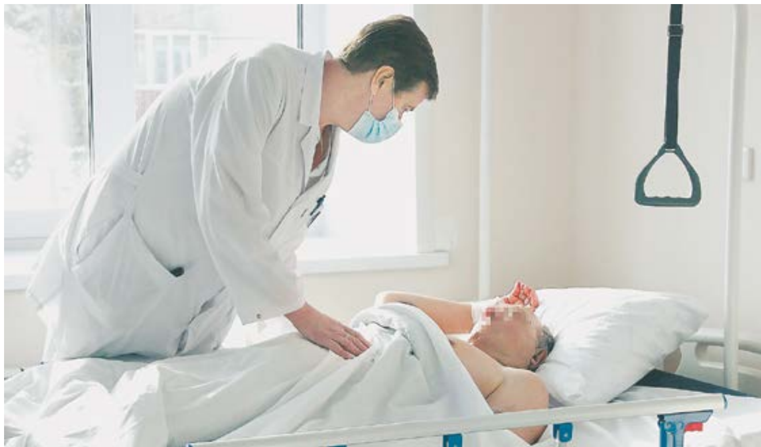
В новом сосудистом центре пациентов спасают от глубокой парализации при инсультах.