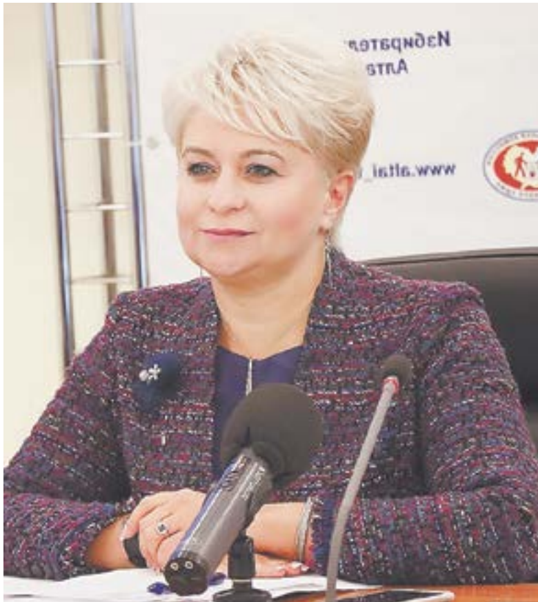
Ирина Акимова, председатель краевой Избирательной комиссии.

– Формированию подлежали 74 территориальные избирательные комиссии. Исключение составила Локтевская районная ТИК, срок полномочий которой истекает в 2023 году. При этом следует отметить, что на территории Индустриального района города Барнаула теперь действуют две территориальные избирательные комиссии. Предложение Избирательной комиссии Алтайского края о формировании второй ТИК было поддержано Центральной избирательной комиссией Российской Федерации. Потребность в этом возникла в связи с высоким ростом численности избирателей и значительным уве-