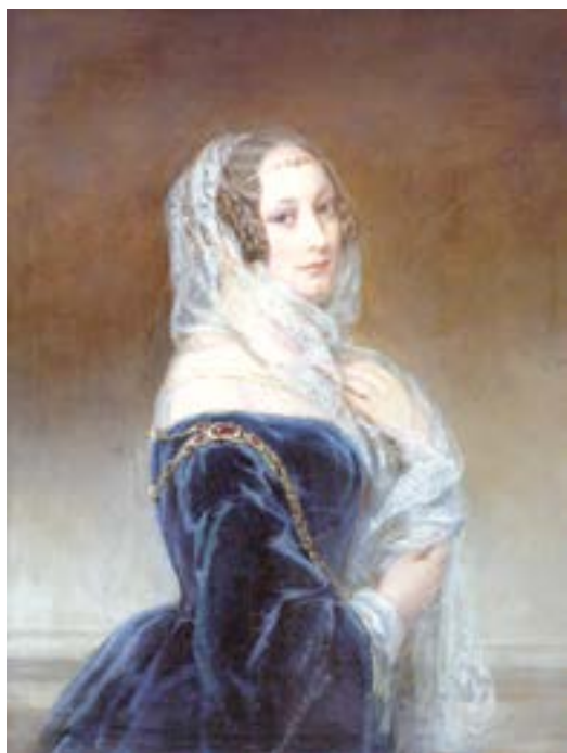
Портрет М.Ф. Барятинской шотландской художницы Кристины Робертсон, работавшей при дворе Николая I.