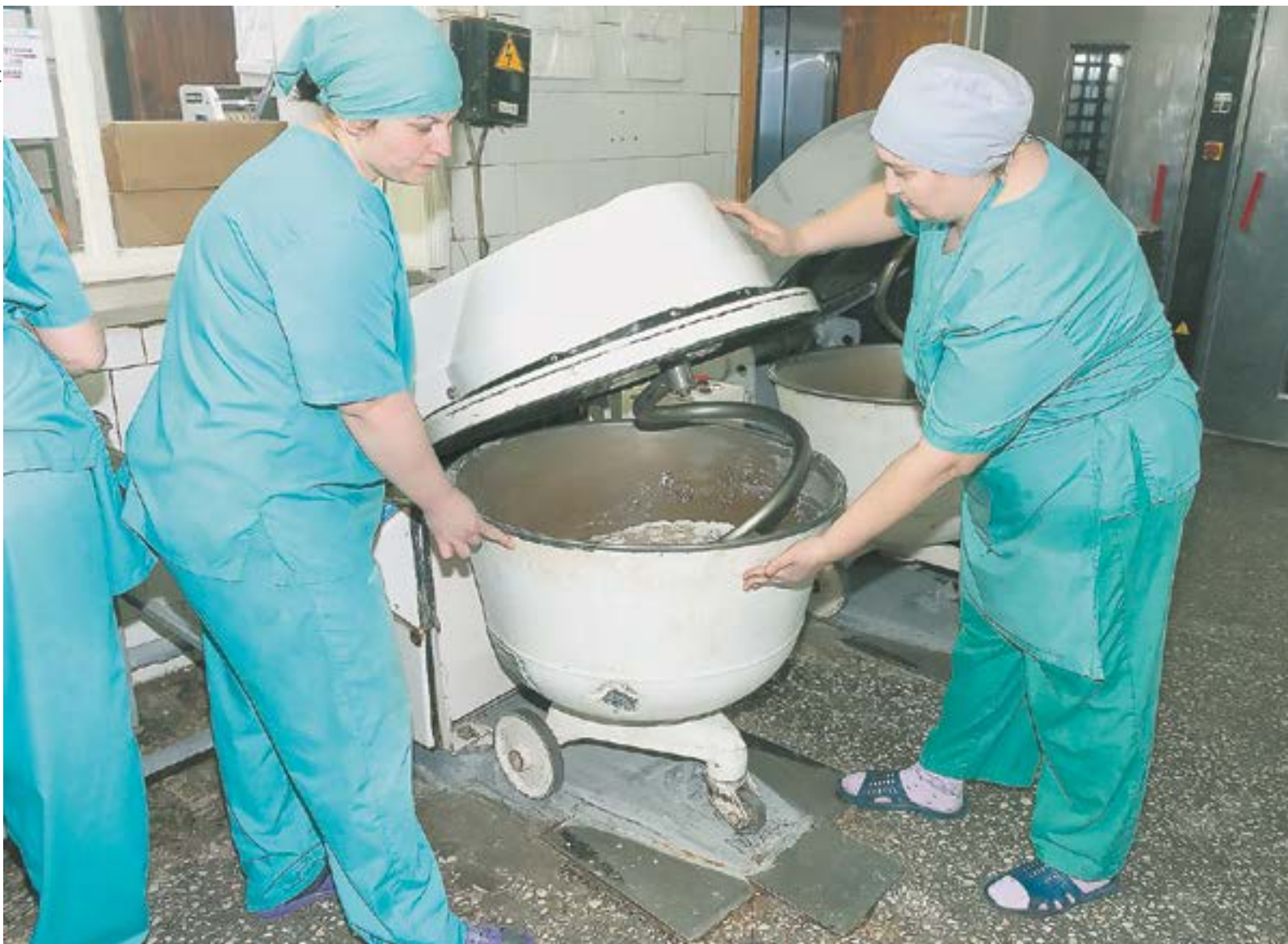
Алтайская мука и изделия из нее востребованы в крае и далеко за его пределами.