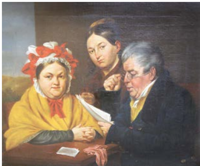
«За чтением. Семейный портрет». Этот холст неизвестного автора музей приобрел в Барнауле.