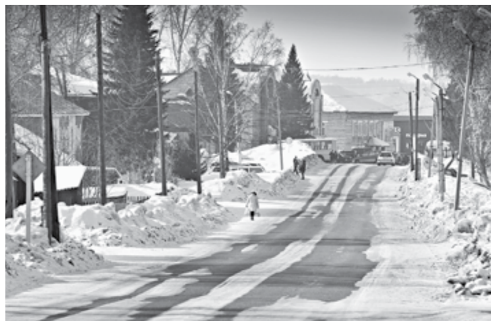
С инициативой по объединению выступили залесовцы.

На январской сессии депутаты АКЗС в первом чтении поддержали базовый законопроект о создании муниципальных округов. Он стал первым в пакете нормативно-правовых актов, которые