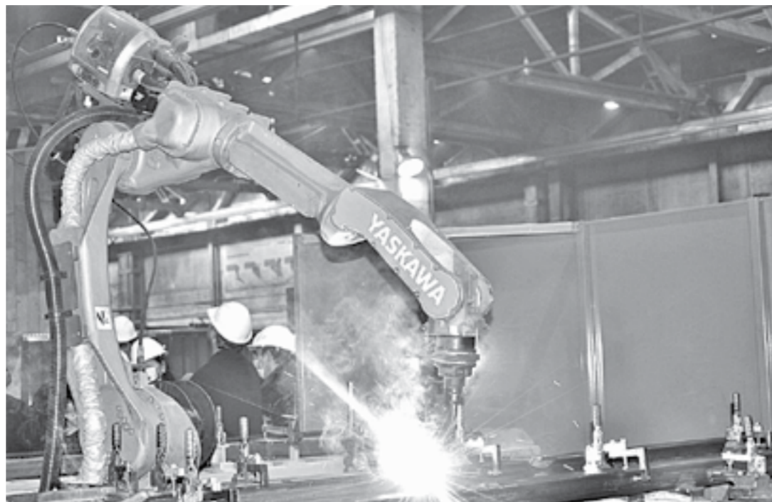
Сварочный робот – аналог оборудования, которое появится.