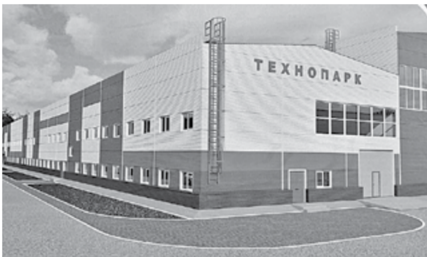
Облик будущего технопарка.

Будет создано 110 рабочих мест, где с учетом сменности трудиться около 250 человек. По сути, новый завод для производства оборудования и инструментов, необходимых для отрасли сельхозмашиностроения. Точнее, этим займется резидент. Ведь основной целью создания промышленного технопарка является