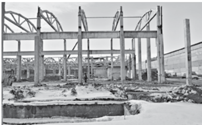
Строительство ведется на территории бывшего АЗТЭ.

Под технопарк на территории бывшего АЗТЭ выделено 13 тысяч кв. м.