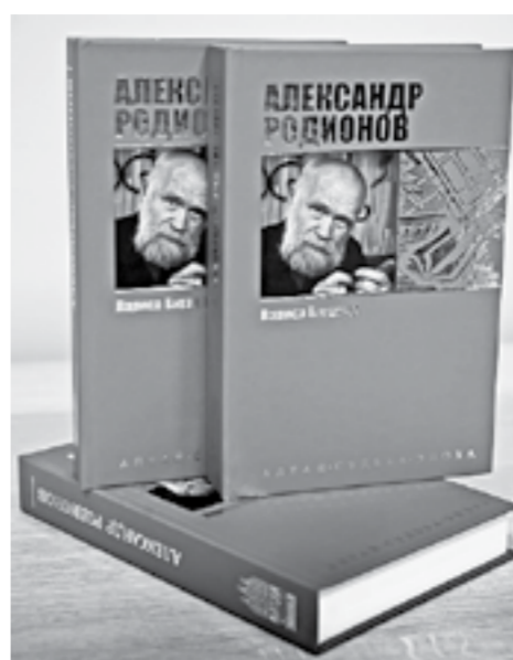
В книге более 460 страниц.