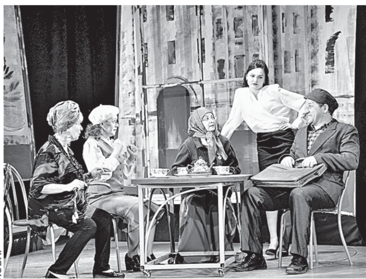
Спектакль по пьесе «Бесприданник».

С наступлением печального периода пандемии в апреле 2020 года показы были отменены. Но уже с 15 мая Рубцовский драмтеатр присоединился к общероссийской благотворительной акции, выставив для бесплатного онлайн-просмотра два своих спектакля: детский «Куда уходит Дед Мороз» и взрослый «Невольницы» по Островскому. А также фильм-бенефис, в который вошли лучшие фрагменты из репертуара. Уже к началу июня спектакли посмотрели более полутора тысяч человек.