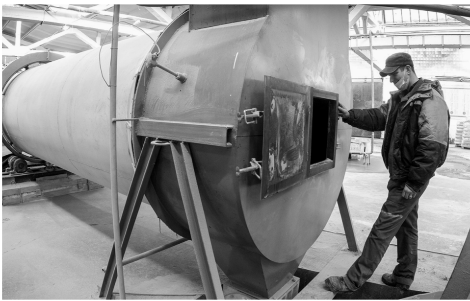
В этой барабанной сушилке отходы производства доводят до нужной влажности.

ет на стороне и самостоятельно заготавливает. Из березовых чураков на лущильных станках нарезают шпон – листы толщиной около 1,5 мм. Пока их в основном поставляет компания «Берёзка», находящаяся в Залесово.