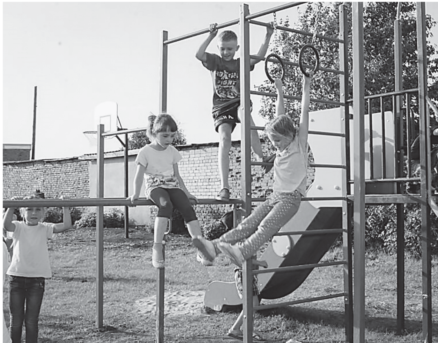
Спортивно-игровая площадка в Зелёной Дубраве появилась благодаря проекту поддержки местных инициатив.