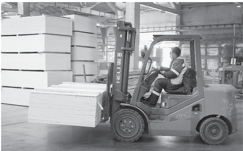
На складе готовой продукции работа механизирована.