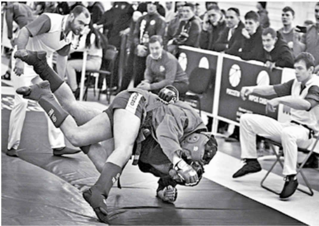
Боевое самбо – занятие мужское.