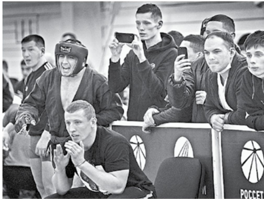
Тренеры, друзья и болельщики переживали за своих спортсменов.