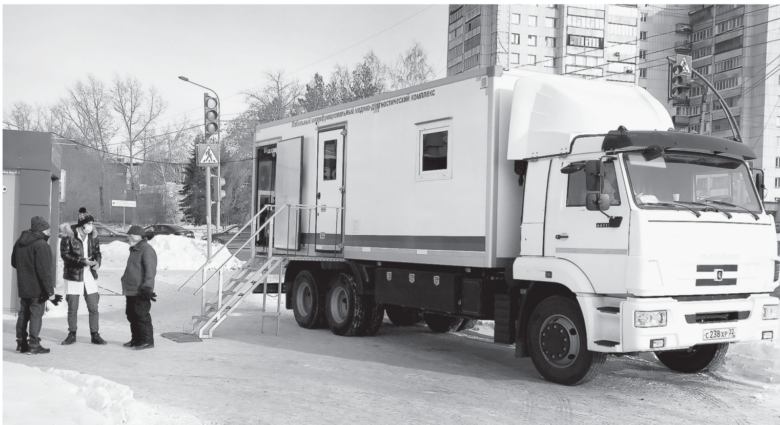
Так выглядит пункт вакцинации на колесах.