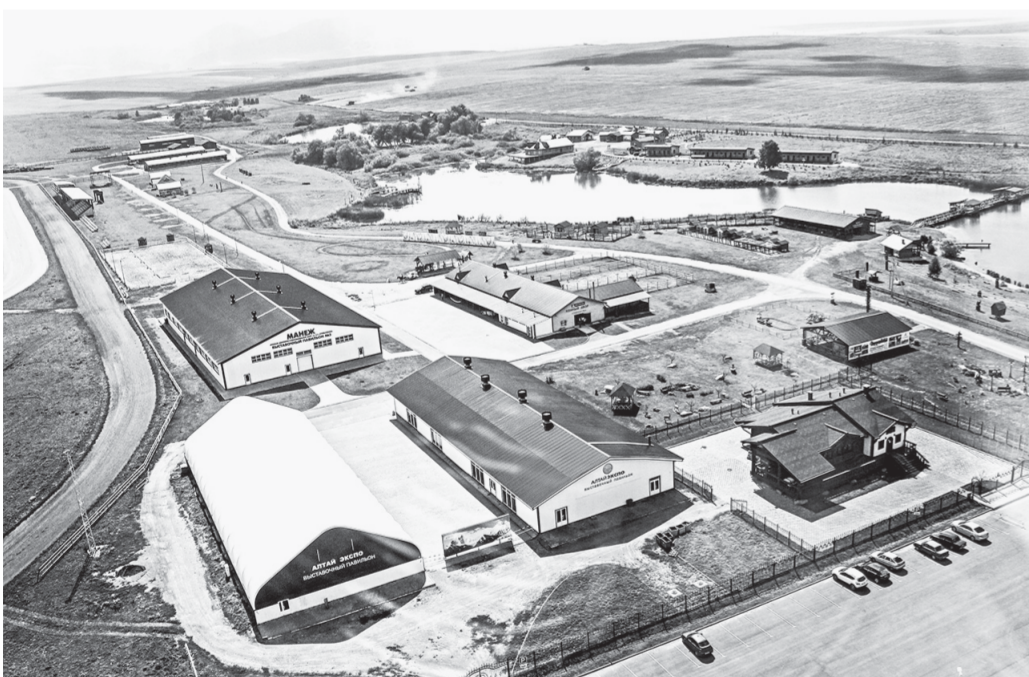
Площадка предприятия очень внушительная.

«Сибирское подворье» полностью переоборудовали под сельхозпредприятие.