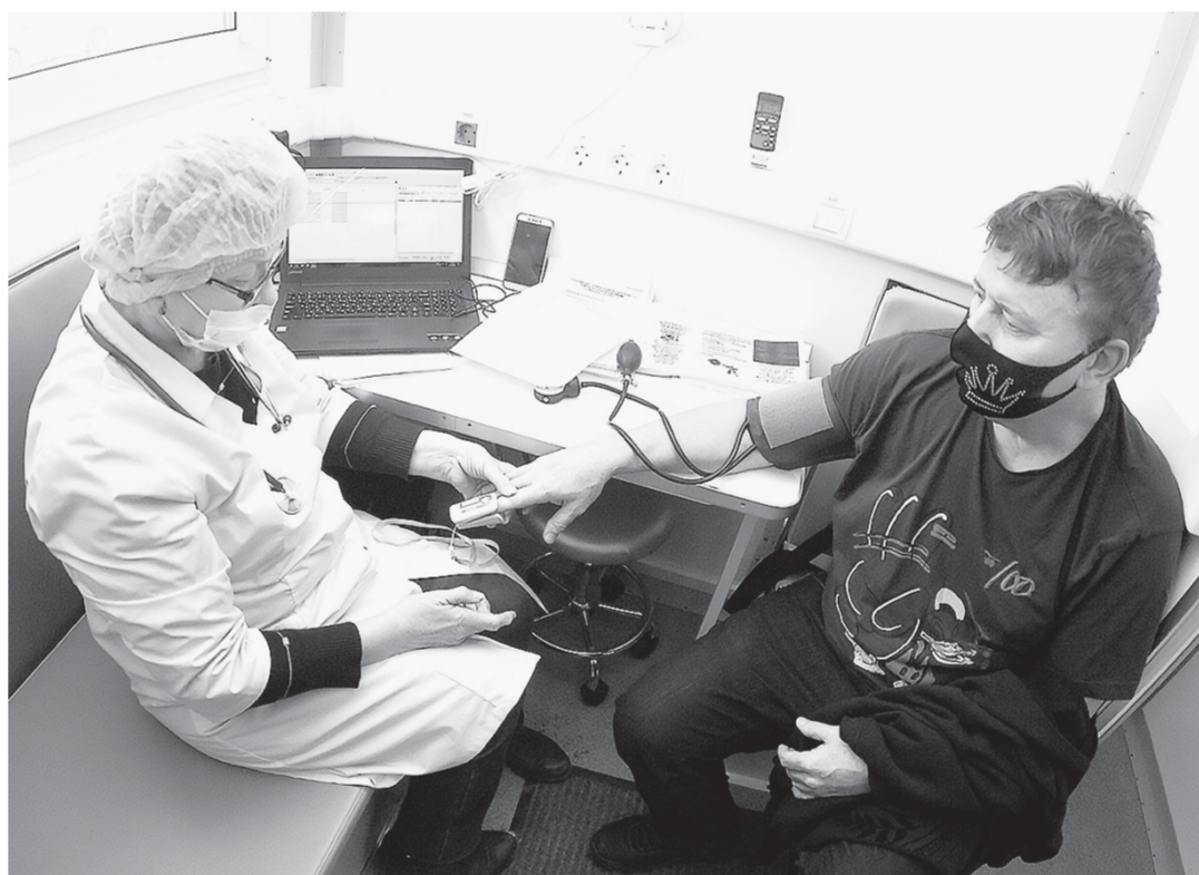
Перед прививкой обязательно обследование.