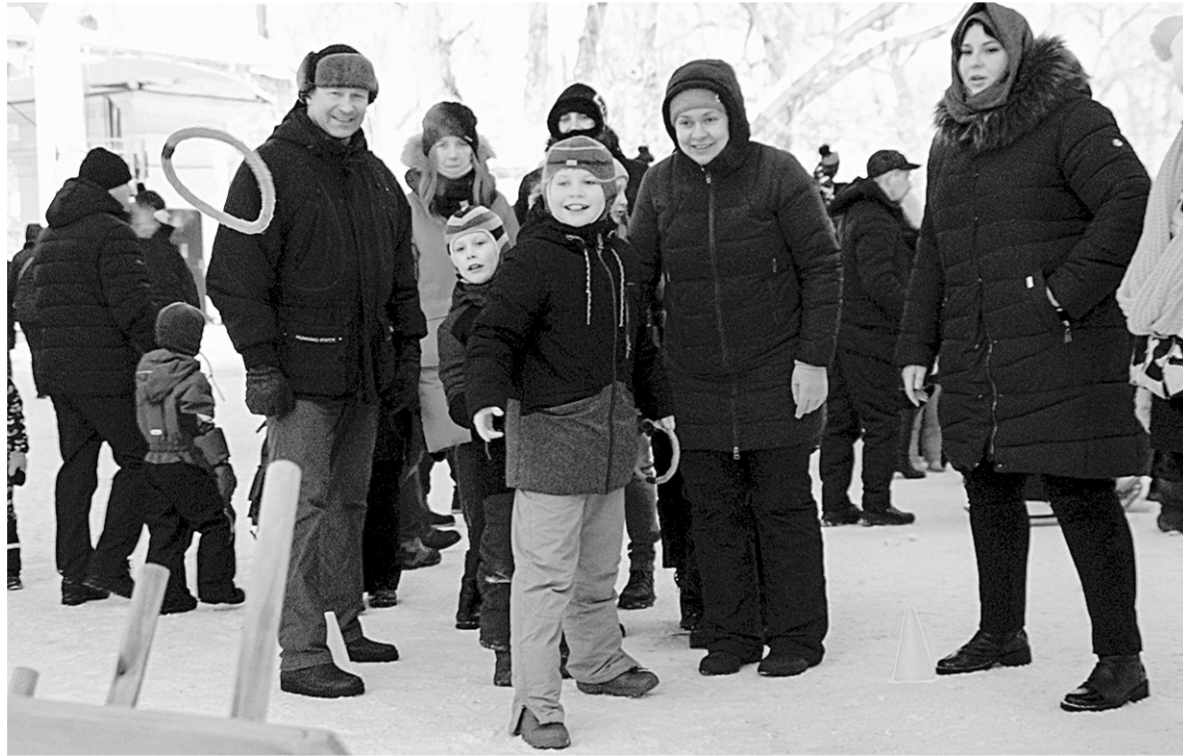
Игра в японское лассо.