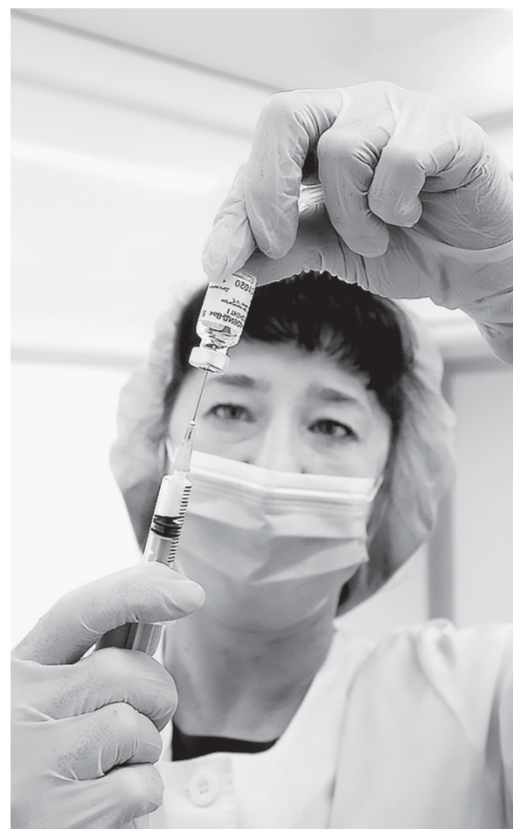
Одной ампулы хватает на пятерых.