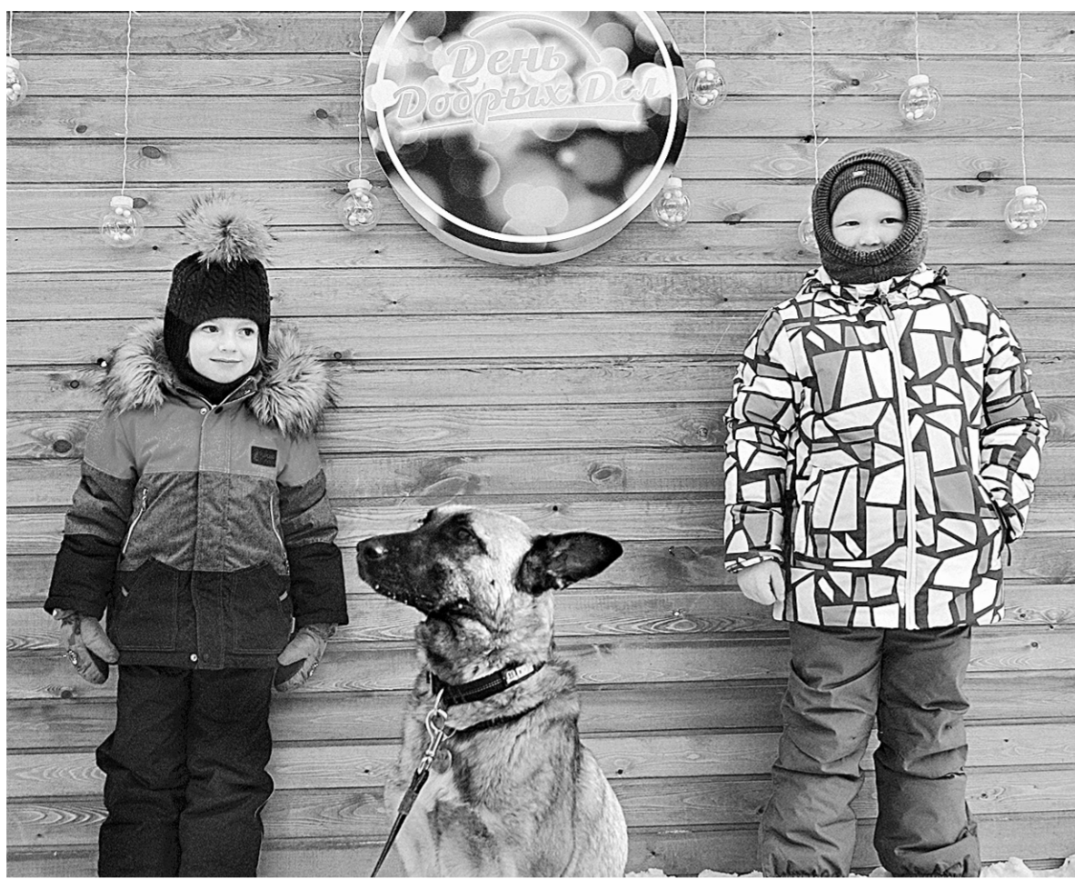
Благотворительное фото с собаками.

«Каждый желающий может подойти, сделать фото и пожертво-