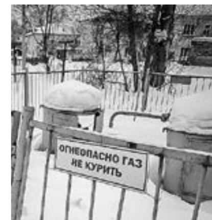
Кто должен чистить подходы?