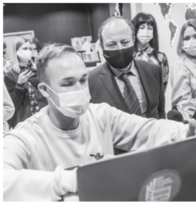
Прием заявок начался.