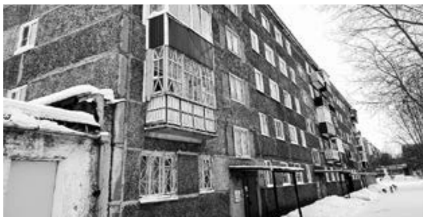
Многострадальные дома на улице Молодёжной.

В районе в это время продолжают искать ответственных. Администрация отправила технику на расчистку подъездных путей ко всем без исключения групповым газовым установкам.