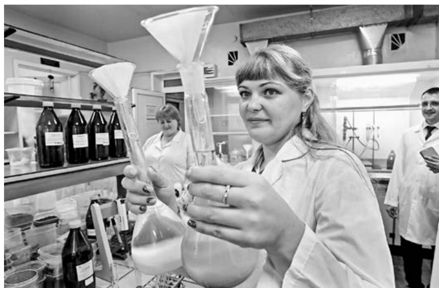
Специалисты проводят ежегодно более 33 миллионов лечебно-профилактических исследований.

В 2019 году заболевание бешенством обнаружено в 20 пунктах. Сейчас в связи с данным заболеванием вызывает тревогу только Чарышский район. В 2020 году