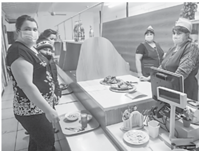
В столовой Новичихинского райпо.

В этом году пятеро спелых школьниц из районного центра