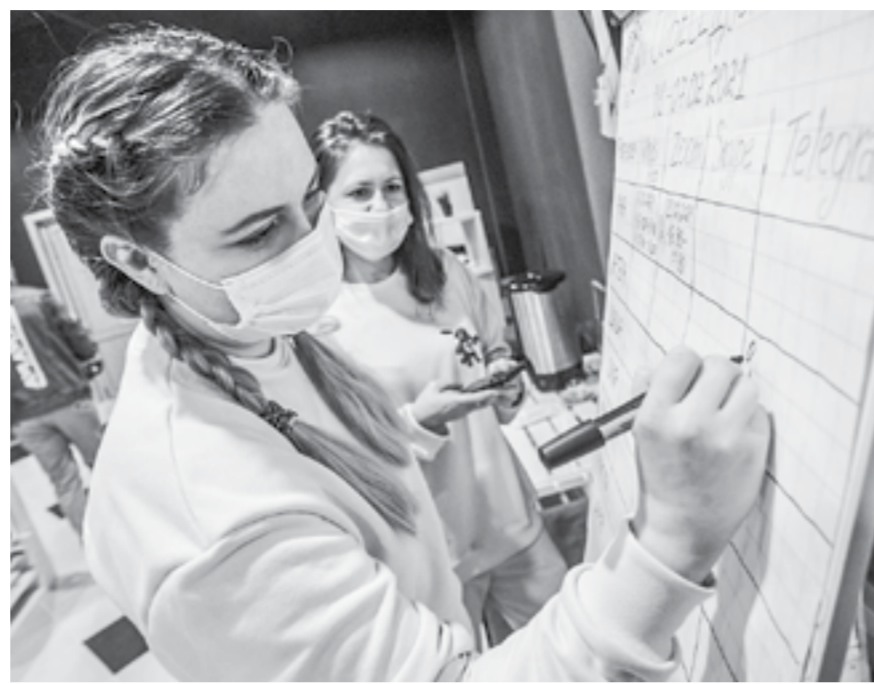
Тимлидеры составляют рабочее расписание.