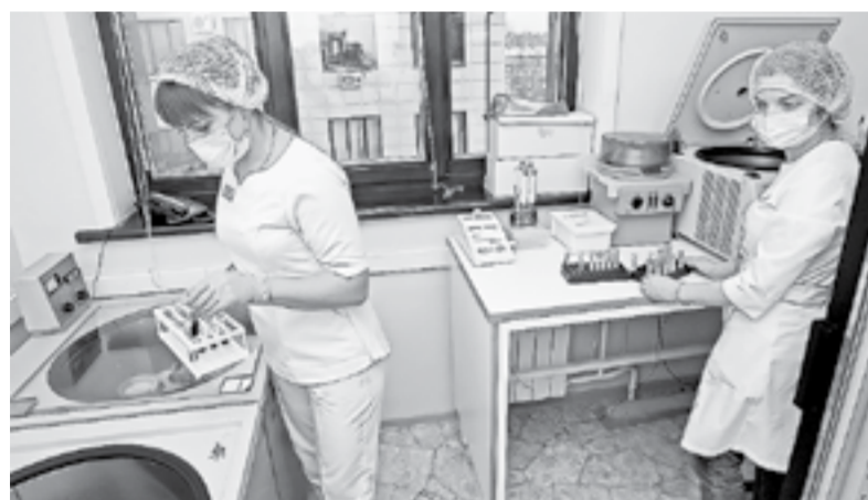
В лаборатории преимущественно работает молодежь.