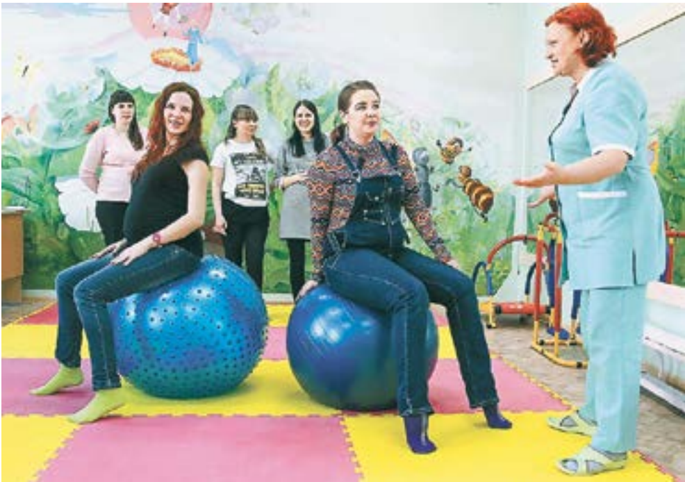
Вот так выглядели занятия в «доковидные» времена.