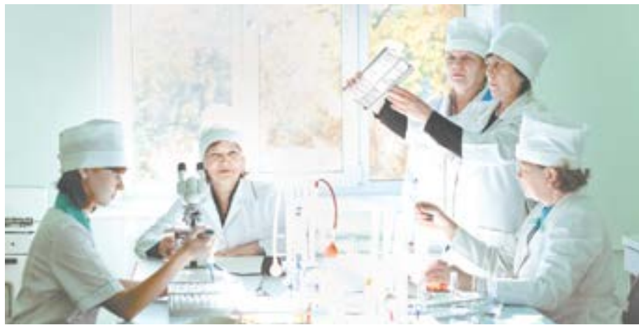
Проведение лабораторных исследований в КГБУ «АКВЦ».

В 1971 году Алтайская краевая лаборатория получила новое здание – на ул. Шевченко, 160. С тех пор количество отделов выросло, их техническое оснащение позволяет проводить широкий спектр исследований.