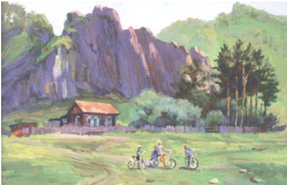
«Дом у скалы».