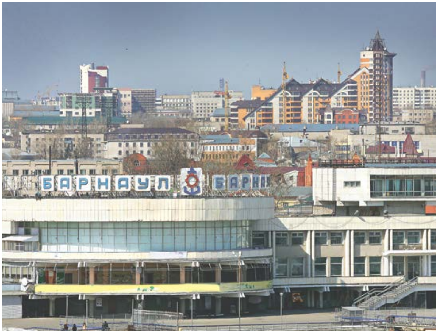
Общественность и специалисты спорят об облике многих знаковых мест, в том числе речного вокзала.