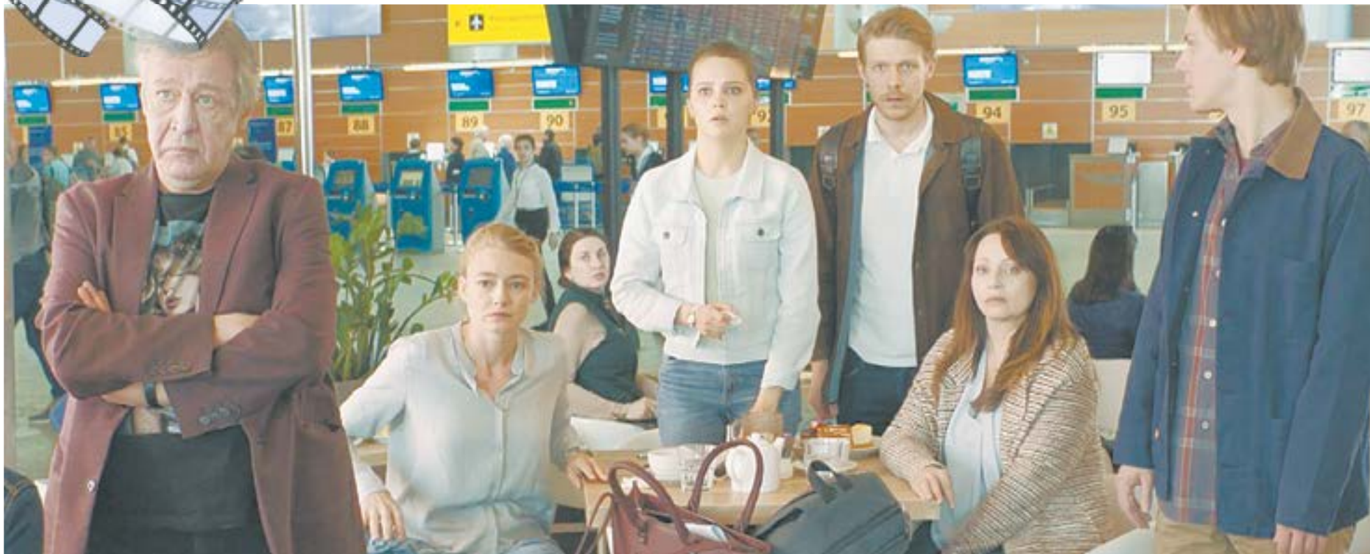
Главные герои сериала опоздали на самолет, потерпевший крушение, но счастья им это не принесло.

На этой неделе на канале «ТНТ» и онлайн-сервисе Premier стартовал сериал «Полет» сценариста и режиссера Петра Тодоровского-младшего – сына Валерия Тодоровского и внука того самого Петра Тодоровского. Удивительный случай, но после двух 45-минутных серий, вышедших к моменту сдачи этого текста в печать, о новинке все еще трудно сказать что-то определенное.