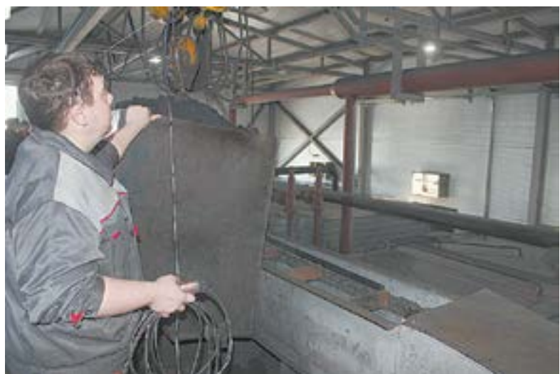
Загрузка угля механизирована.