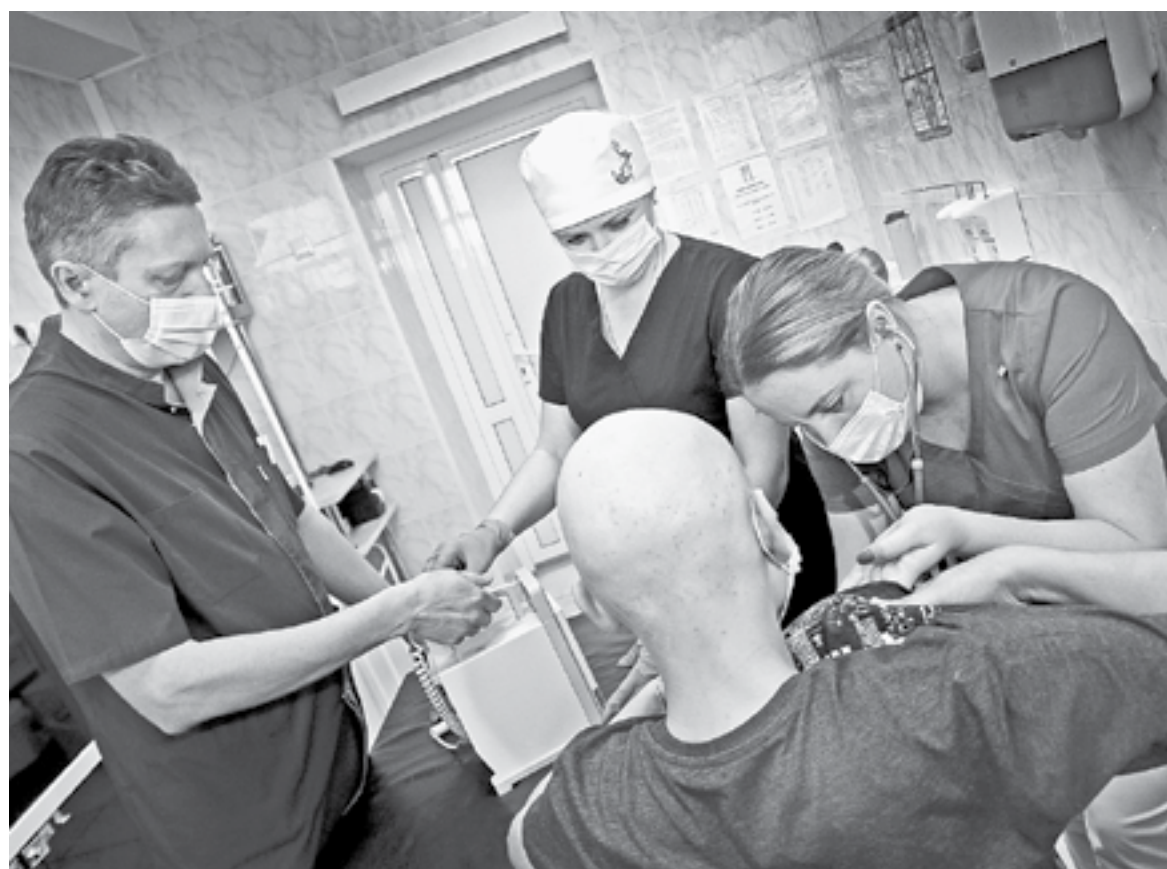
В процедурном кабинете.