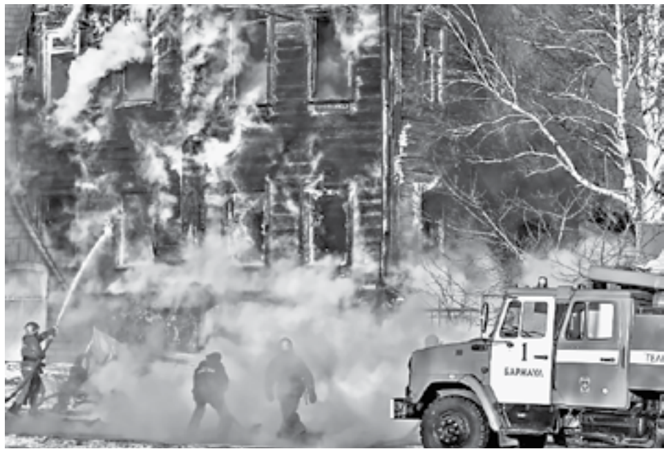
...но иногда огонь выходит из-под контроля.