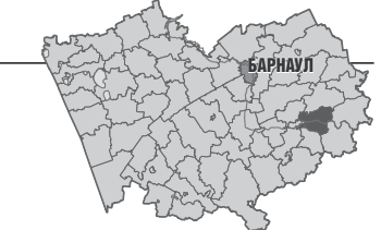
Подготовила Тамара ПОПОВА

В результате этого зачастую размер доходов семей с детьми-инвалидами с учетом таких компенсаций превышает величину среднедушевого дохода, позволяющего относить их к категории малоимущих и имеющих право на получение мер господдержки. Поскольку проблема коснулась наименее защищенных слоев населения, уполномоченный по правам ребенка в Алтайском крае подготовил обращение к уполномоченному при Президенте РФ по правам ребенка о возможности внесения предложения об изменении порядка подсчета доходов таких семей, чтобы при расчете среднедушевого дохода для получения мер государственной поддержки не учитывались бы пенсии по инвалидности и компенсации по уходу за детьми-инвалидами.