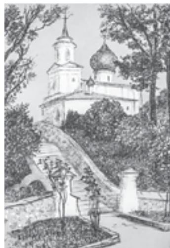
Автолитография Бориса Ермолаева.