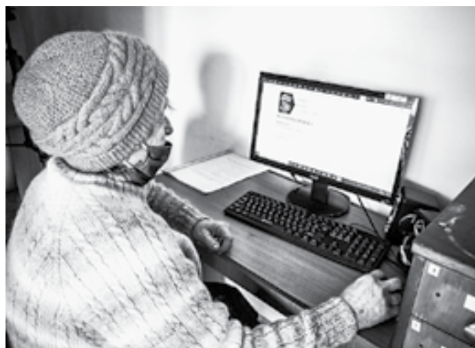
Компьютеры востребованы и у старшего поколения.

Компьютеризация этих учреждений культуры – насущная тема. В работу библиотечно-информационных систем вводятся цифровые технологии. Часть сельских библиотек Рубцовского района (а всего их 19) до недавнего времени имела лишь по одному компьютеру, а скорость Интернета не позволяла никакой критики. Ситуация кардинально изменилась с ноября прошлого года. – На оснащение оргтехники всех библиотек из местного бюджета было выделено 500 тысяч рублей, на которые