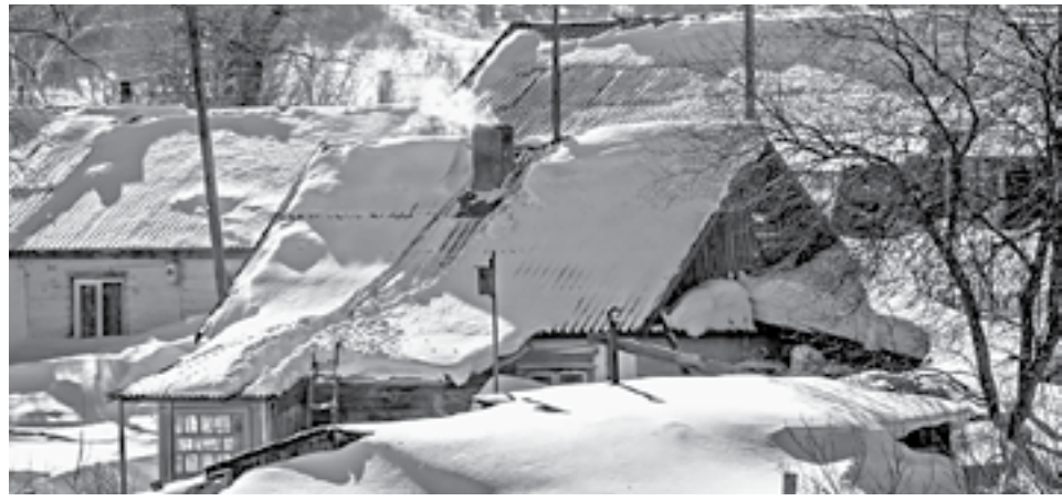
В сельских домах живое тепло...