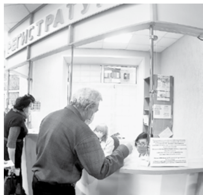
Записываться на иммунизацию призывают и пожилых.

Сейчас в Алтайском крае прививают только одной вакциной.