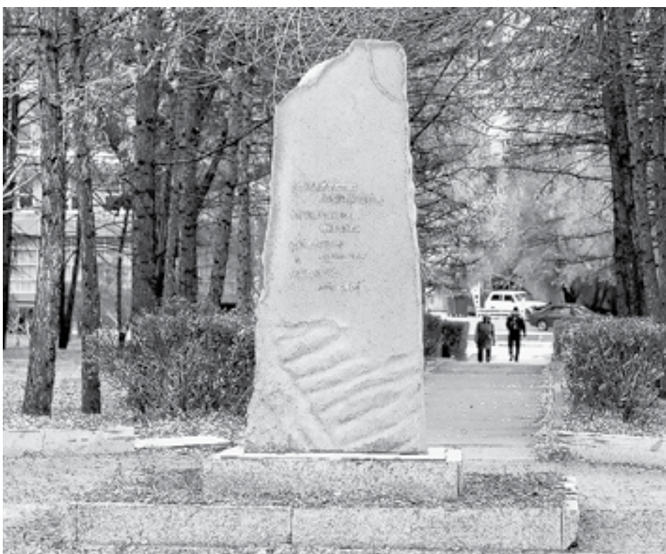
Пока в парке «Зелёный сквер» – символический камень.

Такой монумент, посвященный женщине-матери, которая кормила и одевала фронт, вырастила целое поколение детей войны, необходим Барнаулу как столице Алтайского края. Он увековечит память о