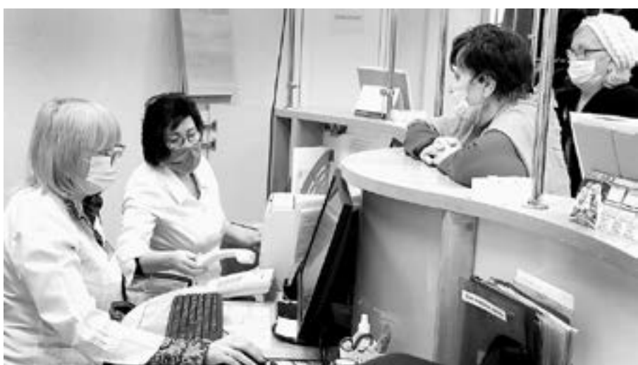
В регистратуре оперативно решают все вопросы.

– По информации, которая сегодня учитывается органами надзора, ни у