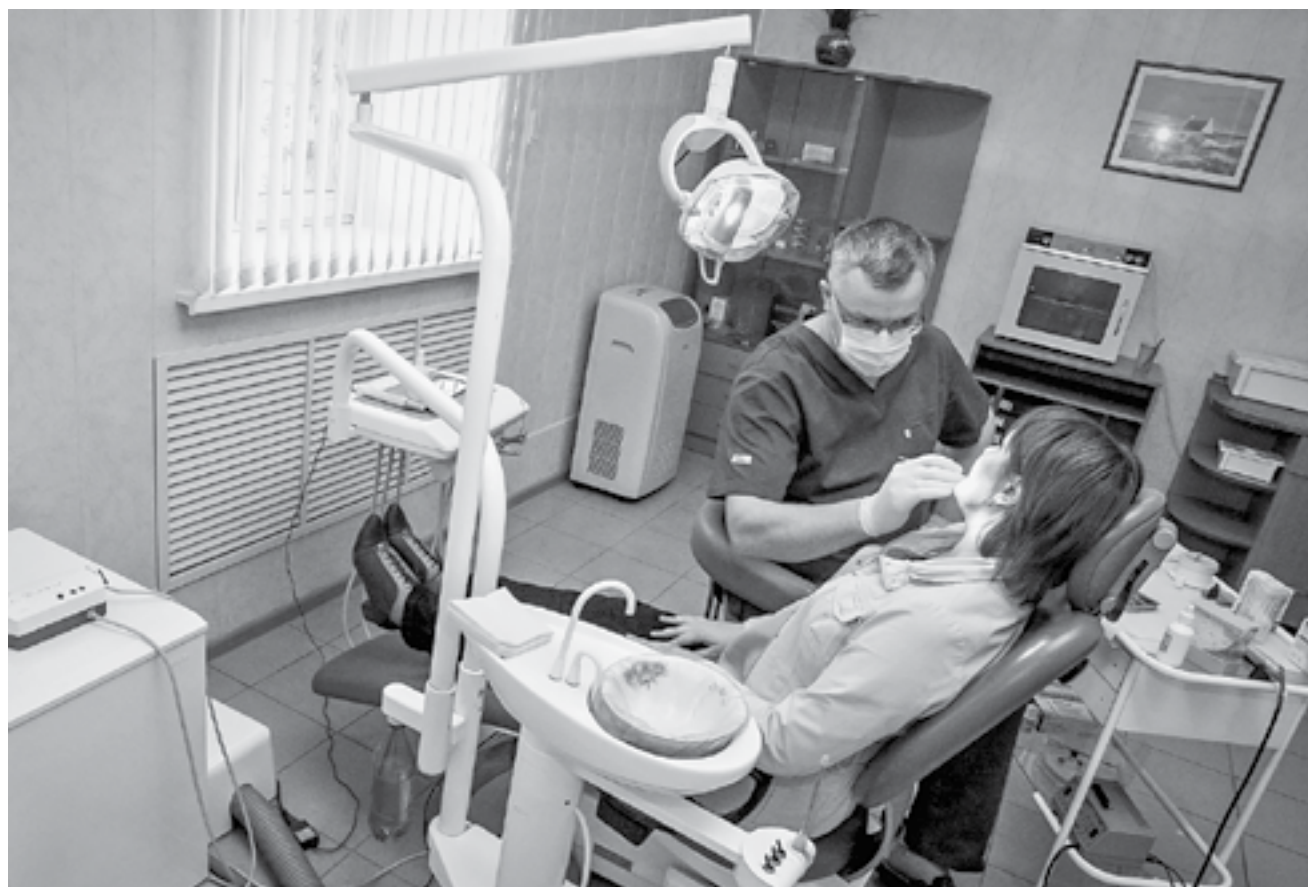
Теперь можно взять патент на занятие медицинской деятельностью, если есть соответствующая лицензия.

В прошлом году из Алтайского фонда микрозаймов был выдан 1 млрд рублей на инвестиционные цели и в рамках программы ускоренного экономического развития края. А региональная гарантийная организация предоставила поручительство суммарно более чем на 500 млн, что позволило предпринимателям, у которых не хватало залогов, привлечь банковских кредитов на 1,8 млрд рублей. При этом бизнесмены аккуратно рассчитываются по взятым обязательствам.