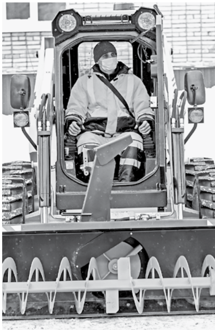
Новые машины улучшат качество содержания всей улично-дорожной сети Барнаула.