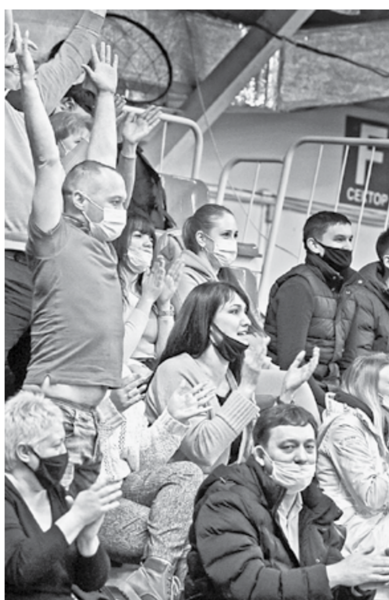
Поддержка болельщиков придала команде дополнительные силы.

– В концовке мы агрессивнее сыграли в защите и хладнокровнее в нападении, удалось воплотить все тренерские задумки, – сказал самый результативный