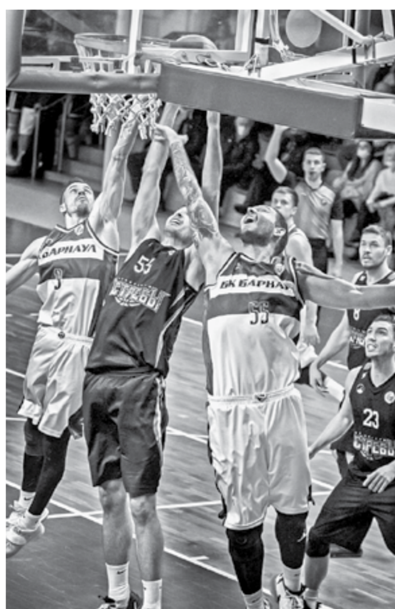
«Барнаул» и «Чебоксарские Ястребы» выдали огненный матч.

Евгений ЛИМАНСКИЙ