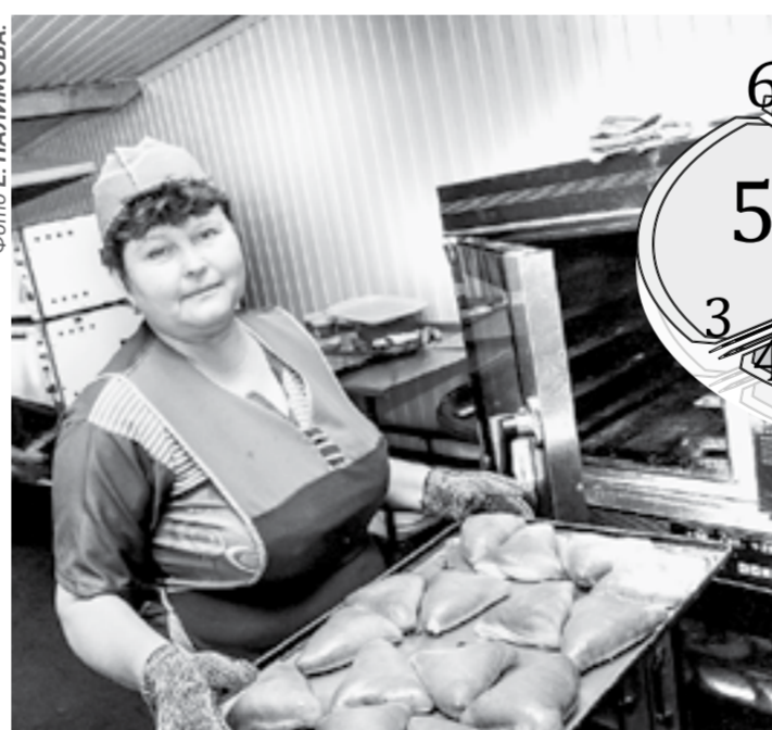
Уход предприятий малого бизнеса с ЕНВД не станет для них ровным событием, считают власти.