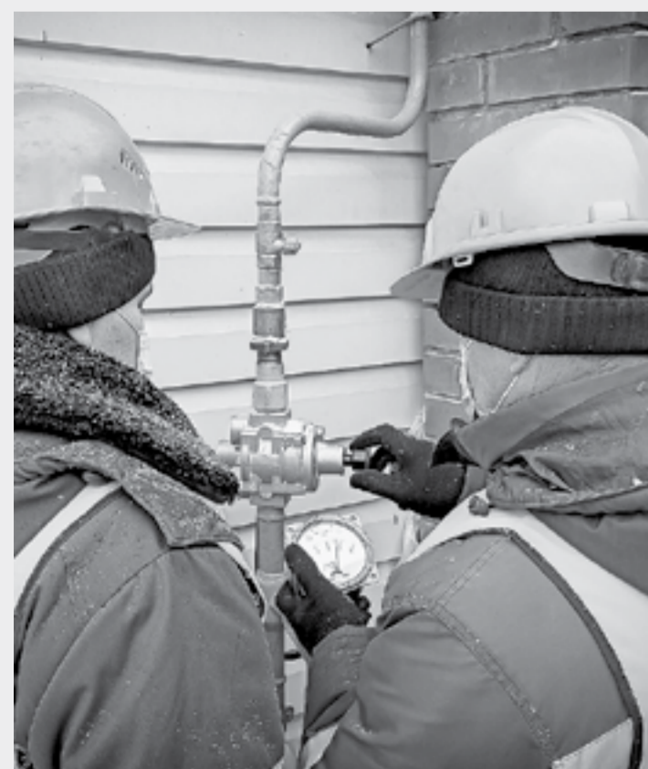
Последние проверки перед запуском топлива в дом.