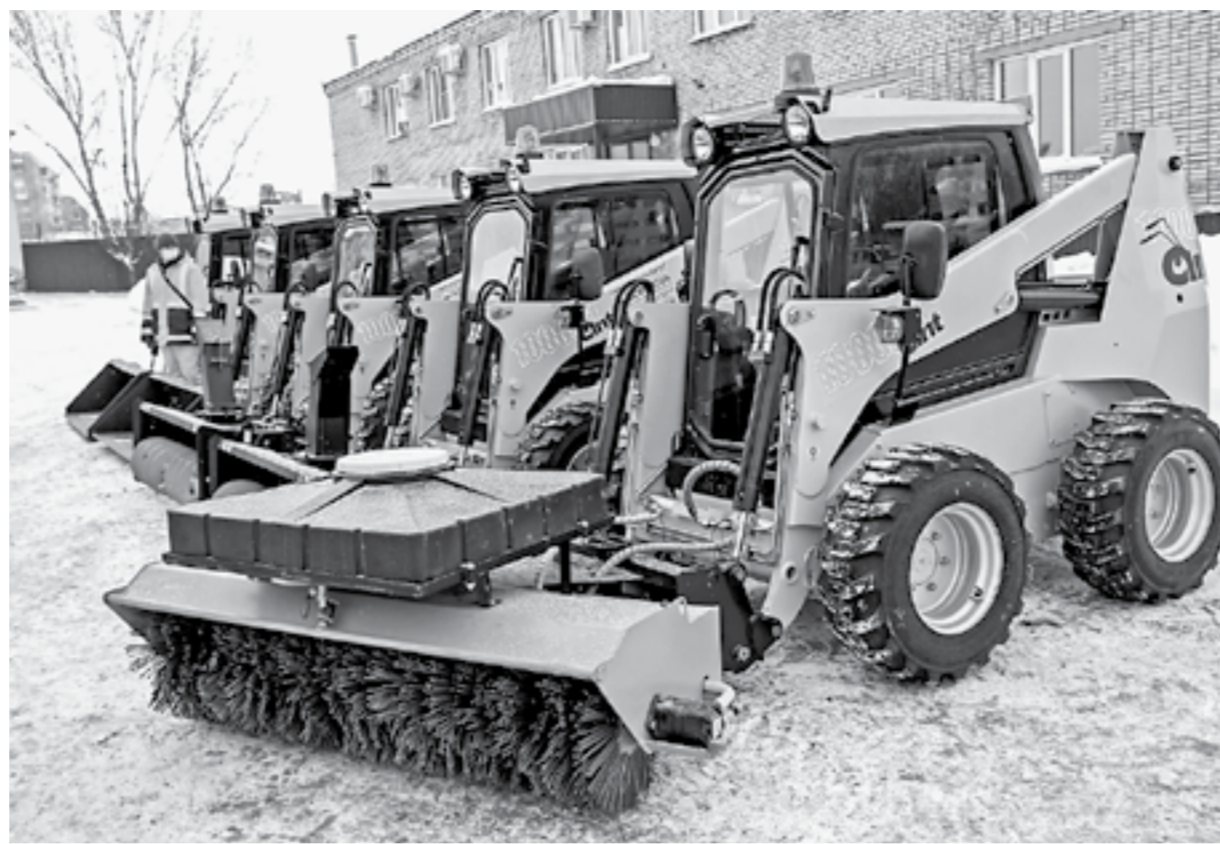
Эти минипогрузчики будут очищать тротуары.