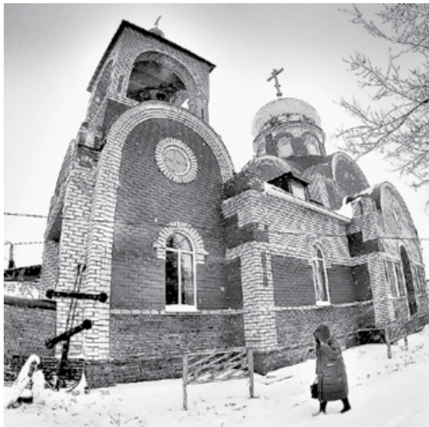
Храм в Сорокине стал духовным центром села.