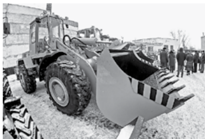
Глава города дал поручение в ближайшие дни вывести новую технику на линию.