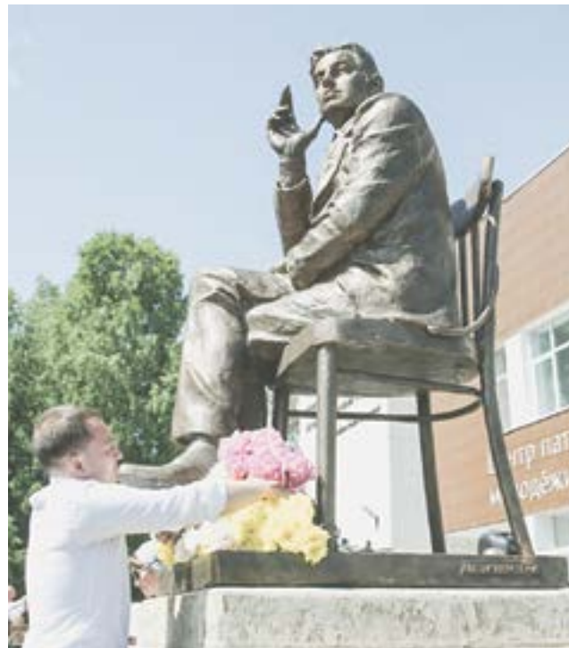
У Мемориального музея Роберта Рождественского.

В 2020 году были реализованы мероприятия национального проекта «Культура», отремонтированы десятки объектов культуры и построены новые.