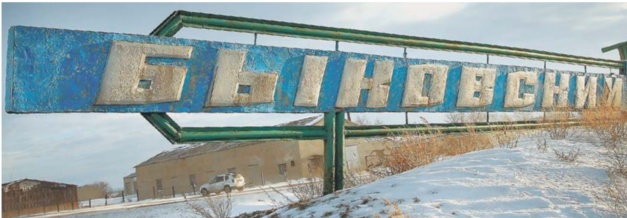
Знаменитая стела на въезде.

Как и 12 лет назад, в последних числах декабря «АП» отправилась в командировку в село с символичным в наступающем году, звонким и сильным именем – Быково.