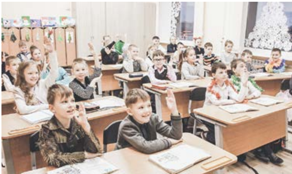
Ребятам из 2 «А» новая школа очень нравится.