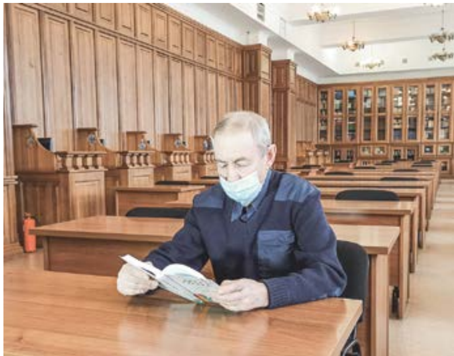
В читальном зале бийской библиотеки имени Шукшина.