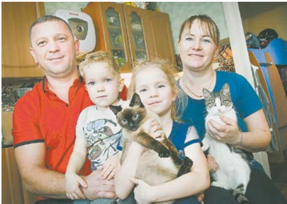
Быковы из Быкова.