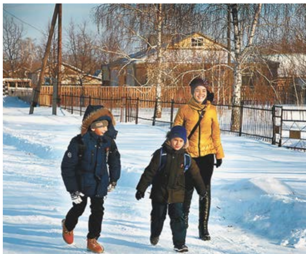
На улицах села.

Опытнейший директор одного из образцовых совхозов района сегодня вспоминает, как в кризисные девяностые пришлось отказаться от животноводства («А ведь спецхоз был, бычков доращивали, до 6 тысяч поголовье доходило, мясо сдавали и в Кемерово, и Новосибирск, не говоря что внутри края»), совхоз переключился сугубо на растениеводство. Выращивают практически весь набор культур – кроме зерновых, привычных ячменя и овса, еще и чечевицу,