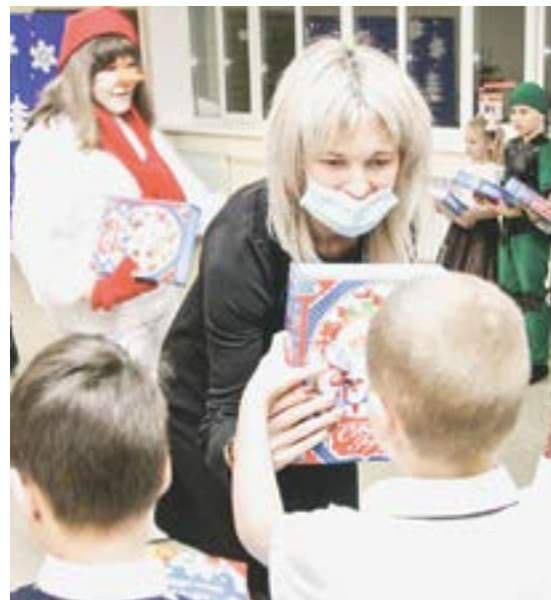
Подарки получать всегда радостно.

Очень желанный и долгожданный подарок получили в конце года педагоги и ученики каменского лицея № 4. Самое большое в Камне-на-Оби образовательное учреждение открыло второй корпус, в котором со второй четверти занимаются 317 ребят с первого по третий класс. Когда можно будет отказаться от ступенчатого расписания уроков, введенного из-за пандемии, все лицеисты наконец-то смогут учиться в одну смену.