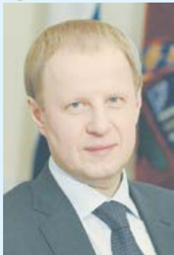
Губернатор Алтайского края В. ТОМЕНКО.

С уважением, главный редактор газеты «Алтайская правда» Г. Г. РООР