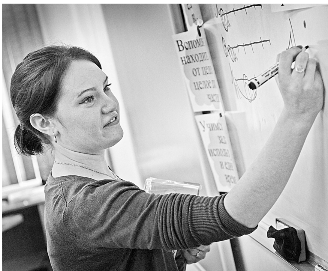
Педагоги должны видеть, что общество на их стороне.