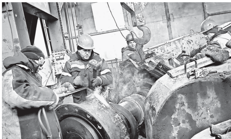
Экипаж драги ведет ремонт черпакового барабана.