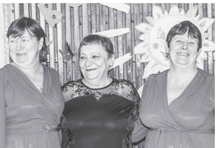
Вокальная группа «Ивушка» в новых концертных платьях.