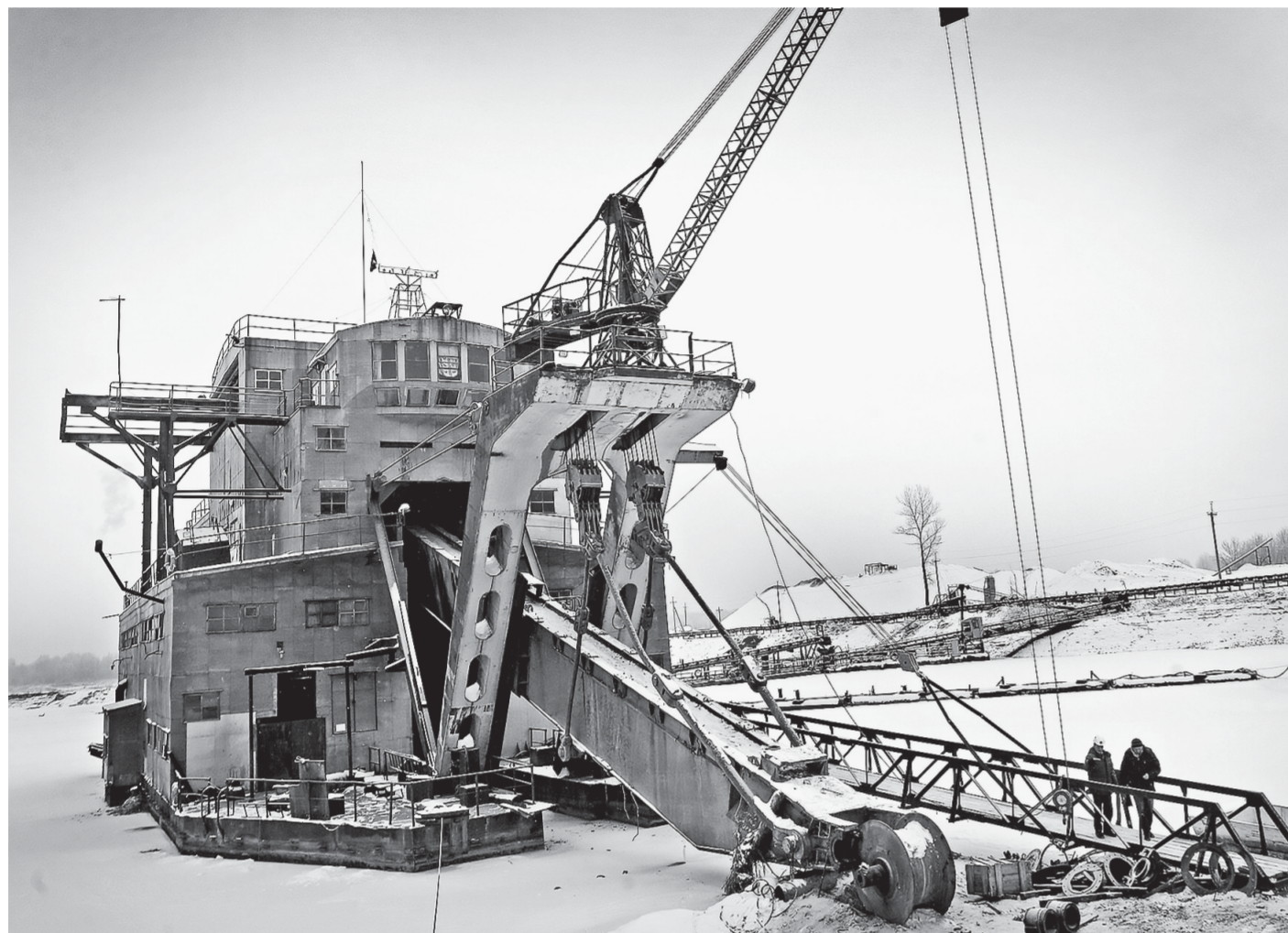
Летом эта драга за минуту добывает столько гравия, что его хватает на целый грузовик.