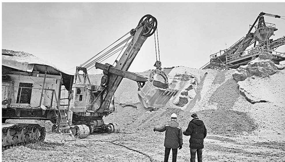
Электрический экскаватор грузит гравий на переработку.