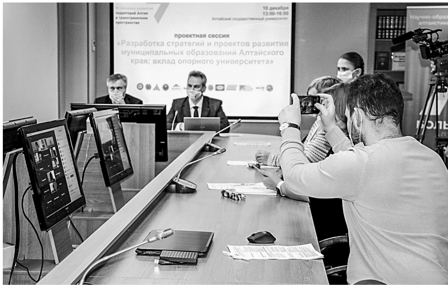
Проектная сессия в опорном вузе прошла в смешанном дистанционно-очном формате.