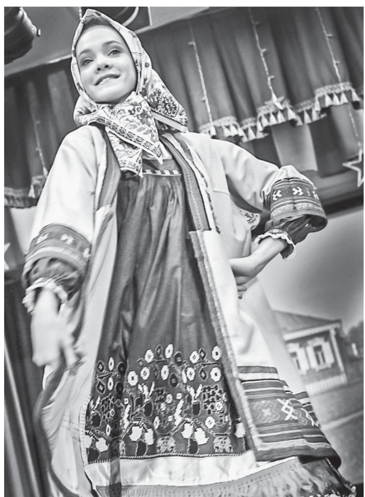
Таких образцам позавидует любой этнографический музей.

– Все крутили пальцем у виска: 22 года парню, а он тряпки собирает, – вспоминает собиратель. – Лет через двадцать это уже стало востребовано в стране. В советское время, как говорит Глебушкин, народный костюм был вначале запрещен,