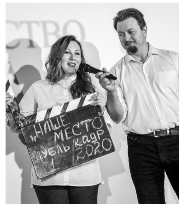
Новое креативное пространство объединит ярких, творческих людей.

В Каменском районе создана площадка для неформального общения активных творческих ребят. Но авторы проекта уверены: новое креативное пространство в кинотеатре «Звезда» станет центром притяжения людей разных поколений.