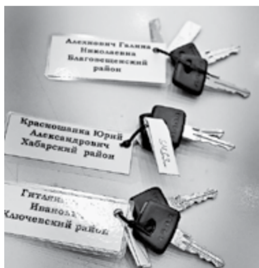
Ключи от машин.