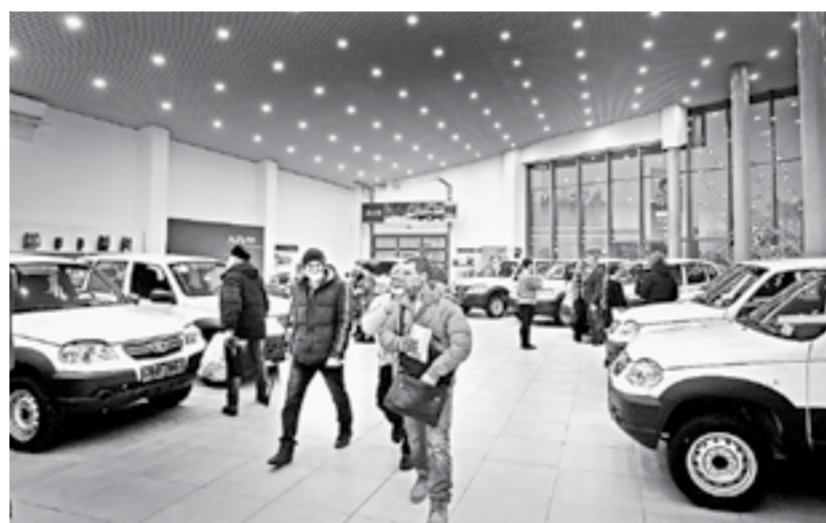
Передовики знакомятся со своими автомобилями.