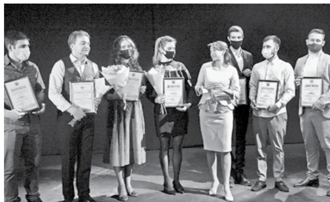
Лауреаты – на сцене.

На этой неделе были вручены губернаторские премии имени Валерия Золотухина в области театрального искусства.