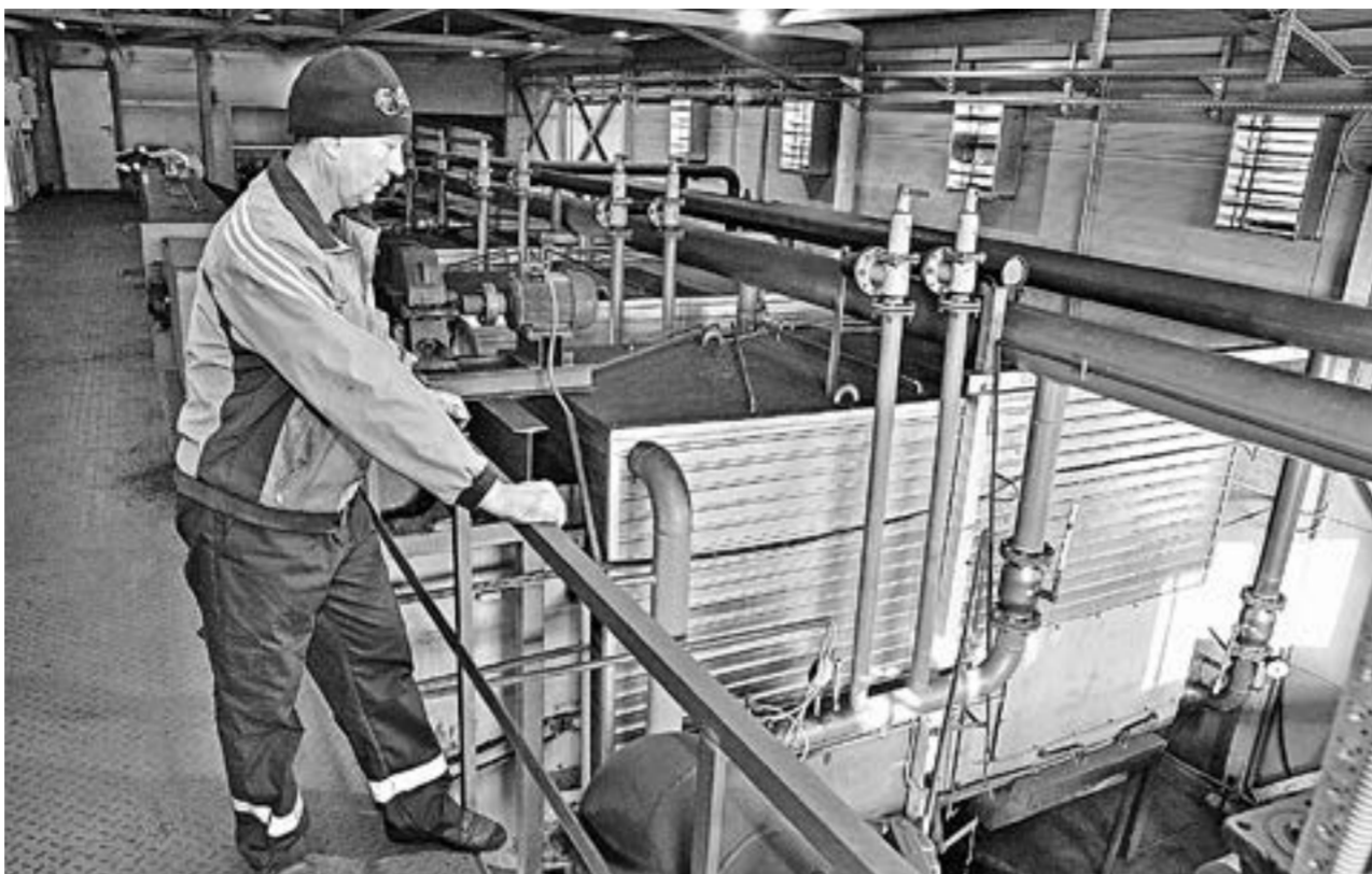
В центральной котельной села Поселиха к отопительному сезону хорошо подготовились.

Теплосетевой комплекс в Алтайском крае очень большой и изношенный. У нас много сетей и более 140 предприятий, занимающихся теплоснабжением. Чтобы их поддер-