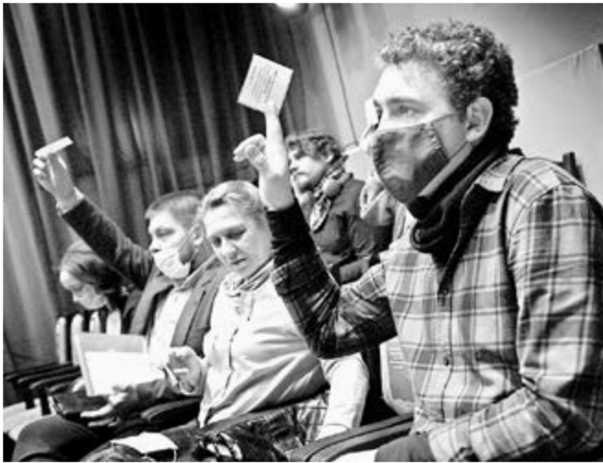
В Барнауле прошла отчетно-выборная конференция краевого отделения СТД РФ.