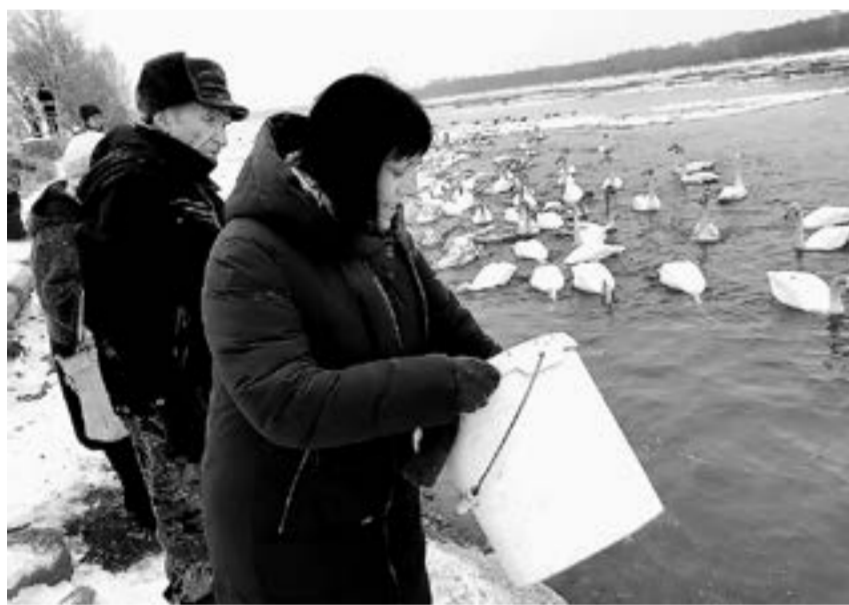
По два ведра норма утром и вечером – так и перезимуют.