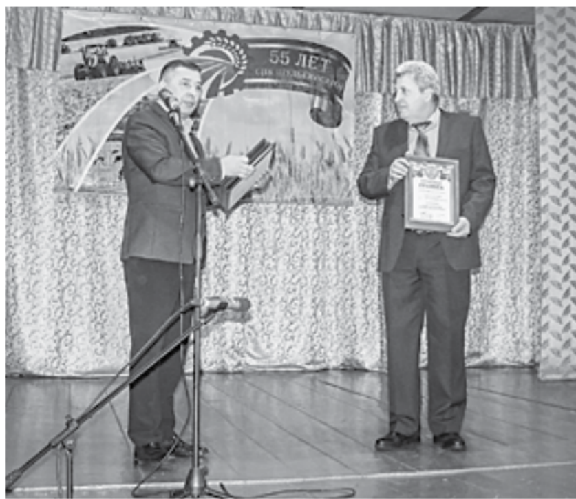
На торжестве, посвященном СПК «Шульгинский».

Надой на фуражную корову трехкратно вырос и составляет сейчас почти 5000 литров.