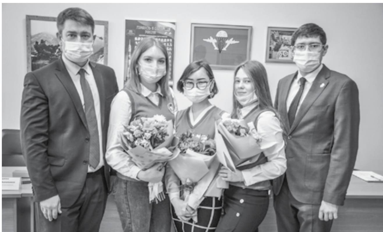
Победительницам конкурса вручили памятные подарки и цветы.