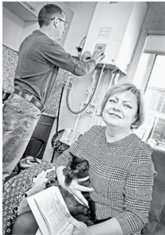
Даже в крепкие морозы в доме Лужных тепло.