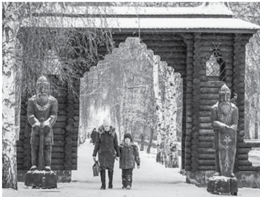
Мамонтовцы любуя свой сказочный городок.

– Изначально темы для деревенского городка обсуждались другие. Думали вырезать казаков, например, но образ этот для многих моих земляков довольно расплывча-