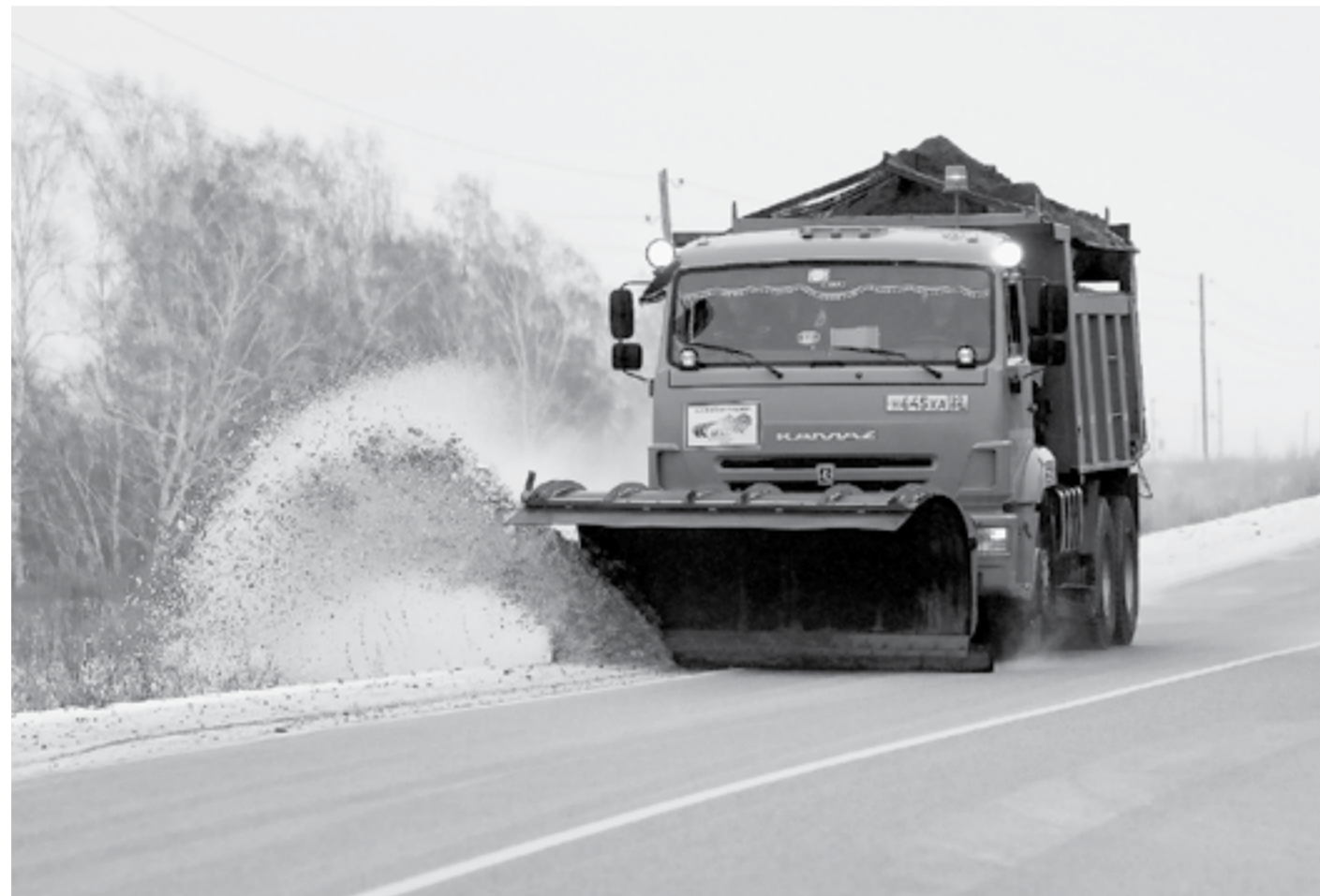
Основные силы брошены на борьбу со льдом.