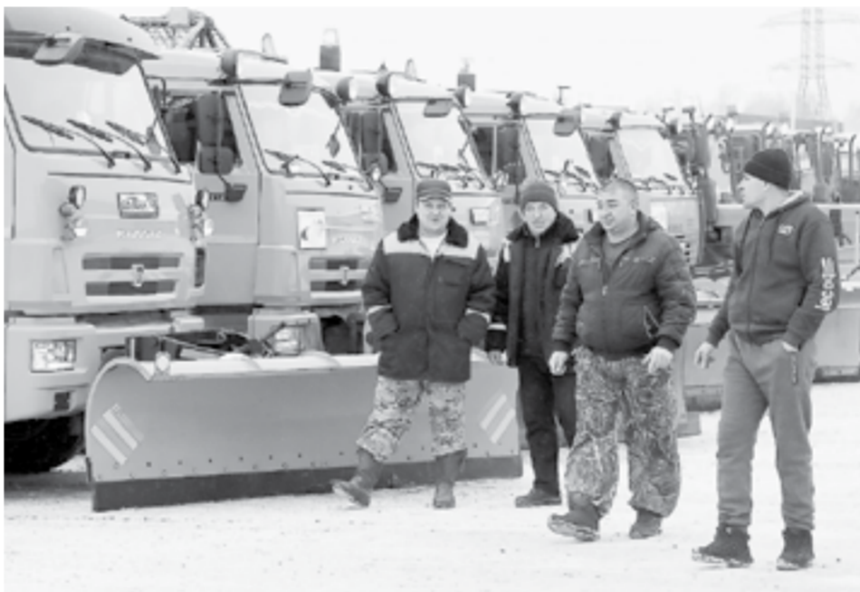
ДСУ задействует свыше 150 единиц снегоуборочной техники.