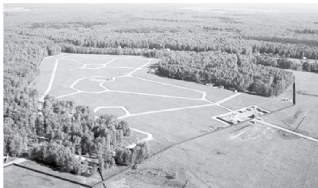
В 2021 году пройдет подготовка и проведение государственной кадастровой оценки в отношении всех земельных участков.

– В 2019 году на территории Алтайского края проведена государственная кадастровая оценка всех видов объектов капитального строительства, земельных участков категории земель сельскохозяйственного назначения, земельных участков категории земель промышленности