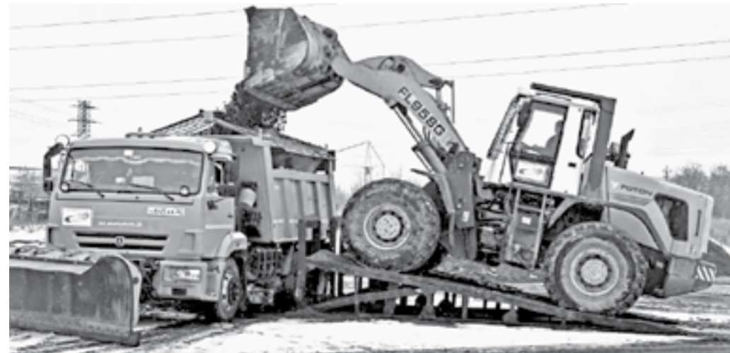
В крае заготовили 80 тысяч тонн противогололедных материалов.