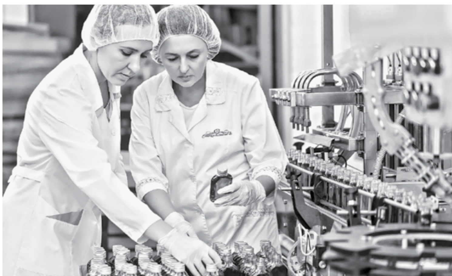
Линия холодного отжима кедрового масла компании «Специалист» работает на полную мощь.

История бренда довольно увлекательна. Компания выпускает медовые пряники по рецепту 1912 года змеиногор-