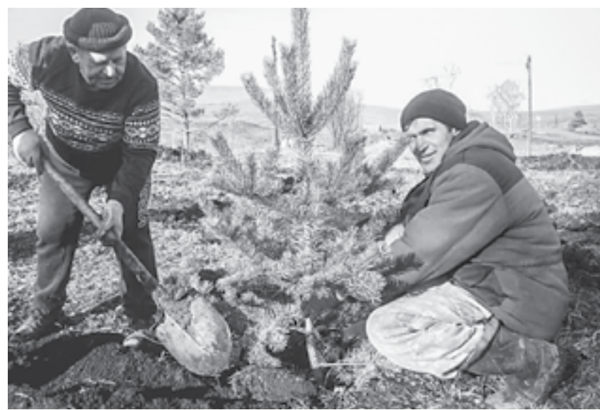
Жители Первомайского на реконструкции парка.