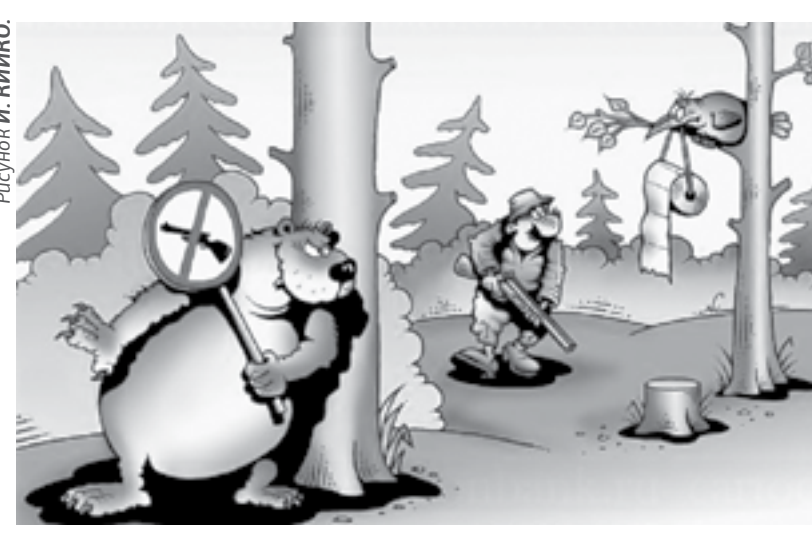
Рисунки И. НИКИНО.

Очередной жертвой интернет-мошенников стал 31-летний житель наукограда. На одной из страниц в социальной сети мужчину привлекло объявление о продаже смартфона. Цена телефона с учетом скидки составляла порядка 6 тысяч рублей. Это предложение показалось бийчанину привлекательным, и он перешел по ссылке, оформил заказ. Через некоторое время ему перезвонили