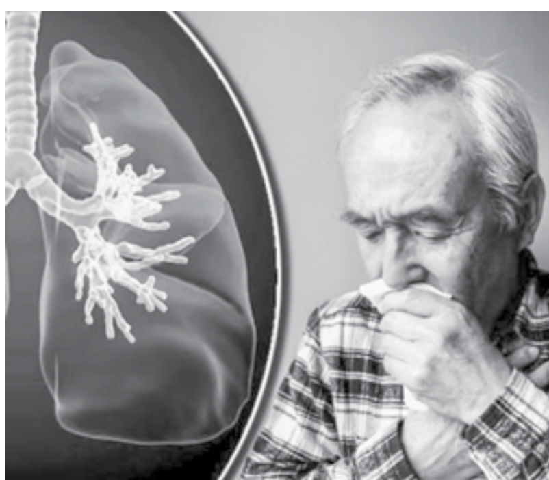
Пожилые – в группе риска.

В холодное время года обостряется хроническая обструктивная болезнь легких (ХОБЛ). Это заболевание, для которого свойственно острое воздействие воздуха. А поскольку коронавирус оказывает неблагоприятное воздействие чаще всего именно на органы дыхания, то возрастает риск инфицирования.