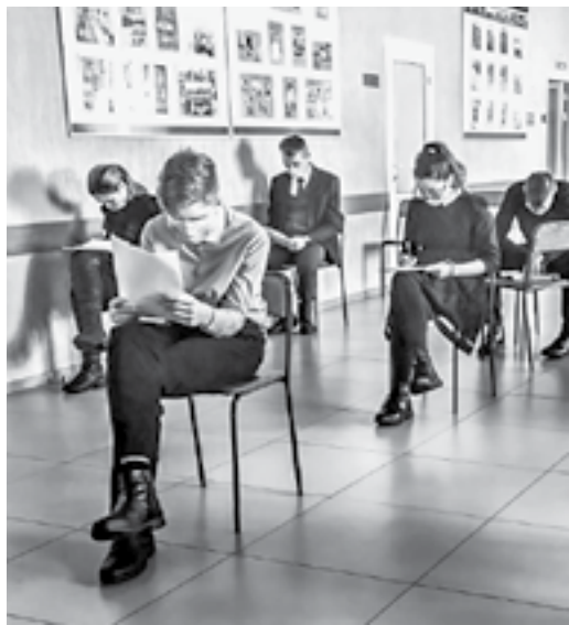
Количество участников было ограничено противоэпидемиологическими мерами.