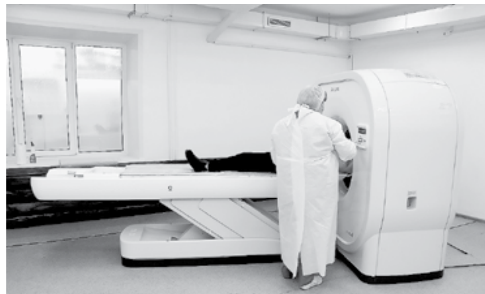
Новый аппарат не простаивает.

Компьютерный томограф в Алейске обеспечит оперативное высокоточное диагностирование больных восьми окрестных районов, включая Чарышский, Усть-Калманский и другие.