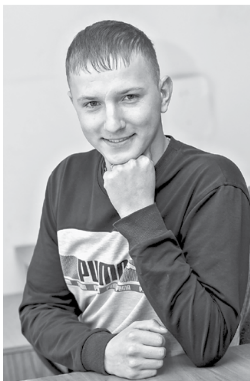
Юный герой в редакции «Алтайской правды».