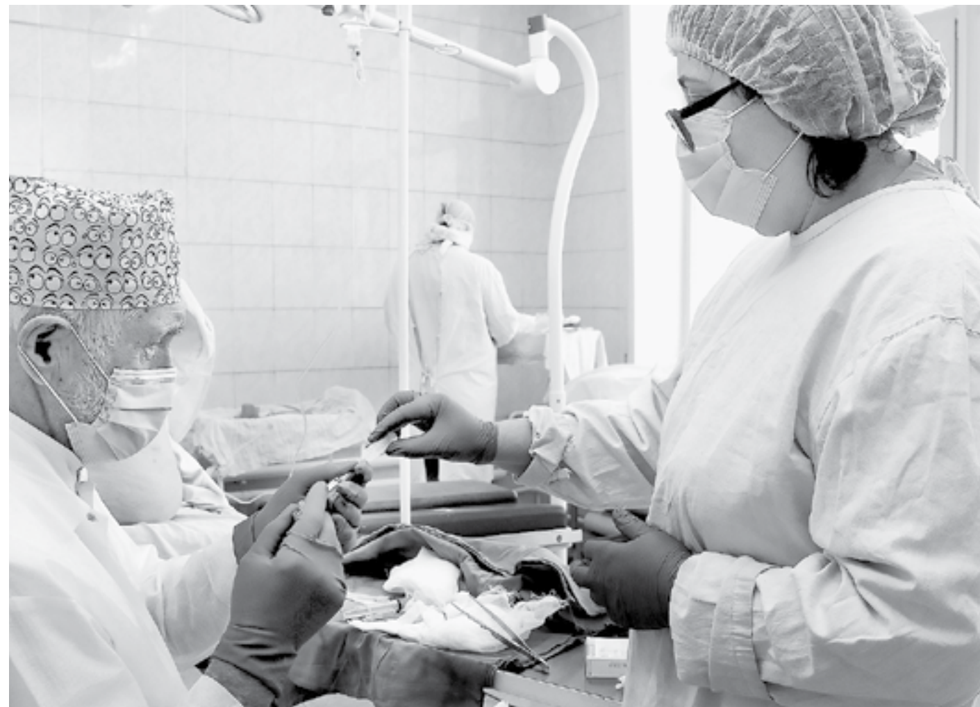
Идет подготовка к операции.