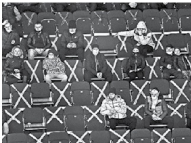
В шахматном порядке.