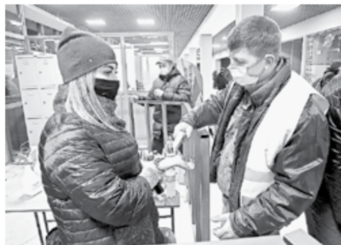
Измерение температуры обязательно.