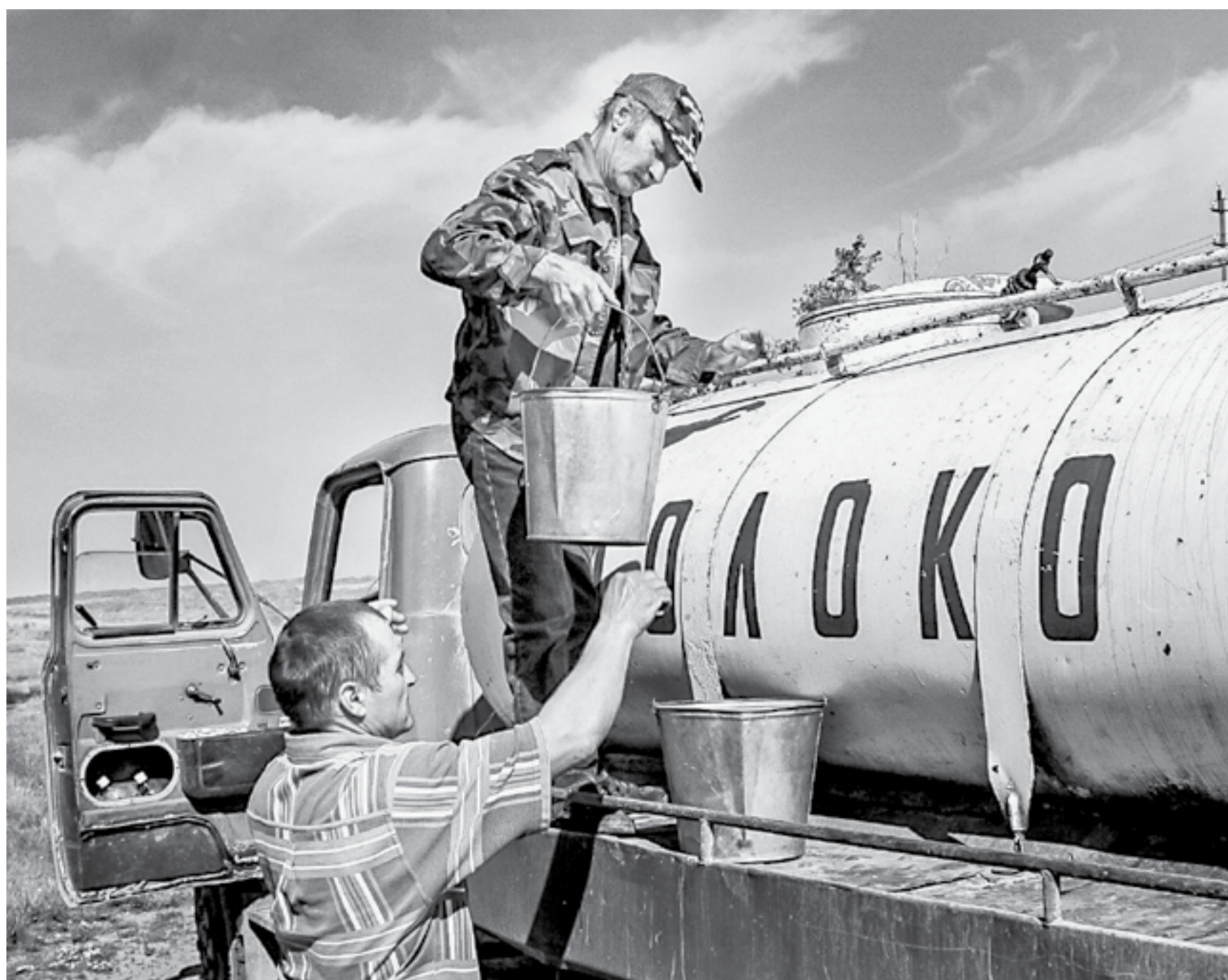
Фермеры и ЛПХ объединяются в кооперативы, чтобы реализовывать молоко дороже.

В следующем году увеличится поддержка алтайских фермеров и сельхозкооперативов в рамках нацпроекта, направленного на развитие малого и среднего предпринимательства.