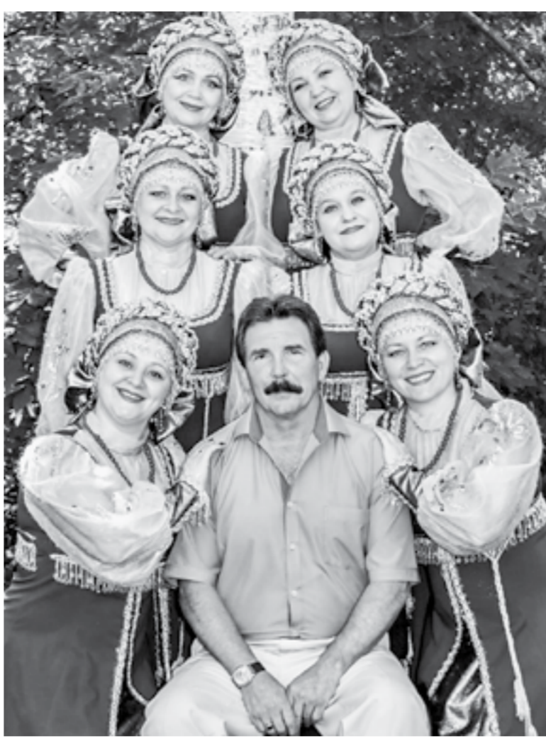
Ансамбль «Серебряна» получил звание заслуженного.