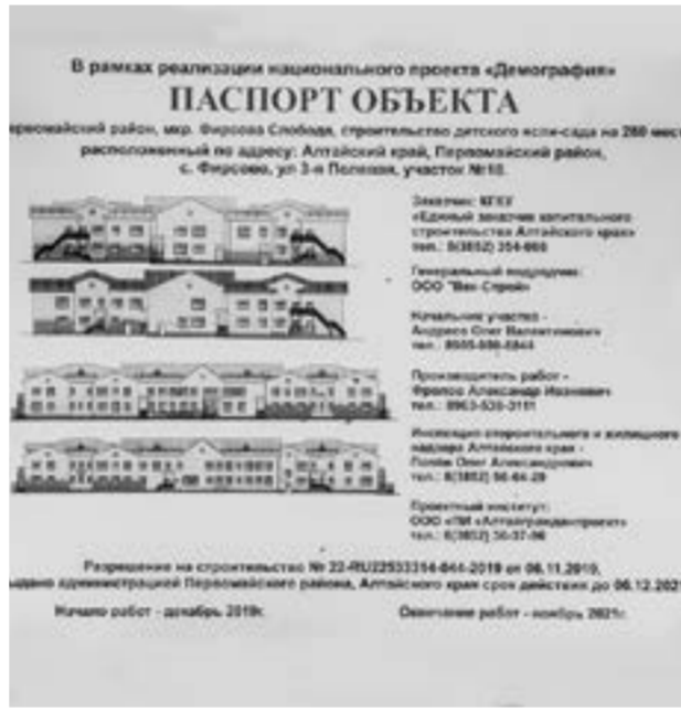
Вот таким будет новый объект.

Развитие инфраструктуры там, где полным ходом идет индивидуальная жилищная застройка, – тема особая. Как и у медали, у нее две стороны. Включение пригородных сельских