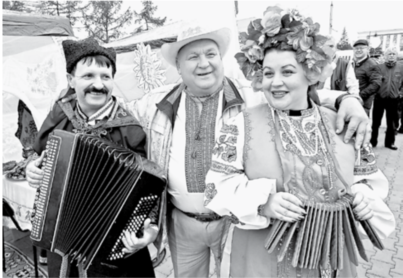
«Ты ж мене пидманула...». На празднике – украинская диаспора.