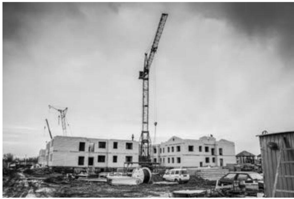
Строительство детского сада в разгаре.

Что такое бум строительства индивидуального жилья, можно увидеть на примере села Фирсово Первомайского района. Войдя в Барнаульскую агломерацию, оно растет не по дням, а по часам. Старается поспевать за такими темпами и социальная инфраструктура. Так, уже в следующем году здесь откроется детский сад, которого, к слову, в селе до сих пор не было.