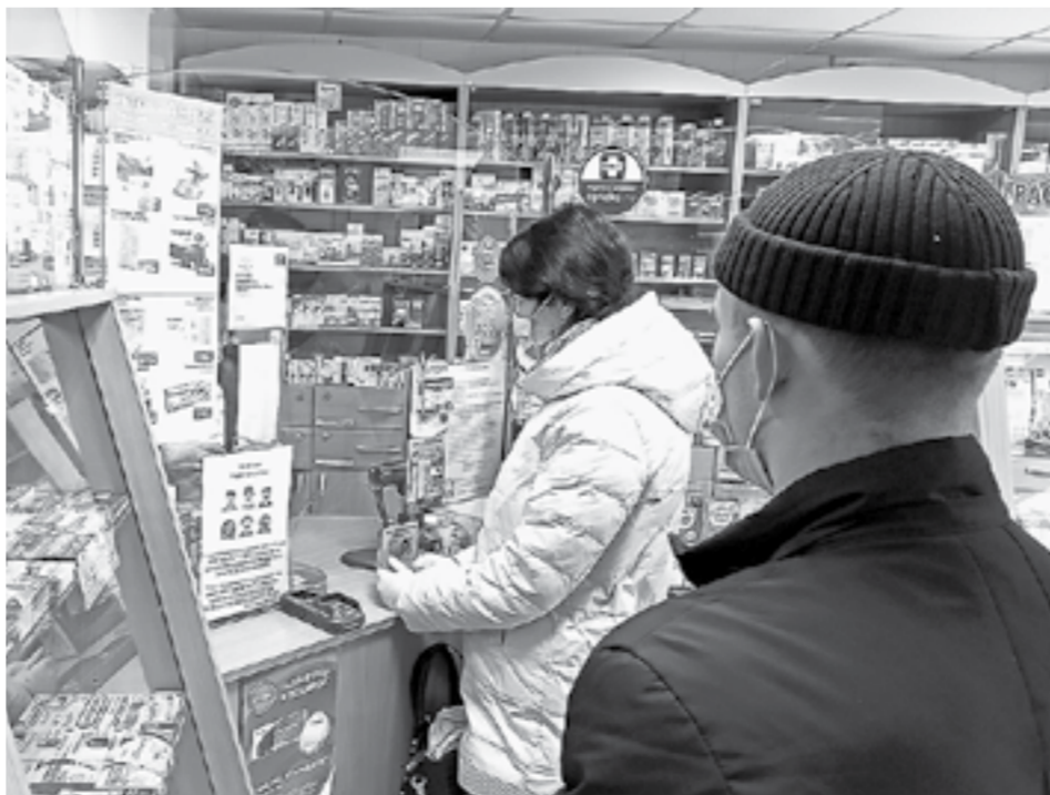
Волонтеры в Бийске помогают людям на самоизоляции, покупают лекарства, продукты.

Почти все эти направления работы уже реализуются на территории Алтайского края. Региональный штаб развернут на базе Алтайского ресурсного центра добровольчества. На территории края работают 69 муниципальных штабов, где задействованы более 400 волонтеров.