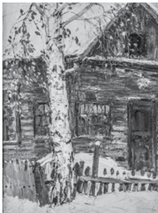
Берега у дома. Этюд на картине «1941».

Рядом с портретами художников Николая Сурикова и Сергея Кашкарова музейщики расположили небольшой пейзаж Хай-