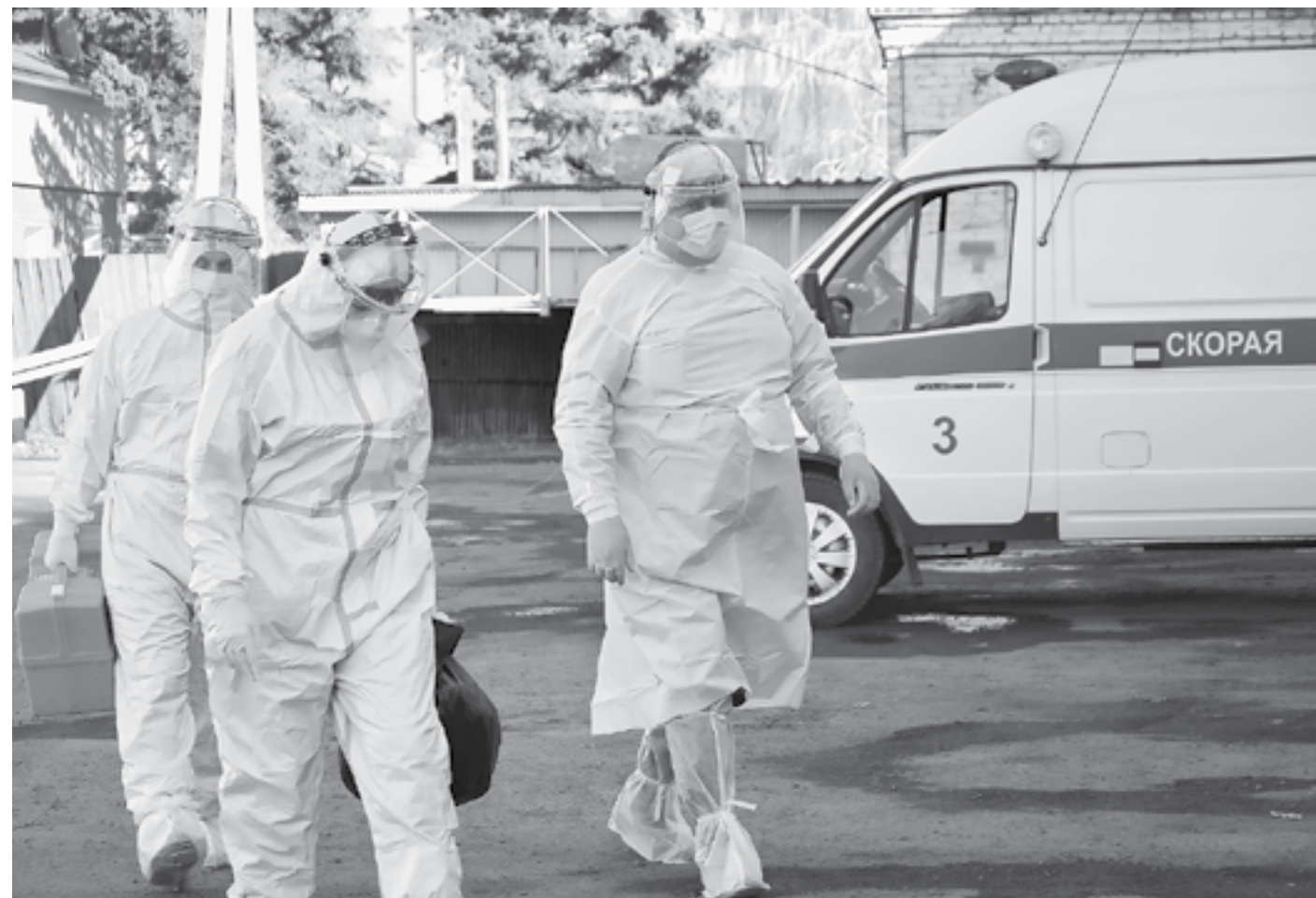
Бригада отправляется на вызов в полной экипировке.