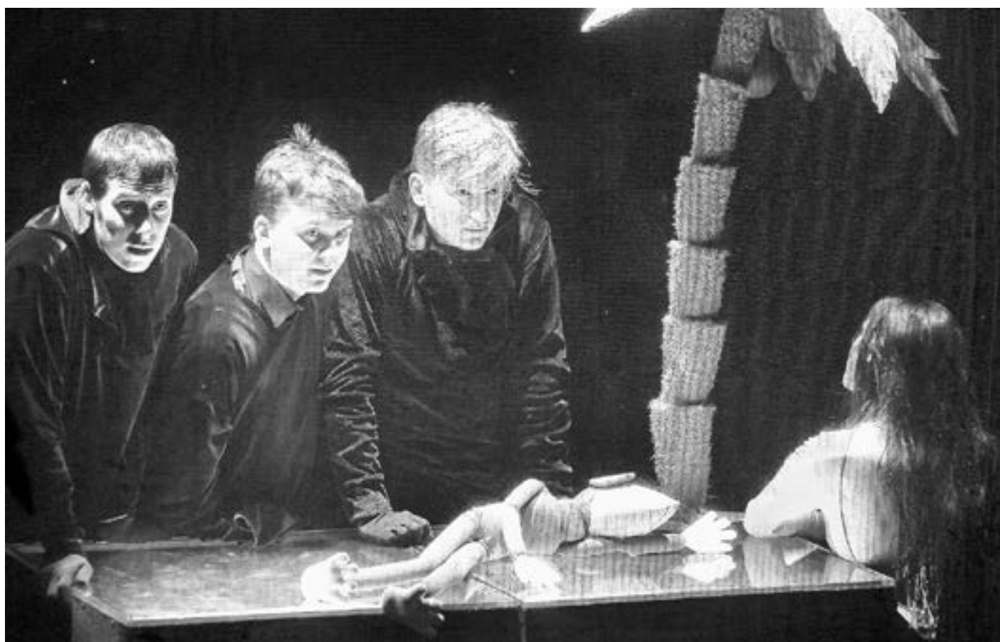
Выпускной экзамен у артистов прошел в форме кукольного концерта.