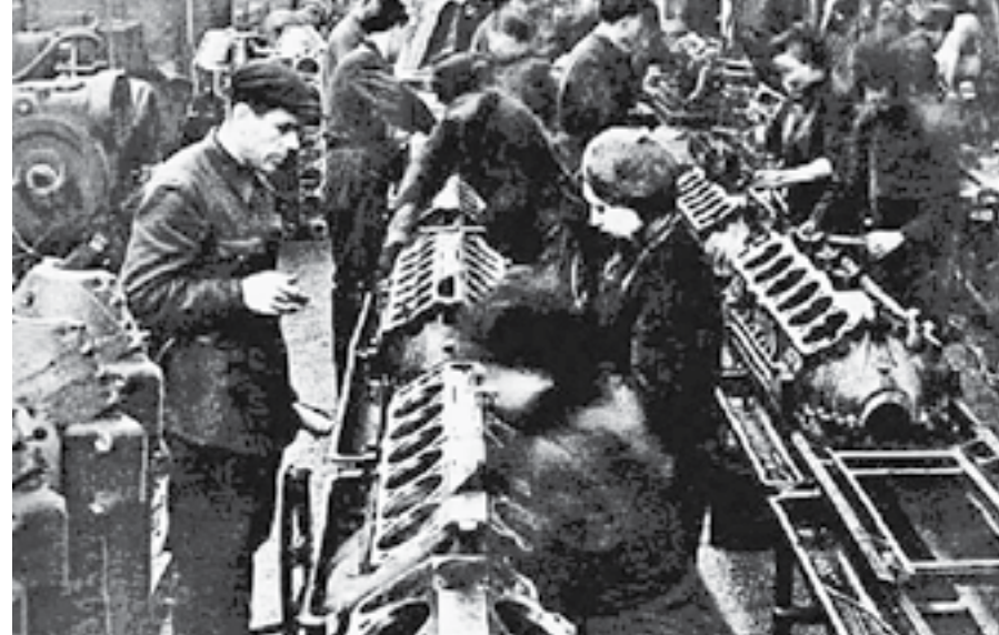
В Барнауле делали двигатели для танков.