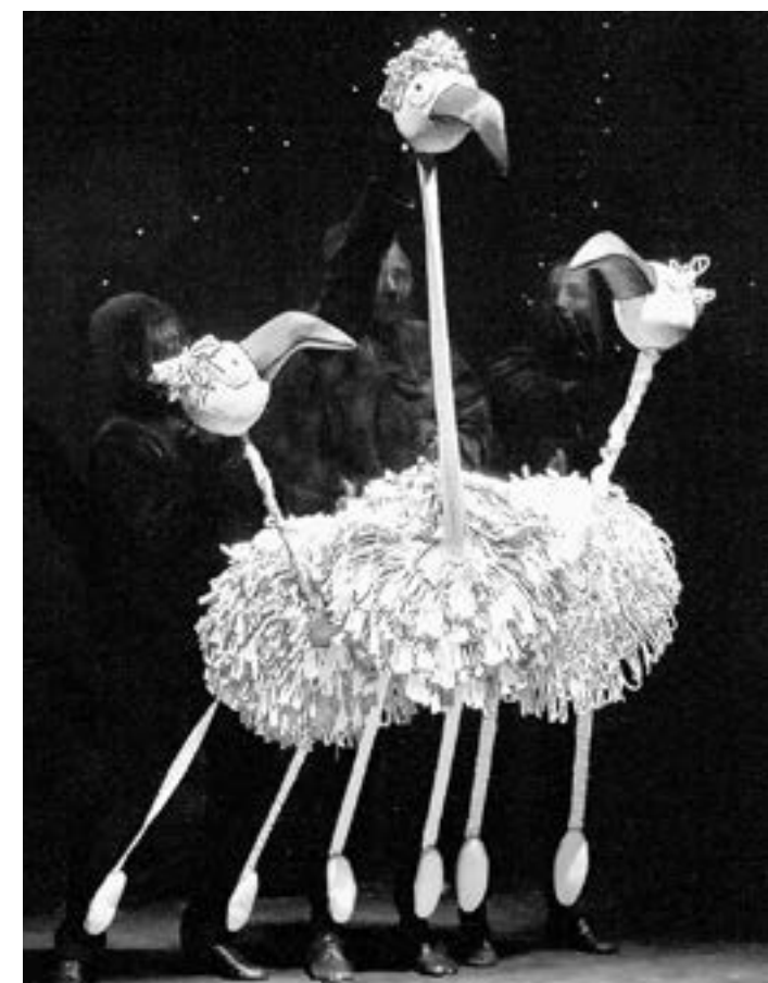
За время обучения освоены разные системы кукол.