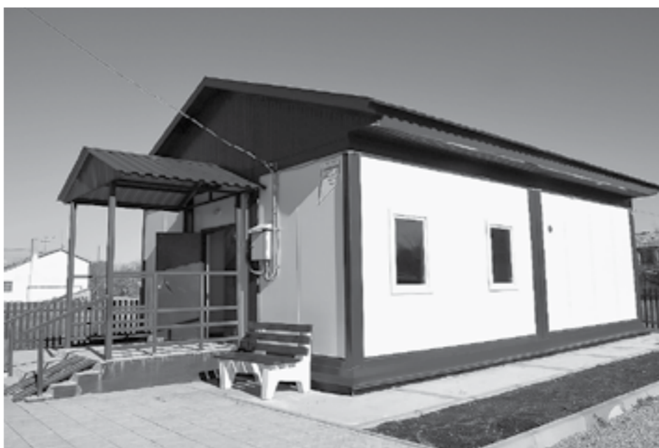
Новый ФАП построен по типовому проекту.

По словам заведующей, новый ФАП отличается от старого как небо от земли: