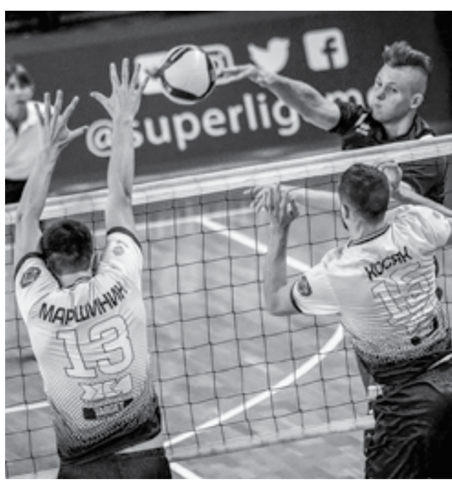
Волейболисты «Университета» отразили атаку вируса?

– К счастью, все обошлось – 23 октября сдали тесты на коронавирус, результаты у всех отрицательные. Во вторник, 27-го числа, пройдем еще одно тестирование. Если вновь все будет хорошо, то возобновим тренировки в обычном режиме. Ребята,