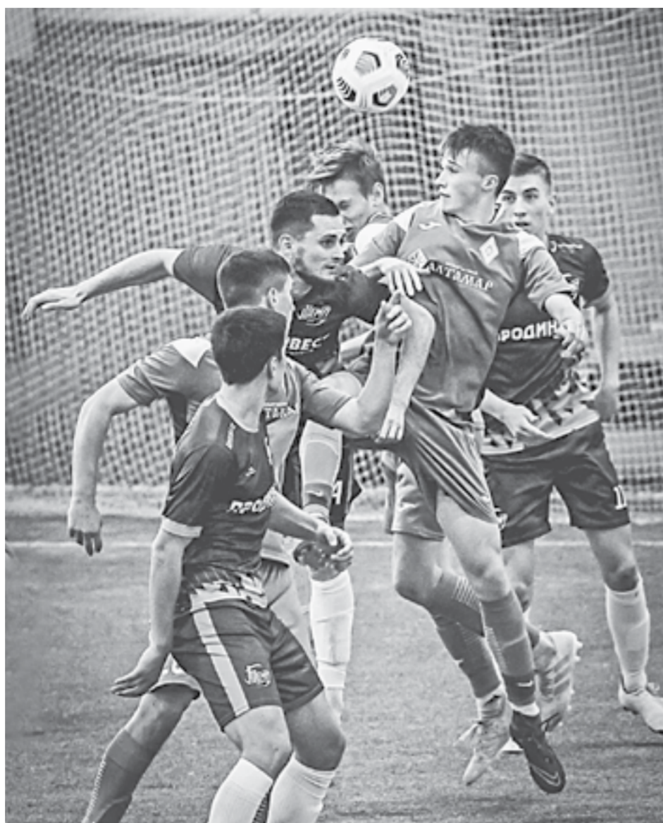
Битва на поле получилась жесткой.