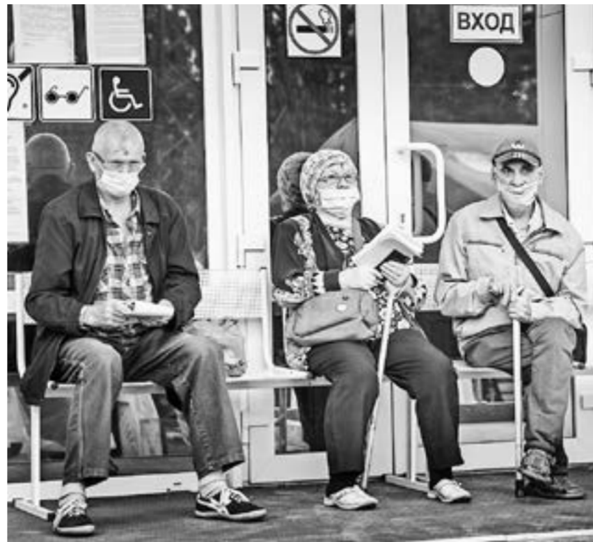
Бюджет останется социально ориентированным.

– В 2021 году мы будем не только анализировать, но и формировать всю нашу работу на основании ситуации 2020 года, то есть с учетом пандемии коронавирусной инфекции и, как следствие, замедления