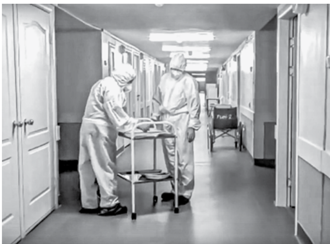
С начала эпидемии врачи работают без передышки.

или? Как работать с обращениями граждан? Возможно, концентрировать их в едином центре при краевом штабе, который создавался не площадкой для обмена мнениями представителей ведомств, а как действующий нон-стоп рабочий орган, «вылавливающий» системные и персональные сбои. Возможно, эти функции возьмет на себя созданный губернатором Центр управления регионом.