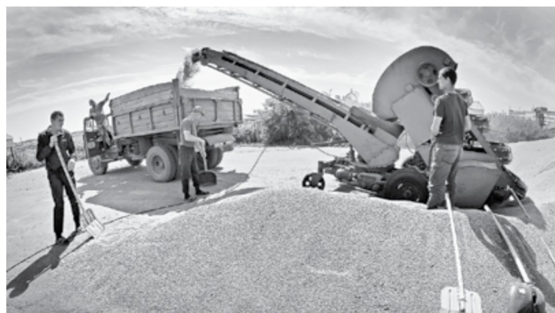
Зерна не так много, зато повысилась качество.

Засуха в Сибири привела к сокращению урожаев пшеницы в главных зерносеющих регионах СФО. Однако качество ее заметно выросло по сравнению с прошлым годом. В Алтайском крае эта тенденция проявилась ярко.