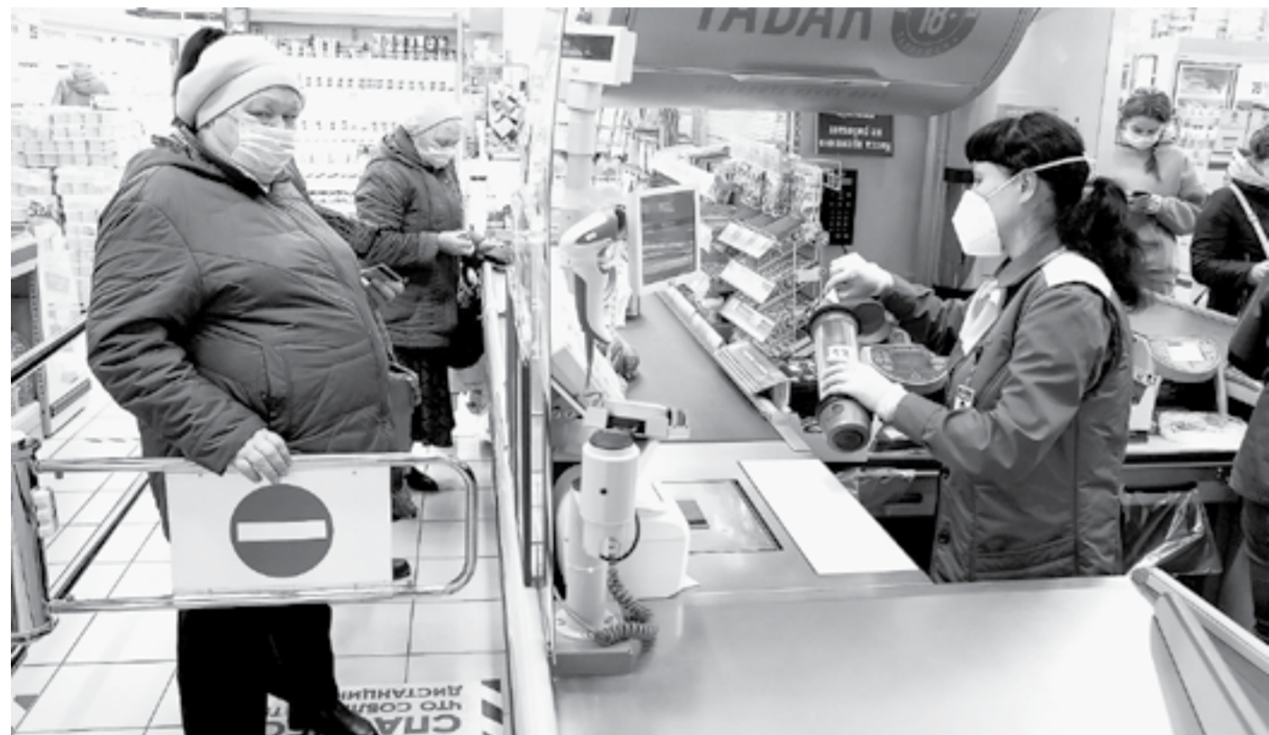
Без маски вход и обслуживание запрещены.