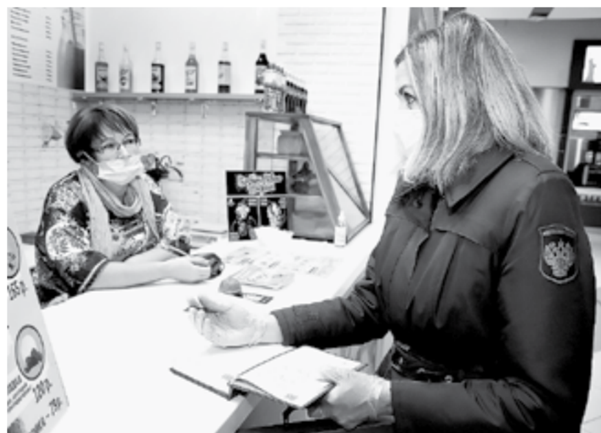
Нарушителям – предписания.