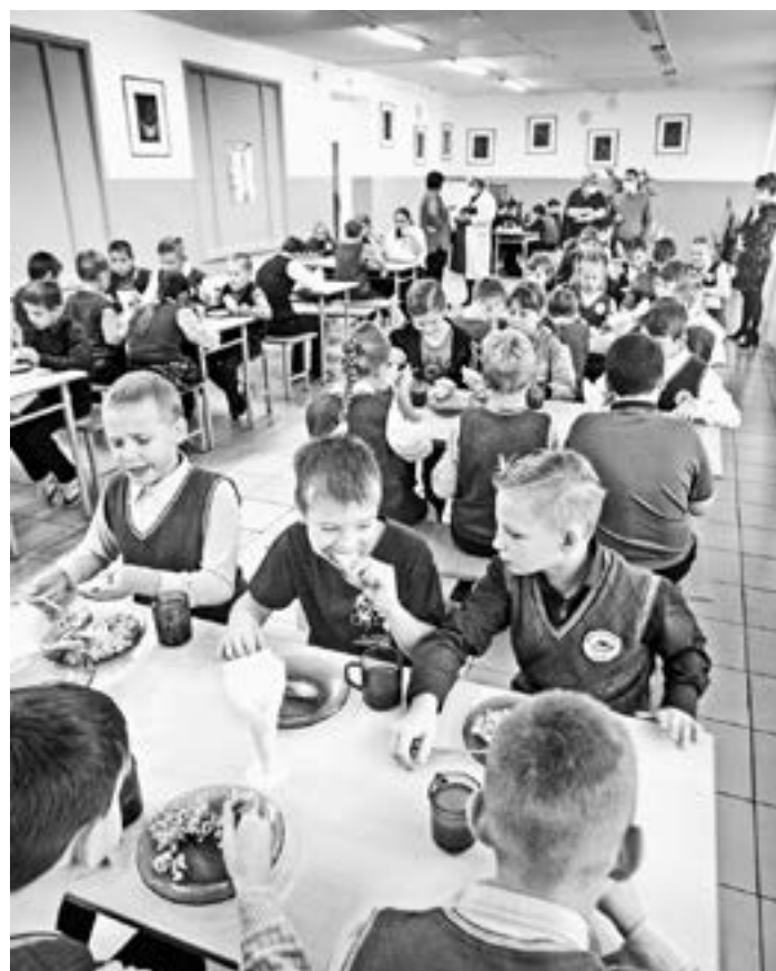
Четвертые классы на аппетит не жалуются.