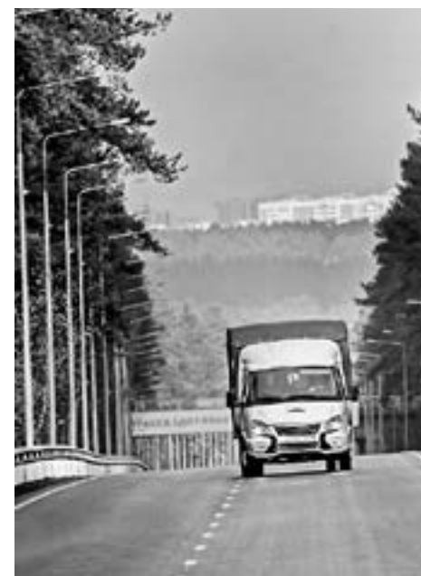
На обновленной дороге будет меньше пробок и аварий.