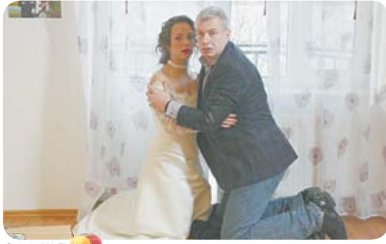
15.05 Х.ф. «УКРАДЕННАЯ СВАДЬБА» (16+)

05.10 Т.с. «Мухтар. Новый след» (16+) 06.00 Утро. Самое лучшее (16+) 08.00 Сегодня 08.25 Т.с. «Морские дьяволы. Рубежи Родины» (16+)