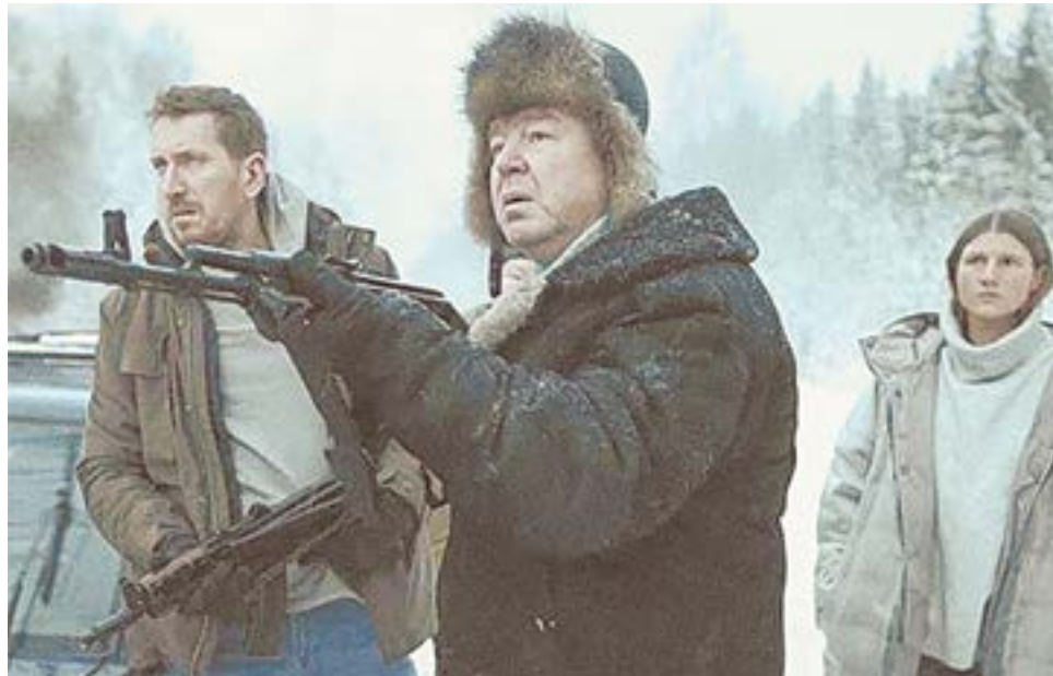
Иностранцев покорили заснеженные русские пейзажи и брутальный сюжет.