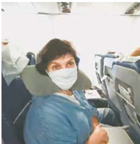
Перелет в масках – непростое испытание.

редины августа, когда открылись границы, курортный регион Анталия преодолел планку в 1 миллион туристов.