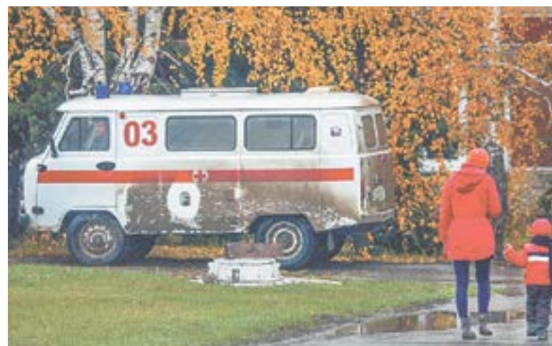
Детей в Заринск доставляет скорая.

– По факту у нас в поликлиническом звене работает сейчас два педиатра, именно это направление первичной медико-санитарной помощи – основное для нас, и его потребности мы закрываем. Могу сказать, что педиатрическая служба постепенно приходит в свое нормальное состояние. Но надо немного потерпеть, пока мы не имеем возможности организовать полноценный стационар с круглосуточным наблюдением, – поясняет ситуацию Маргарита