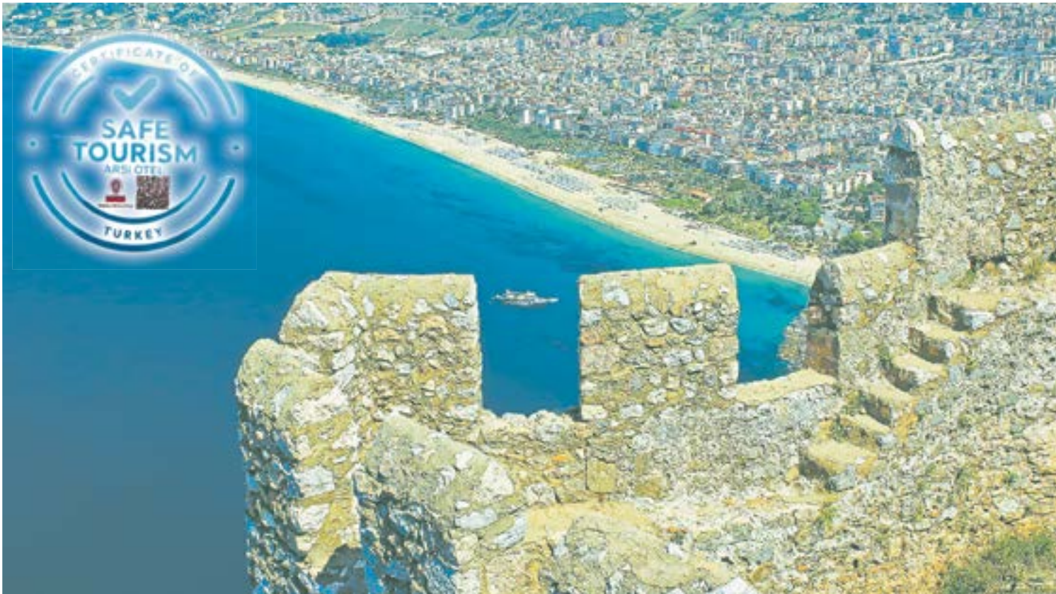
Десятки отелей красавицы Аланьи не смогли в этом году открыться из-за отсутствия сертификата безопасности.

Пока добирались в свою Аланью, гид ошарашила цифрой. За один только месяц с се-