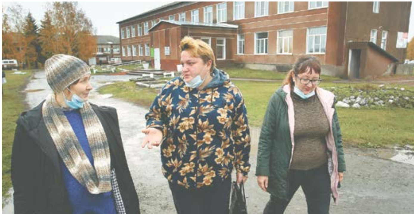
Многодетные мамы Кытманово просят открыть детское отделение.