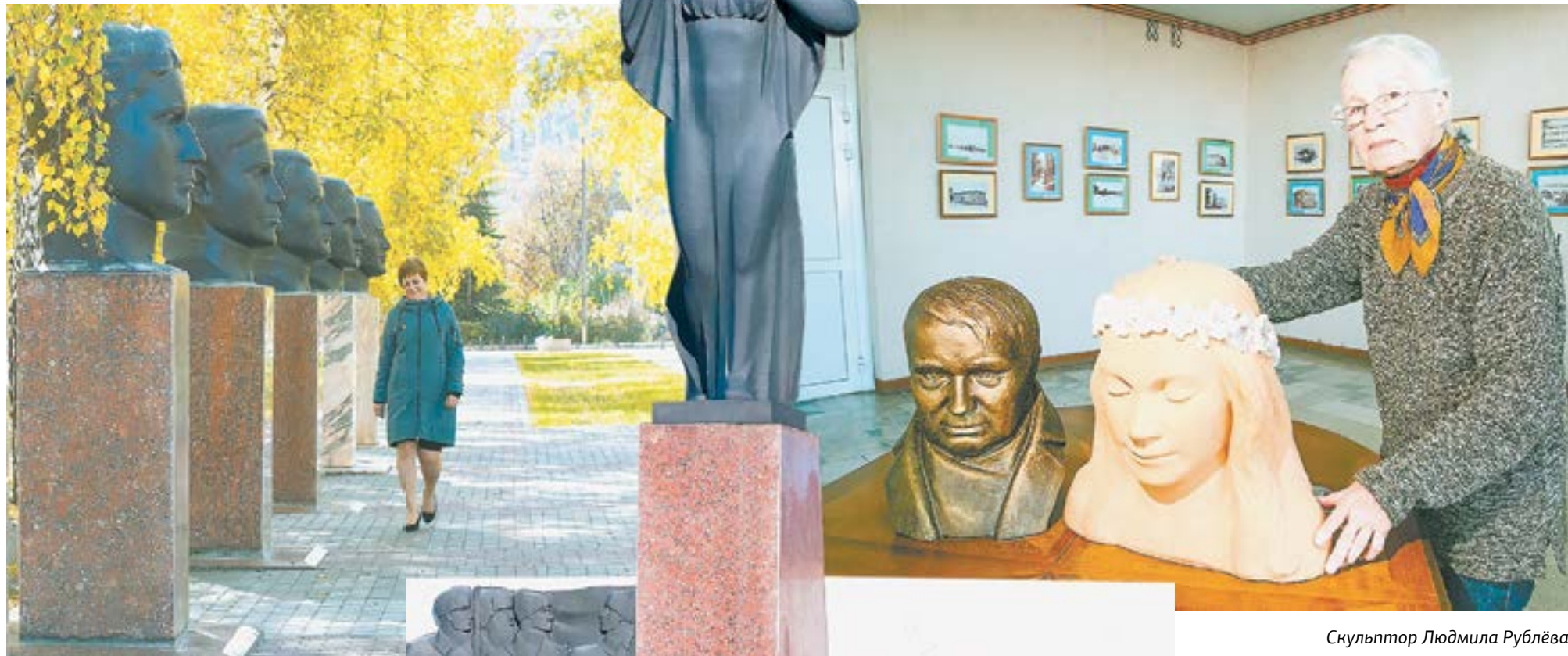
Мемориальный парк в Мамонтово.