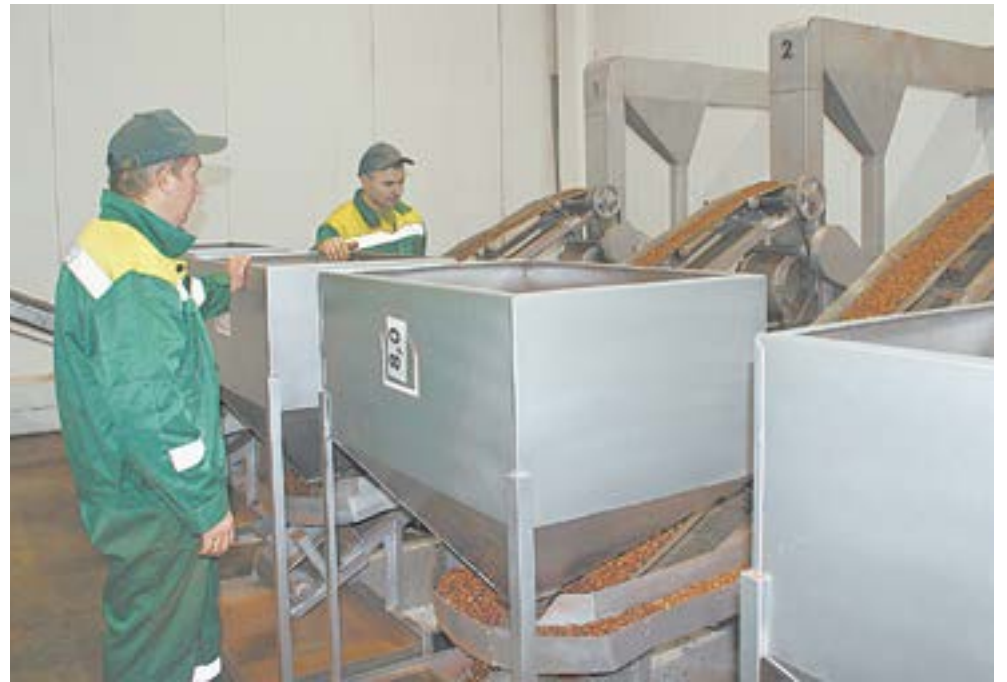
В цехе предприятия.