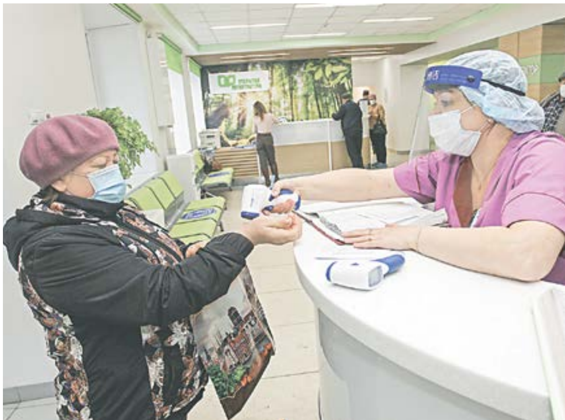
На входе в поликлинику меряют температуру.