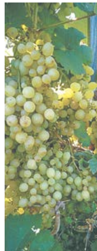
Хозяйка рада – урожаем и овощей, и ягод завидный!